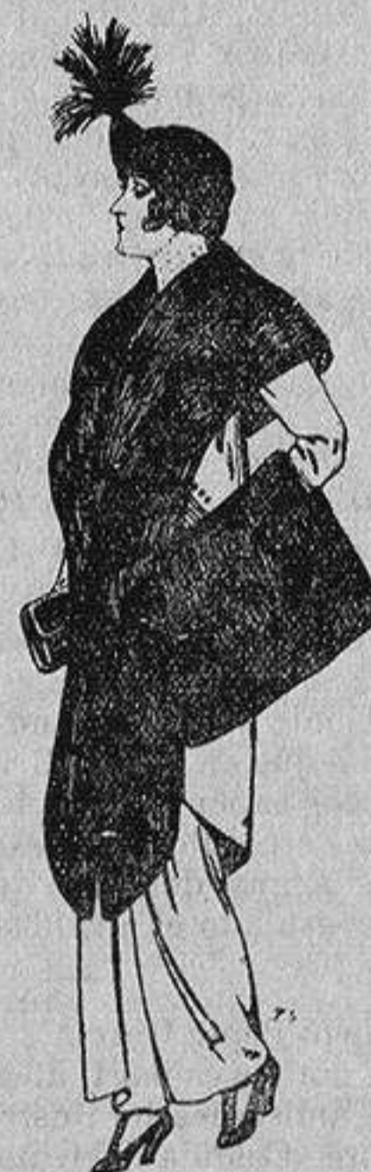
Juego de pieles de loutre de Nord para Señora 145 ptas.