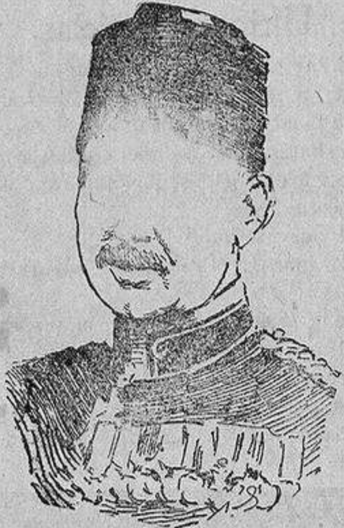
El general LIMAN VON SANDERS, jefe de la Misión instructora alemana del ejército turco, a quien ha ido a sustituir el general Von der Goltz