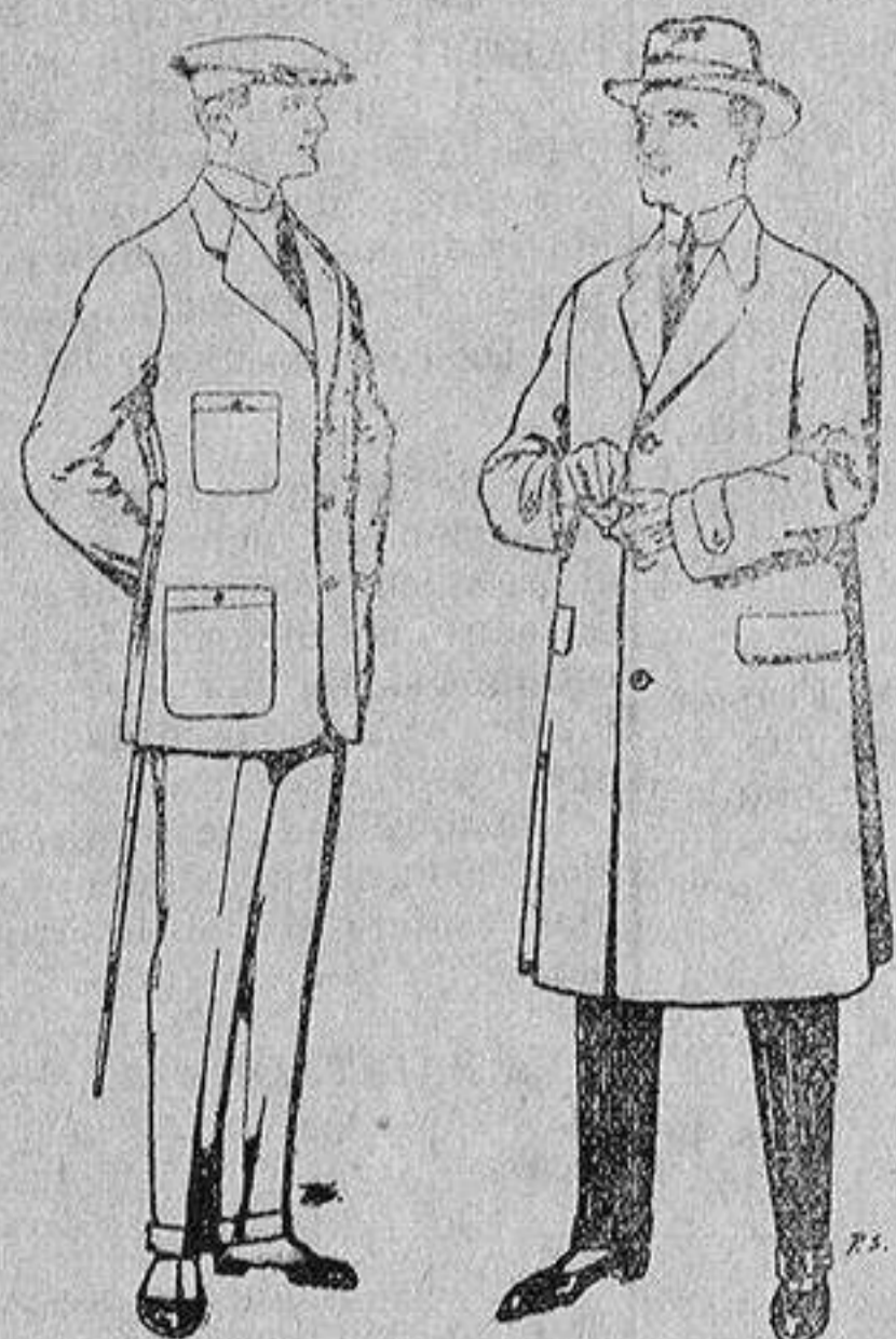
Trajes de cheviot, corte elegante para «Sportmen» De 45 a 55 ptas.

Madrid, Barcelona, Alicante, Almería, Bilbao, Cádiz, Cartagena, Gijón, Granada, Málaga, Palma de Mallorca, Santander, Sevilla, Valencia, Valladolid y Zaragoza