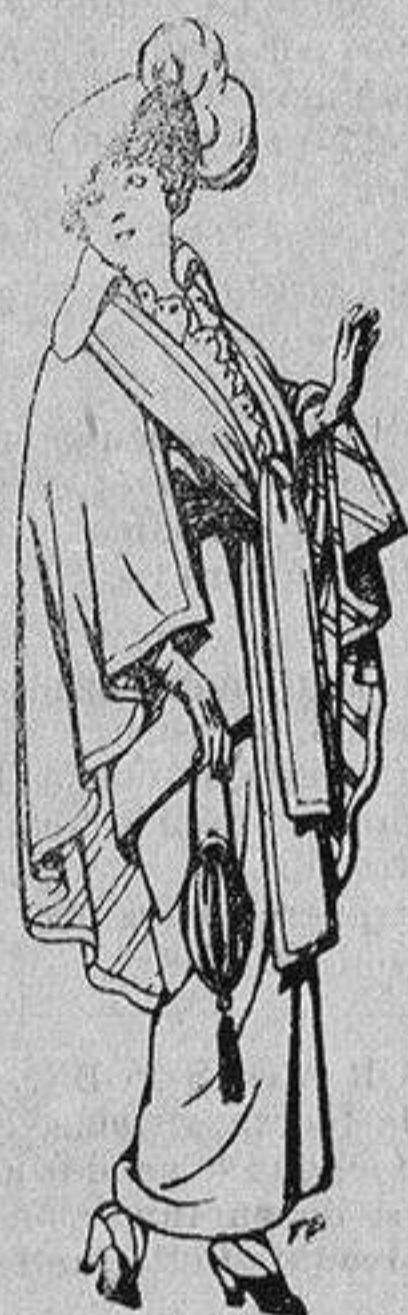
Capas de lana para señora A 20 ptas.