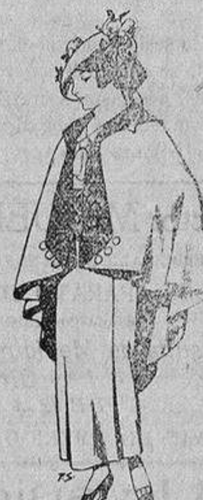
Capas de lana par jovencitas de 13 a 16 años A 25 pesetas