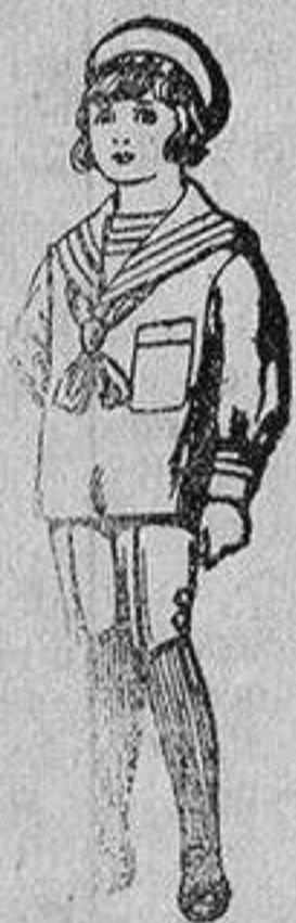
Trajes de jerga azul bordado oro en la manga para niños de 4 a 9 años De 20 a 22 ptas.