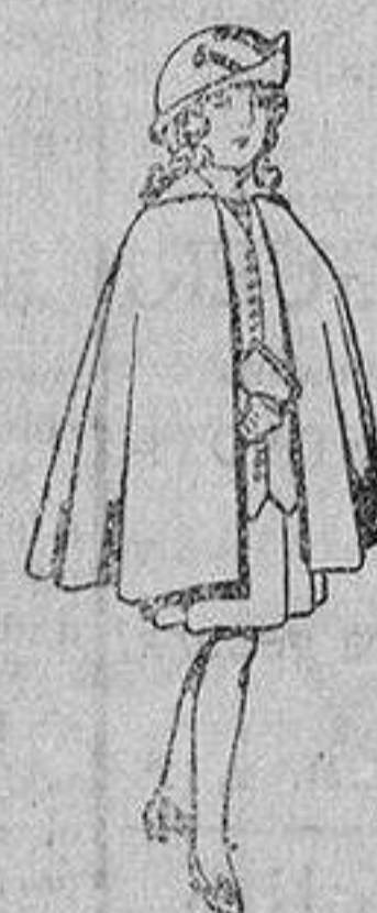
Capas de lana para niñas de 4 a 12 años De 20 a 22 ptas.