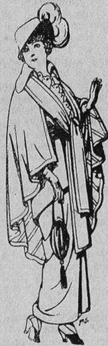
Capas de lana para señora A 20 ptas.

Ropas confeccionadas para Caballero, Señora, Niño y Niña