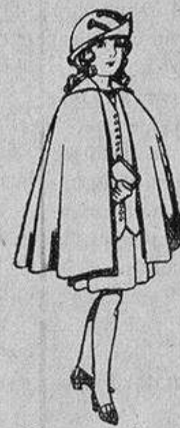
Capas de lana para niñas de 4 a 12 años De 20 a 22 ptas.