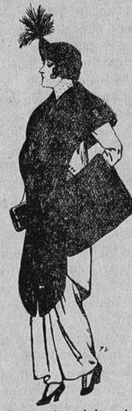
Juego de pieles de loutre de Nord para Señora 145 ptas.

Ropas confeccionadas para Caballero, Señora, Niño y Niña