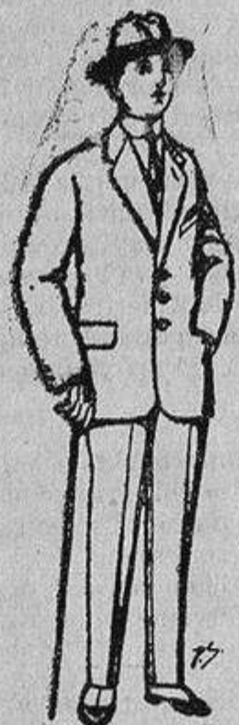
Trajes de paten, vicuña, etc., para niños de 10 a 16 años De 13 a 48 ptas.