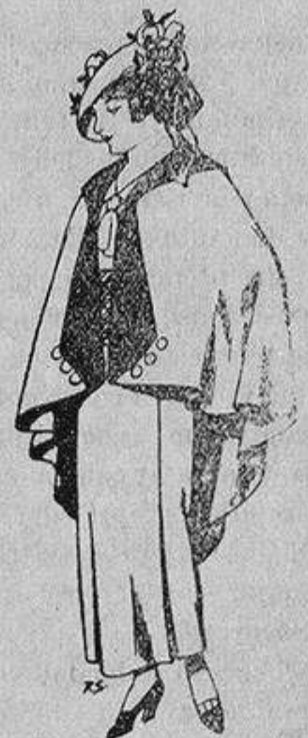
Capas de lana para jovencitas de 13 a 16 años A 25 pesetas

SECCIONES: Peletería, Camisería, Géneros de Punto, Corbatería, Guantería, Sombrerería, Zapatería, Paraguas, Bastones y Artículos de Viaje.