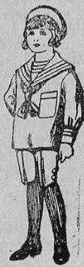
Trajes de jerga azul bordado oro en la manga para niños de 4 a 9 años De 20 a 22 ptas.