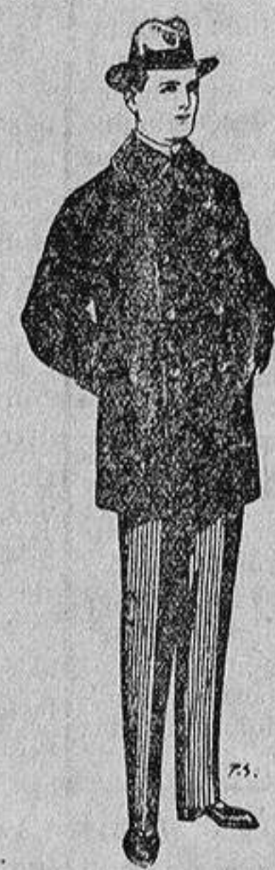
Pellizas con cuello y bocamangas de astrakan De 11 a 40 ptas