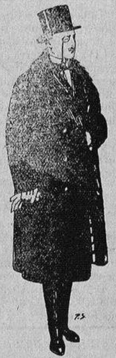
Gabanes de edredón negro, forro seda, cuello y vistas de piel a 125 ptas.