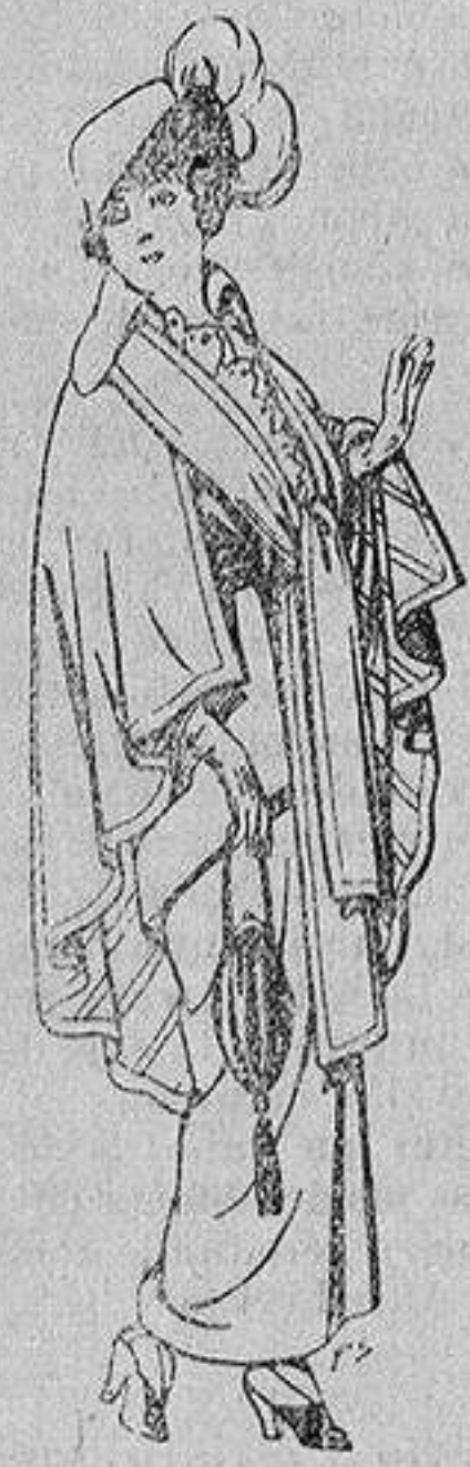
Capas de lana para señora A 20 ptas.

Ropas confeccionadas para Caballero, Señora, Niño y Niña