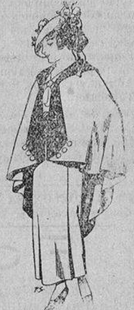
Capas de lana para jovencitas de 13 a 16 años A 25 pesetas

SECCIONES: Peletería, Camisería, Géneros de Punto, Corbatería, Guantería, Sombrerería, Zapatería, Paraguas, Bastones y Artículos de Viaje.