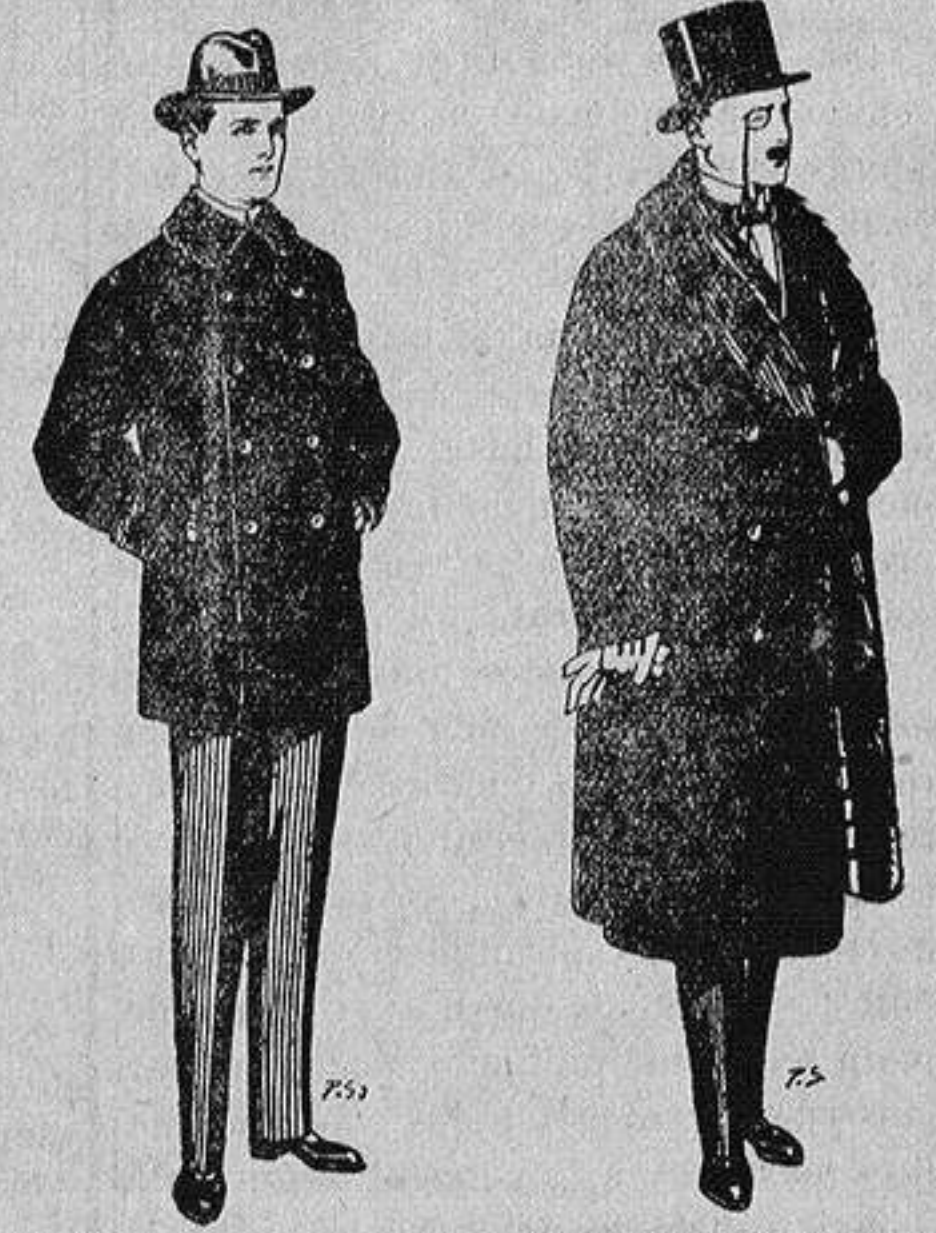
Pellizas con cuello y bocamangas de astrakan De 11 a 40 ptas