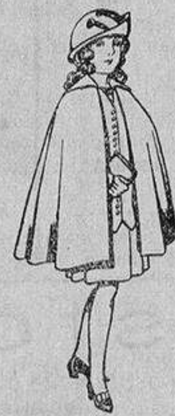
Capas de lana para niñas de 4 a 12 años De 20 a 22 ptas.