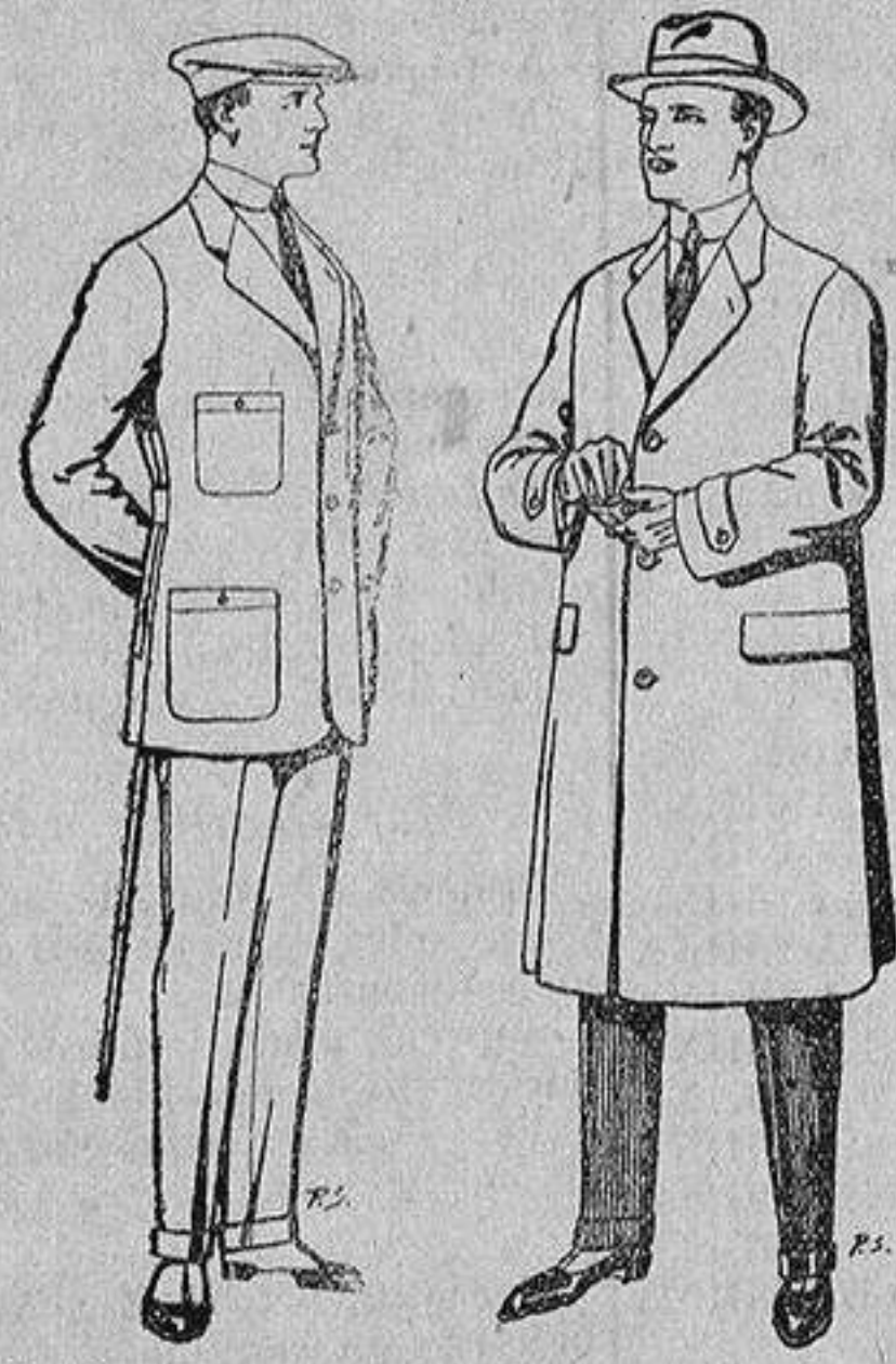
Trajes de cheviot, corte elegante para «Sportmen» De 45 a 55 ptas.

Madrid, Barcelona, Alicante, Almería, Bilbao, Cádiz, Cartagena, Gijón, Granada, Málaga, Palma de Mallorca, Santander, Sevilla, Valencia, Valladolid y Zaragoza