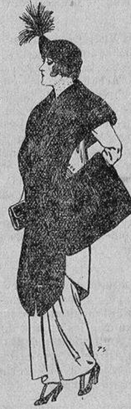
Juego de pieles de loutre de Nord para Señora 145 ptas.

Ropas confeccionadas para Caballero, Señora, Niño y Niña