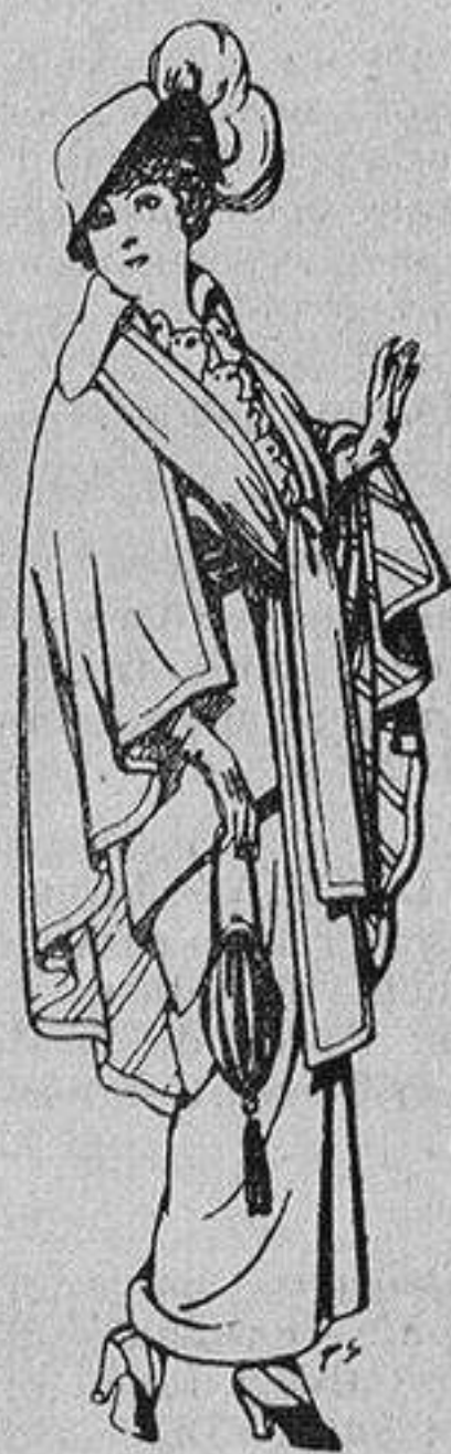
Capas de lana para señora A 20 ptas.