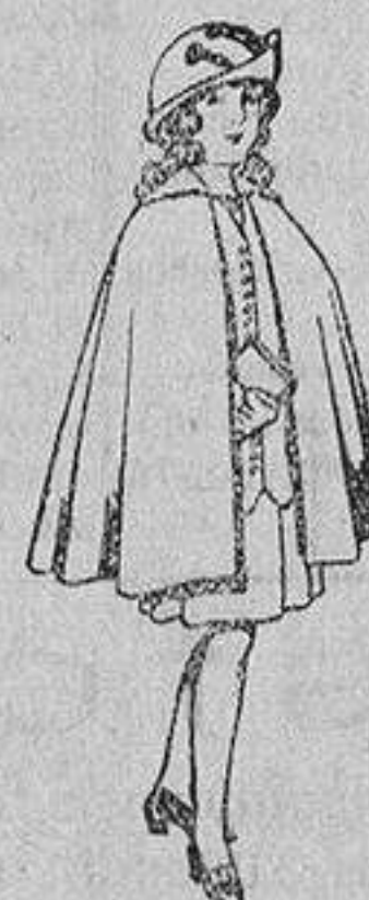
Capas de lana para niñas de 4 a 12 años De 20 a 22 ptas.