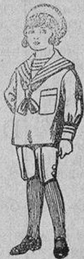
Trajes de jerga azul bordado oro en la manga para niños de 4 a 9 años De 20 a 22 pts

Ropas confeccionadas para Caballero, Señora, Niño y Niña