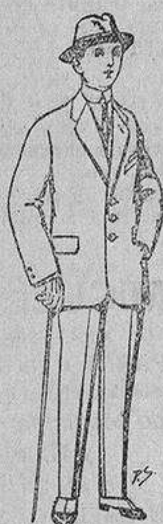
Trajes de patea, vicuña, etc., para niños de 10 a 16 años De 13 a 48 ptas.