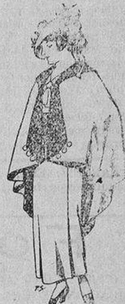
Capas de lana para jovencitas de 13 a 16 años A 25 pesetas

SECCIONES: Peletería, Camisería, Géneros de Punto, Corbatería, Guantería, Sombrerería, Zapatería, Paraguas, Bastones y Artículos de Viaje.