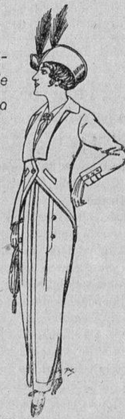
Trajes jerga negra para Señora 65 ptas.