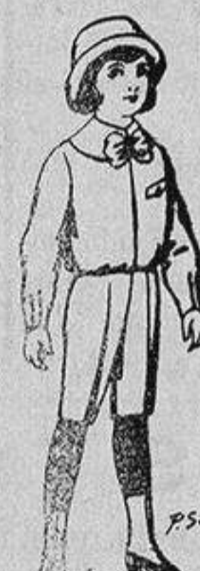
Trajes patén pa-rra niños de 4 a 9 años De 5 a 5'50 ptas.

SECCIONES: Peletería, Camisería, Gé-neros de Punto, Corbatería, Guante-ría, Sombrerería, Zapatería, Paraguas, Bastones y Artículos de Viaje.