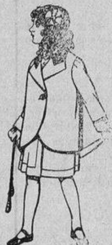
Trajes de lanilla para niños de 4 a 12 años De 14 a 22 ptas.

Ropas confeccionadas para Caballero, Señora, Niño y Niña