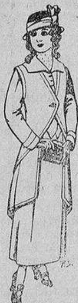
Trajes de lanilla para jovencitas de 13 a 16 años De 40 a 45 ptas.