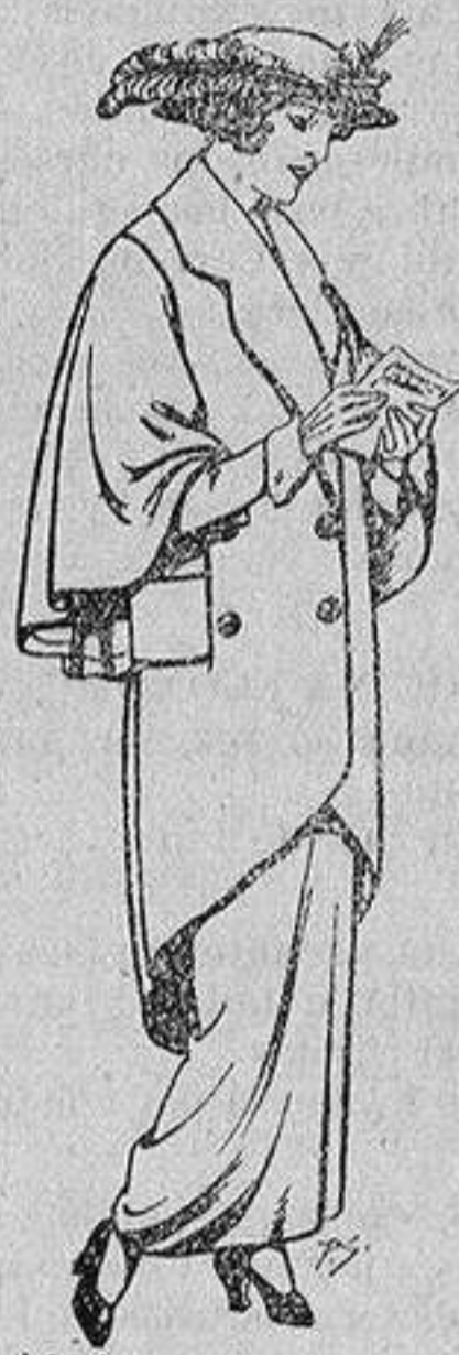
Abrigos de patén para Señora De 55 a 65 ptas.