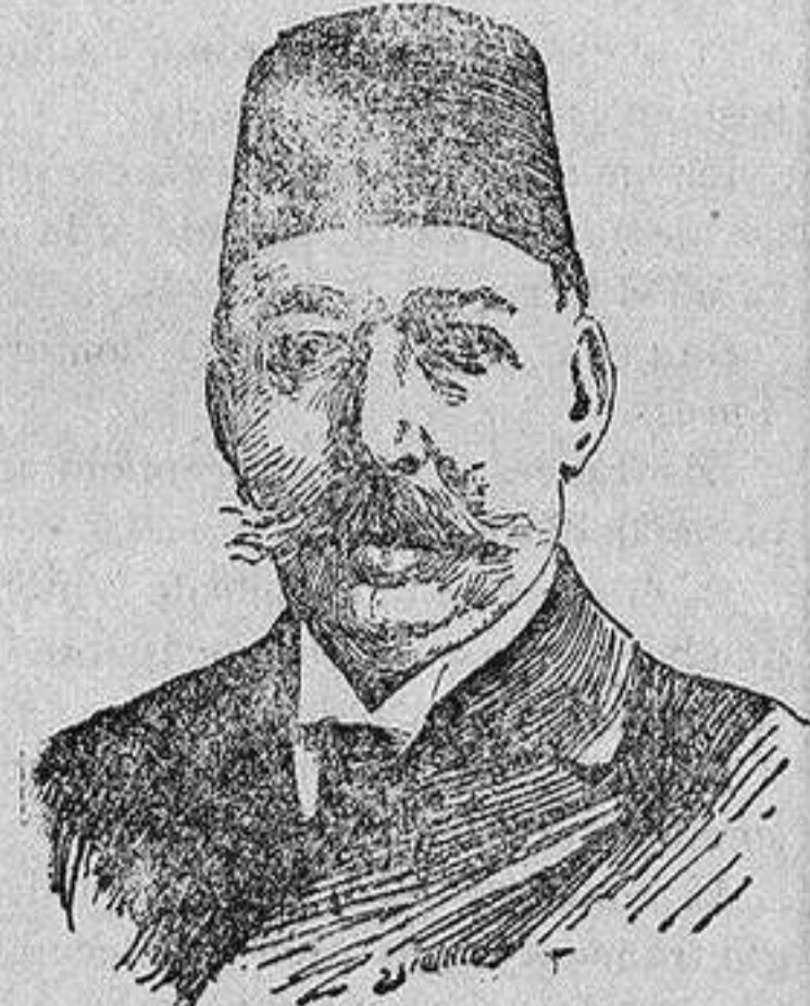
MAHOMET RECHAD KHAN V. sultán de Turquía