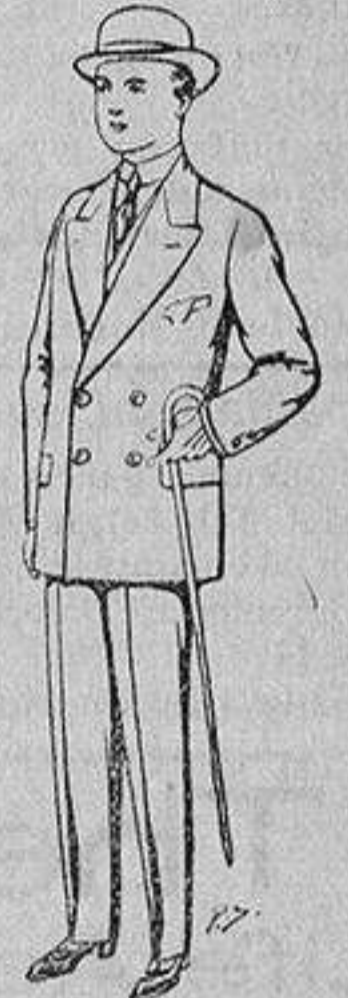
Trajes de patén, vi-cuña etc., para niños de 10 a 16 años De 25 a 48 pesetas.

SECCIONES: Peletería, Camisería, Géneros de Punto, Corbatería, Guantería, Sombrerería, Zapatería, Paraguas, Bastones y Artículos de Viaje.