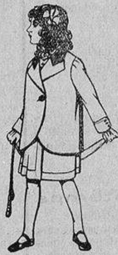
Trajes de lanilla para niños de 4 a 12 años De 14 a 22 ptas.

Ropas confeccionadas para Caballero, Señora, Niño y Niña