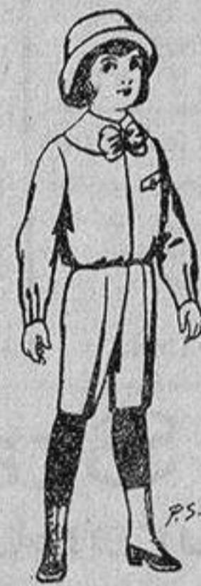
Trajes patén para niños de 4 a 9 años De 5 a 5'50 ptas.