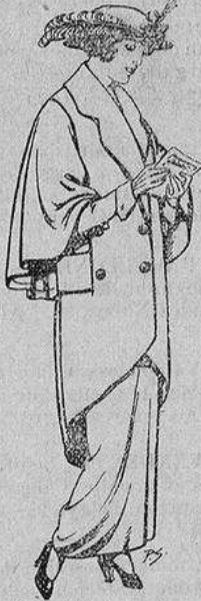
Abrigos de patén para Señora De 55 a 65 ptas.