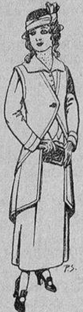
Trajes de lanilla para jovencitas de 13 a 16 años De 40 a 45 ptas.