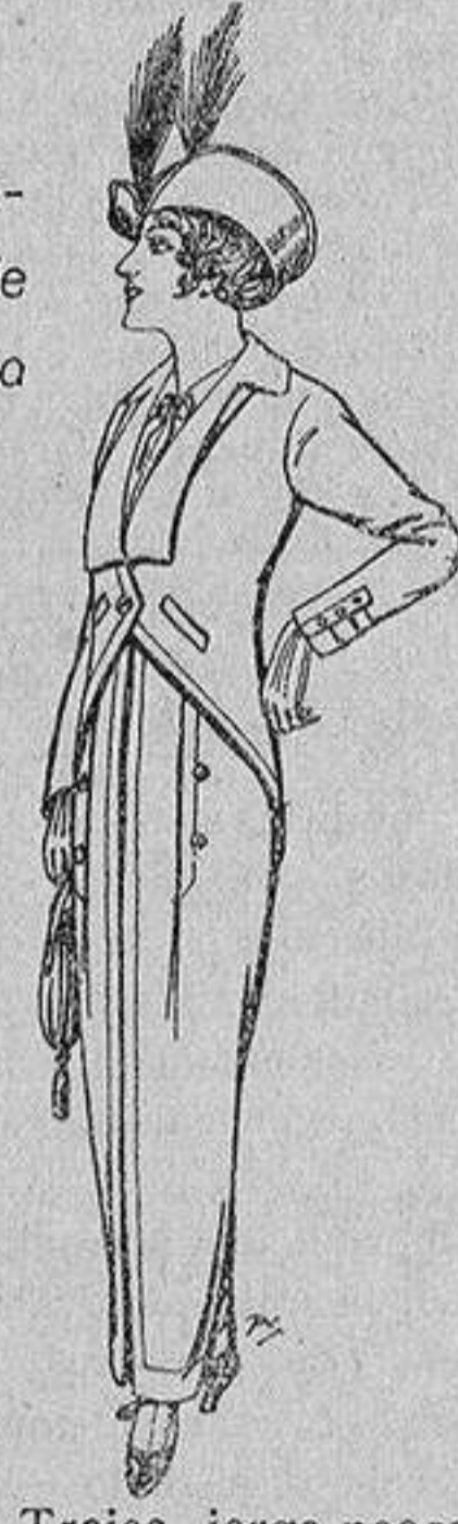
Trajes jerga negra para Señora 65 ptas.

Ropas confeccionadas para Caballero, Señora, Niño y Niña