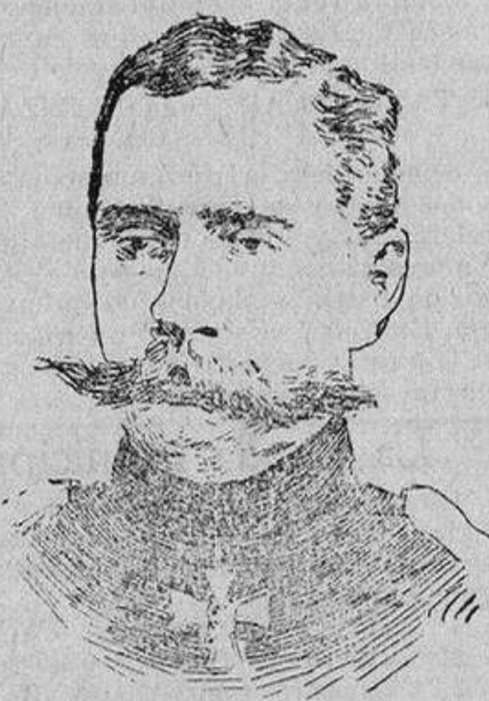
EL GENERAL RENNENKAMPF comandante en jefe del ejército ruso que opera en la Prusia oriental