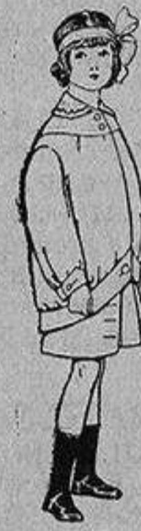
Trajes de lanilla para niños de 4 a 12 años De Ptas. 20 a 30

PRECIO FIJO y VENTAS AL CONTADO. PIDASE EL CATALOGO GENERAL.