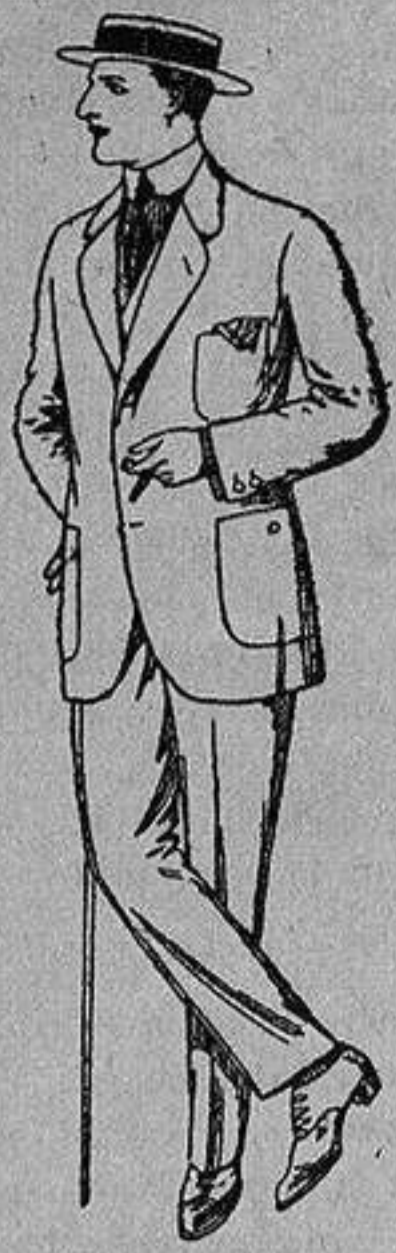
Trajes de dril crudo kaki o listado De Ptas. 10 a 32

Madrid, Barcelona, Alicante, Almería, Bilbao, Cádiz, Cartagena, Gijón, Granada, Málaga, Palma de Mallorca, Santander, - Sevilla, Valencia, Valladolid y Zaragoza -