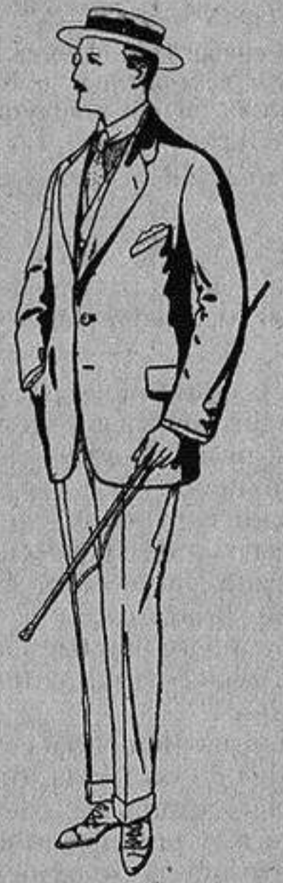
Trajes de alpaca uoera De Ptas. 32 a 56