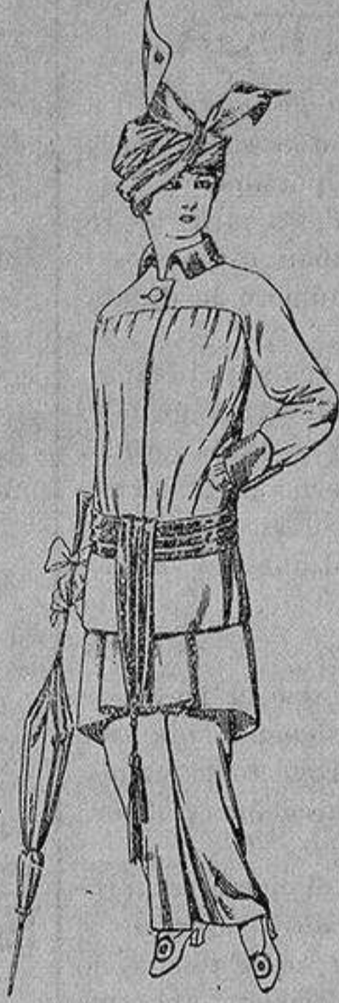
Traje de jerga azul o negra y géneros novedad, para señora De Ptas. 65 a 80