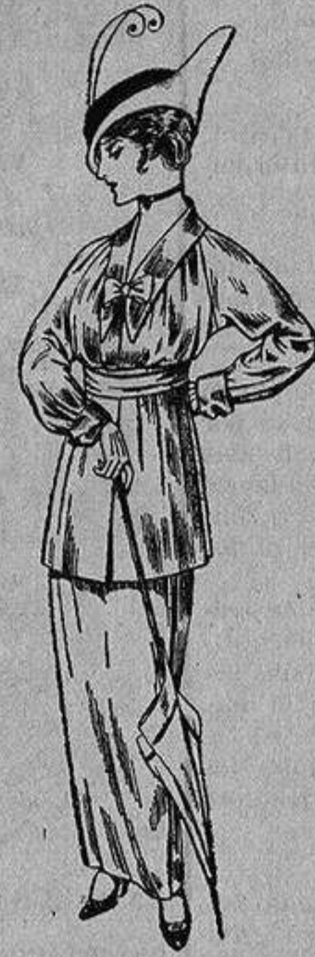
Vestido de lana negra o azul para señora De Ptas. 35 a 40