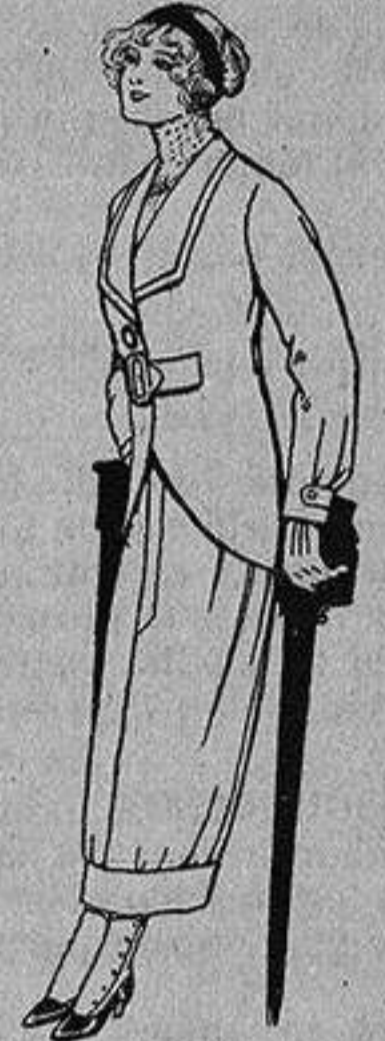
Trajes de lanilla para jovencitas de 13 a 16 años A Ptas. 27