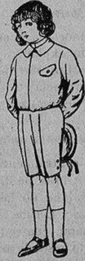
Trajes de lanilla, vicuña o jerga, para niños de 4 a 9 años De Ptas. 5 a 10