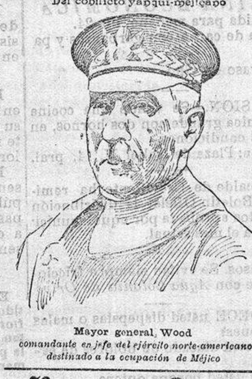
Del conflicto yapqui-melcano Mayor general Wood comandante en jefe del ejército norteamericano destinado a la ocupación de Méjico

BOLSA Y EFECTOS DE GIRO Corveza LA CRUZ BLANCA de Santander — Laureada y superior a todas — Pídase en los principales establecimientos Depósito exclusivo en ALICANTE AMANDO ALBEROLA — Despacho: San Fernando, 65, 1.º