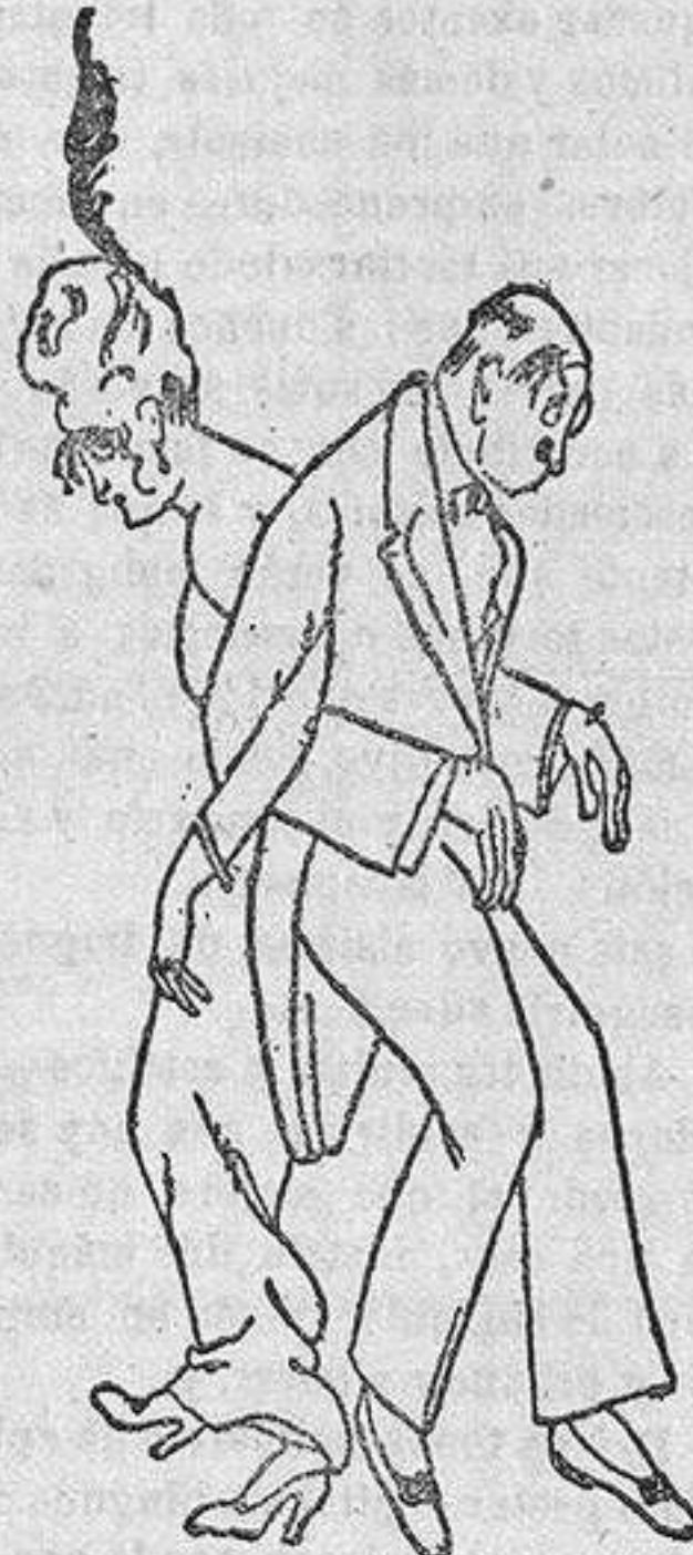
Como bailarían nuestros elegantes el tango argentino en vista de los anatemas lanzados contra esta danza