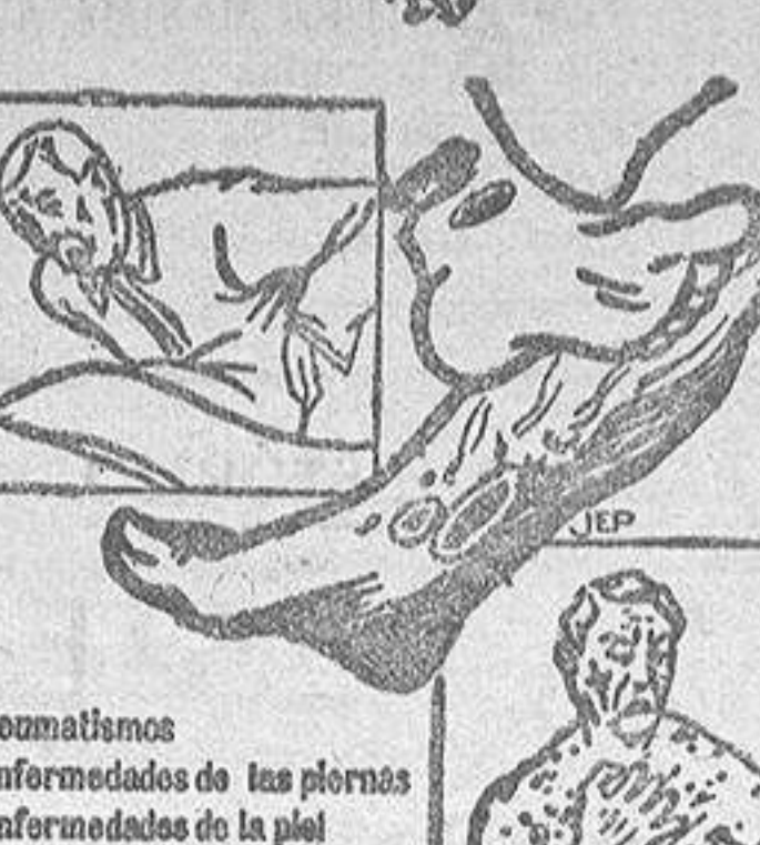
Rumatisms Enfermedades de las piernas Enfermedades de la piel Astoria-esclerosis

El Rey despachó a mediodía con el jefe del Gobierno y con los Ministros de la Gobernación y de Hacienda.