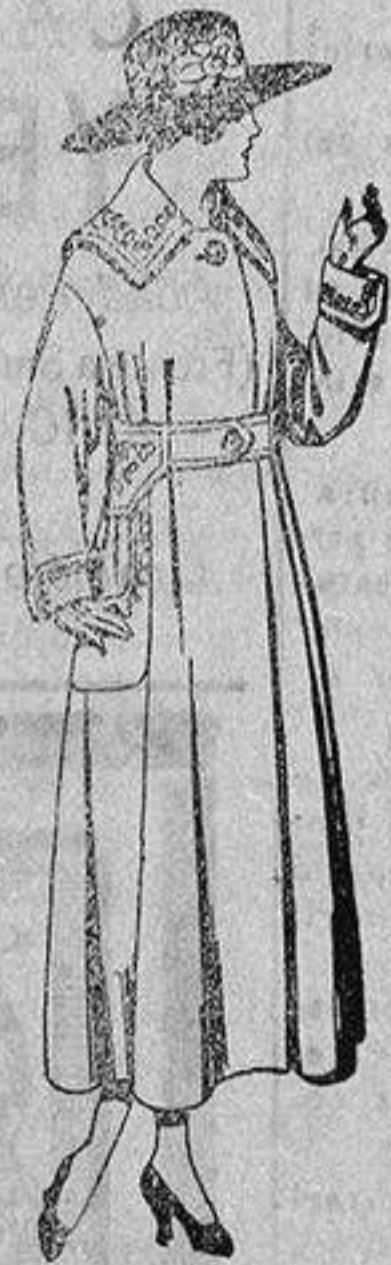
Abrigos de gabardina, pañete, etc., en azul y color bordados, de ptas. 75 a 95.