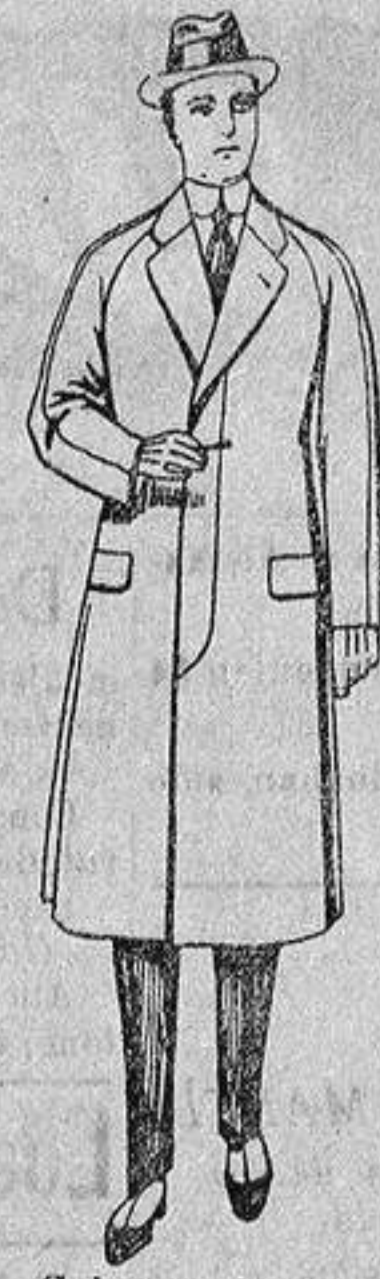
Gabanes de patén, melton o cheviot, con forro de seda, satén o escocés, de ptas. 50 a 100.

Madrid, Barcelona, Alicante, Almería, Bilbao, Cádiz, Cartagena, Gijón, Granada, Málaga, Palma de Mallorca, Santander, Sevilla, Valencia, Valladolid y Zaragoza.