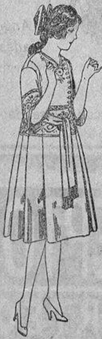
Vestidos de sarga inglesa azul, bordados, para jovencitas de 12 a 15 años, de ptas. 42 a 46.