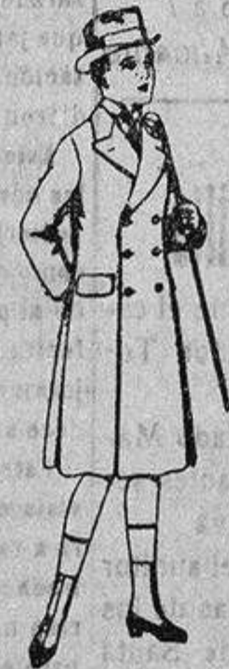
Trajes de patén, vicuña, etc., para niños de 10 a 12 años, de ptas. 28 a 50. Los mismos, para jóvenes de 13 a 16 años, de ptas. 25 a 53.