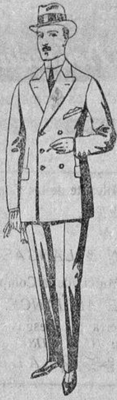
Trajes de creviot, melton, etc., de ptas. 28 a 85. Los mismos en vicuña o jerga, de 32 a 90.