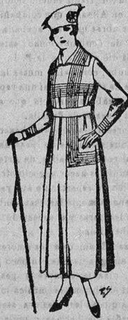
Vestidos de gabardina, es- Gabanes de patén mismos, para jóvenes de tambre, en negro, azul y para niños de 4 a 9 años, de ptas. 25 a 65.