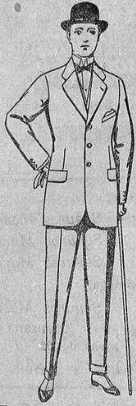
Traje de creviot, melton, etcétera, de ptas. 25 a 85. Los mismos en vicuña o gerga, de ptas. 30 a 90.