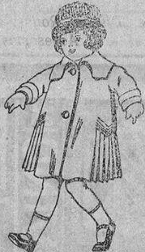
Abrigos de pañete, gamuzas, etc., para niños de 4 a 9 años, de ptas. 24 a 36.