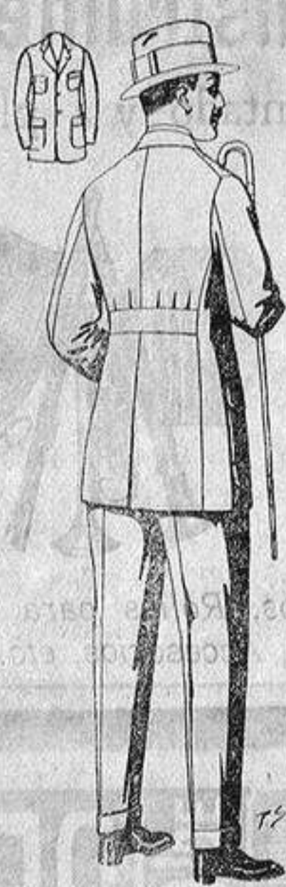
Traje modelo sport, de lanilla, cheviot, etc. De ptas. 35 a 70 Los mismos en dril, beige o kaki. De ptas. 15 a 38