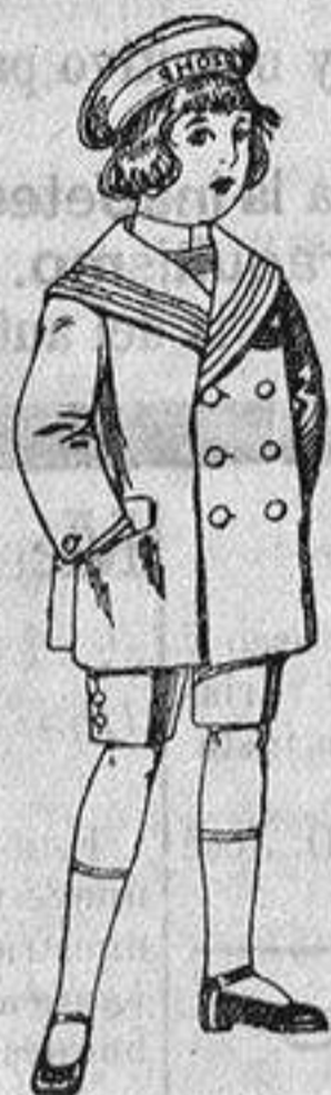
Traje matelot de vicuña o jerga azul para niños de 4 a 9 años. De ptas. 14 a 32