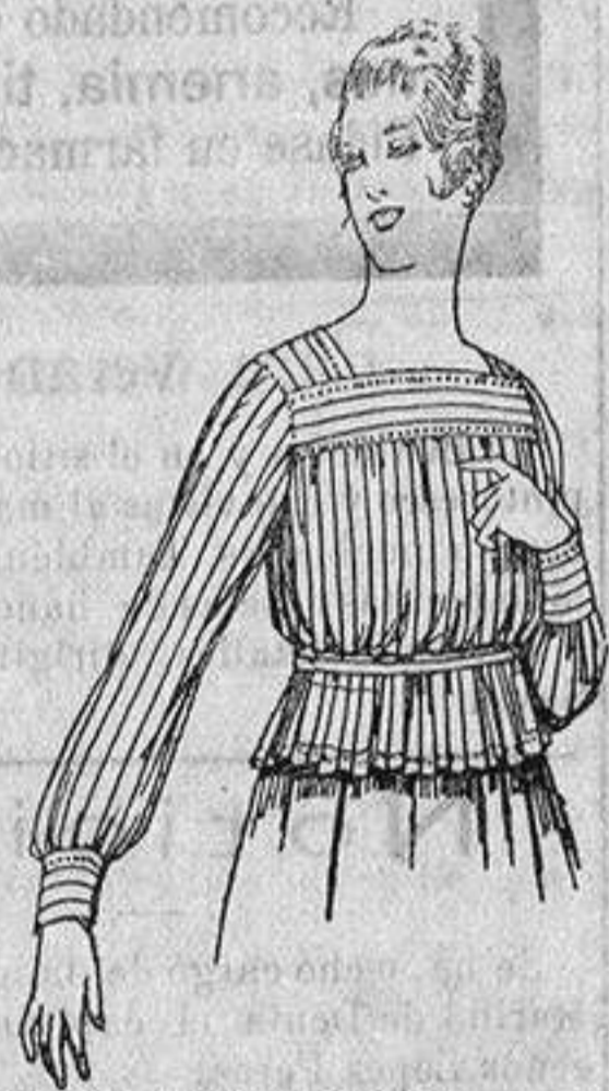
Blusa de batista listada. a ptas. 4'50.

Ropas confeccionadas para Caballero Señora, Niño y Niña