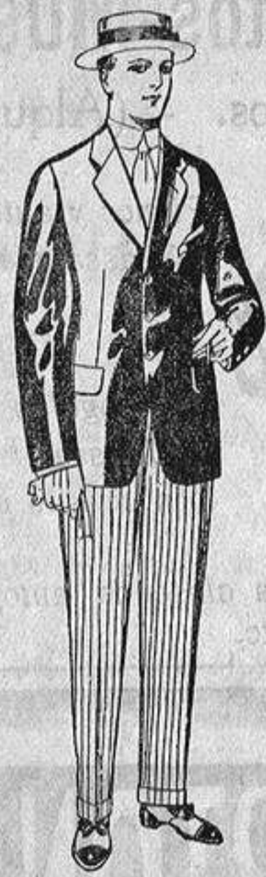
Traje de alpaca negra. De ptas. 32 a 56. Pantalones de franela blanca o listada. De ptas. 15 a 25.

Madrid, Barcelona, Alicante, Almería, Bilbao, Cádiz, Cartagena, Gijón, Granada, Málaga, Palma de Mallorca, Santander, Sevilla, Valencia, Valladolid y Zaragoza.