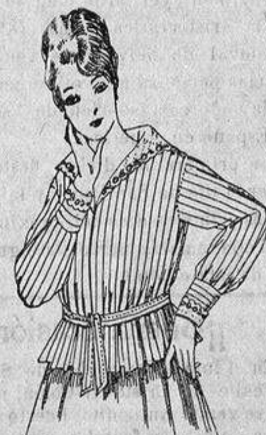
Blusa voile listada, cuello or- gandín bordado. a ptas. 9'50

Gamisería, Géneros de Punto, Corbatería, Guantería, Sombrerería, Zapatería, Bastones Paraguas y Artículos de Viaje