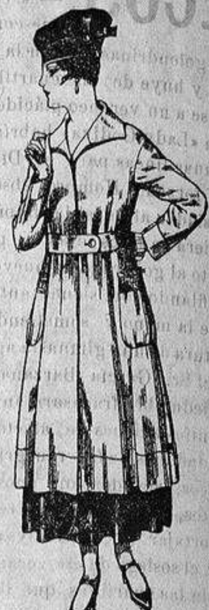
Abriego de tricot de lana colores lisos. De ptas. 63 a 75