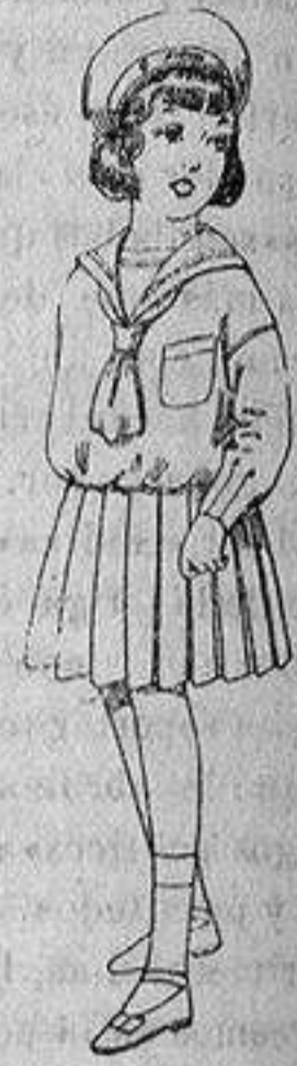
Trajes marinera, de lanilla azul, para niñas de 4 a 9 años. Ptas. 32 a 38