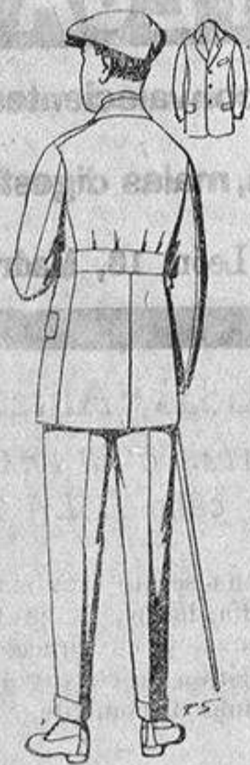
Traje modelo sport, de lanilla, meltón, etc., para jovencitos de 10 a 16 años. De ptas. 27 a 52 Los mismos en dril. De ptas. 11 a 21