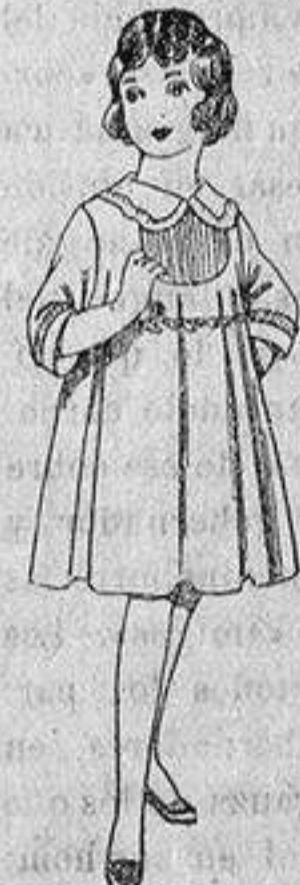
Vestido de lanilla azul, con borda dos, para niñas de 4 a 9 años. De ptas. 22 a 28.