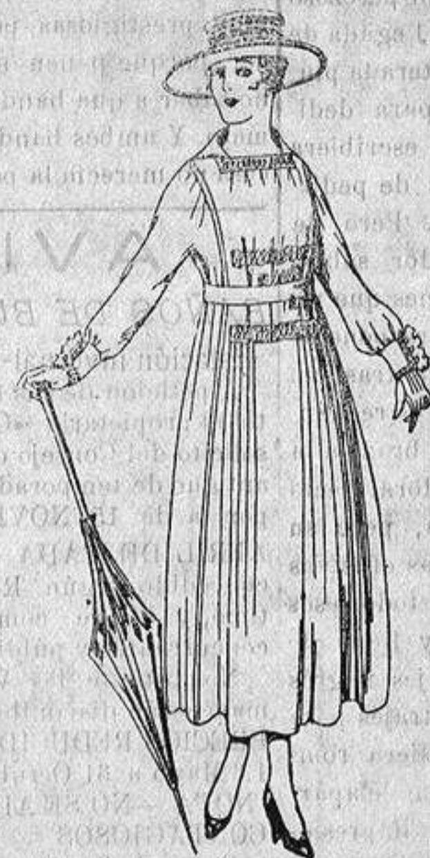
Vestido de lanilla, negro, azul y color. De ptas. 60 a 70