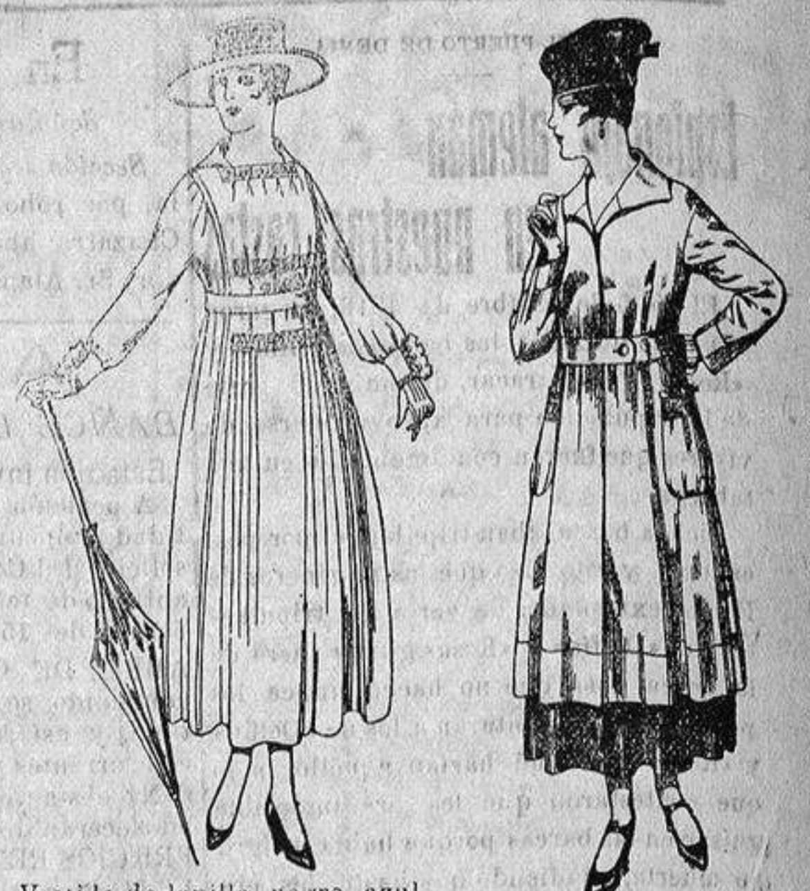
Vestido de lanilla, negro, azul y color. De ptas. 60 a 70 Abrigo de tricot de lana colores lisos. De ptas. 63 a 75

Madrid, Barcelona, Alicante, Almería, Bilbao, Cádiz, Cartagena, Gijón, Granada, Málaga, Palma de Mallorca, Santander, Sevilla, Valencia, Valladolid y Zaragoza.