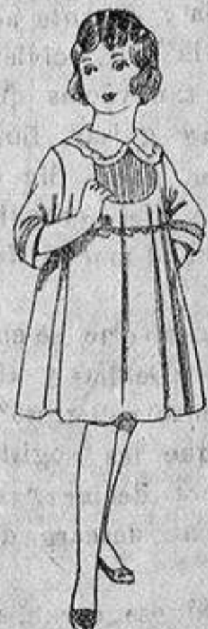
Vestido de lanilla azul, con bordos, para niñas de 4 a 9 años. De ptas. 22 a 28.