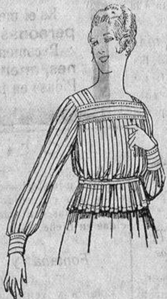
Blusa de batista listada. a ptas. 4'50.

Ropas confeccionadas para Caballero Señora, Niño y Niña