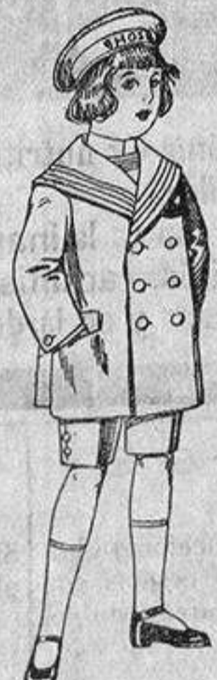
Traje matelot de vicuña o jerga azul para niños de 4 a 9 años. De ptas. 14 a 32