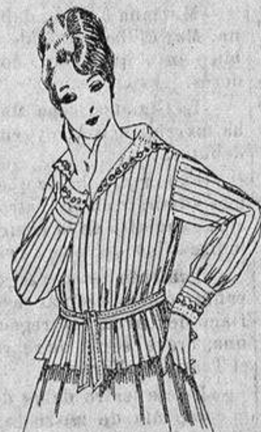
Blusa voile listada, cuello organdín bordado. a ptas. 9'50

Camisería, Géneros de Punto, Gorbatería, Guantería, Sombrerería, Zapatería, Bastones, Paraguas y Artículos de Viaje