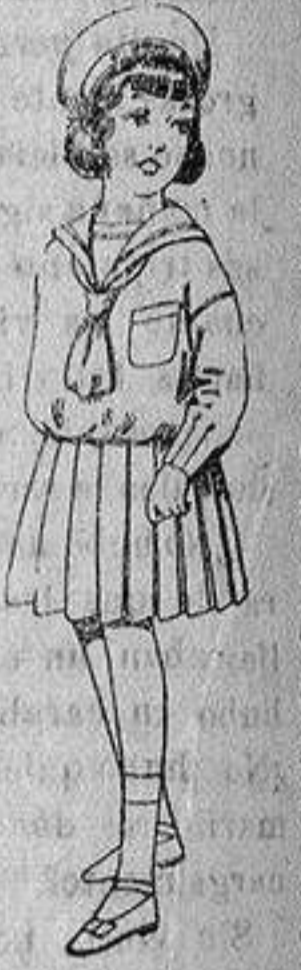
Trajes marinera, de lanilla azul, para niñas de 4 a 9 años. Ptas. 32 a 38