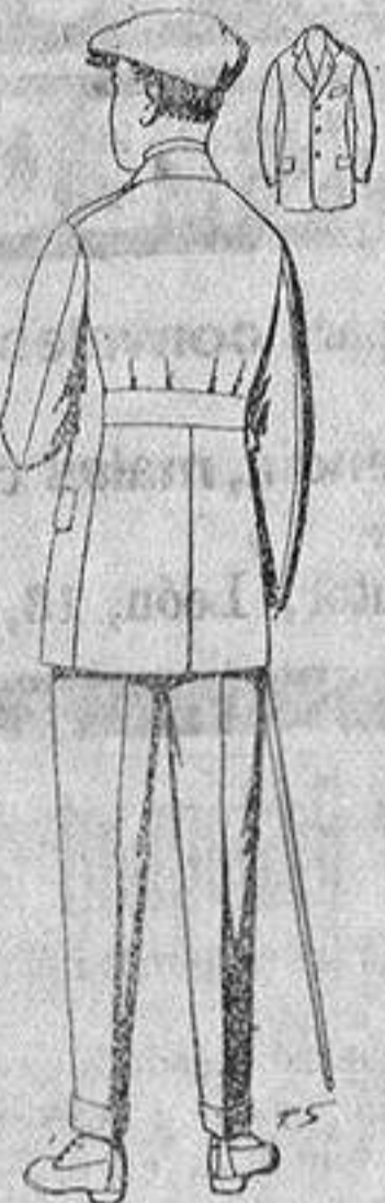
Traje modelo sport, de lanilla, melton, etc., para jovencitos de 10 a 16 años. De ptas. 27 a 52 Los mismos en dril. De ptas. 11 a 21