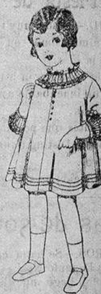
Vestido de voile blanco bordado. De ptas. 6'75 a 8