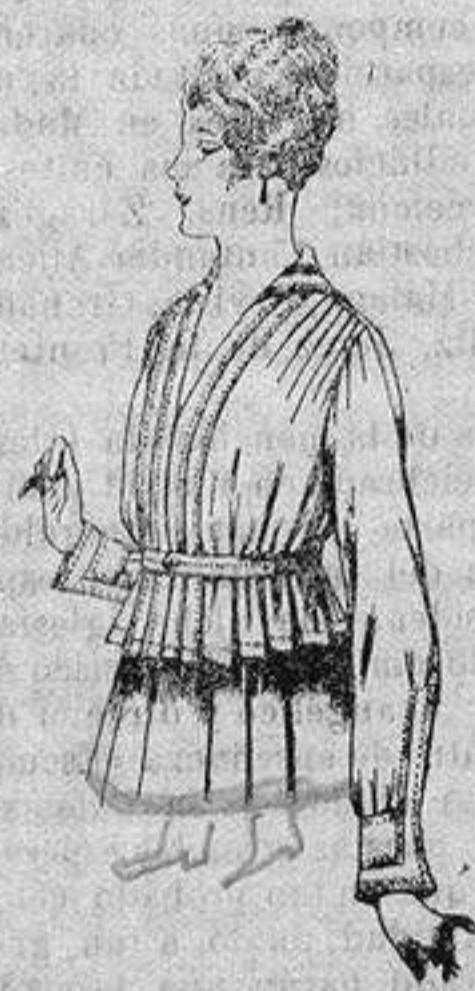
Blusa batista blanca A ptas. 5'75

Camisería, Géneros de Punto, Corbatería, Guantería, Sombrerería, Zapatería, Bastones, Paraguas y Artículos de Viaje