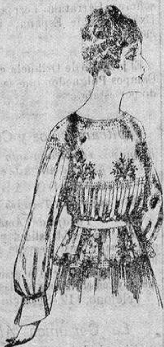
Blusa de crespón o seda, en negro, azul y color. de ptas. 33 a 35

Ropas confeccionadas para Caballero, Señora, Niño y Niña