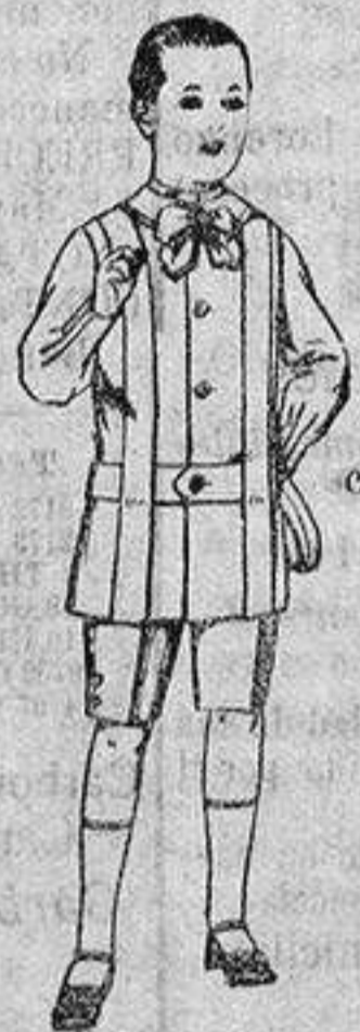
Traje de lanilla, para niños de 4 a 9 años. de ptas. 12 a 31