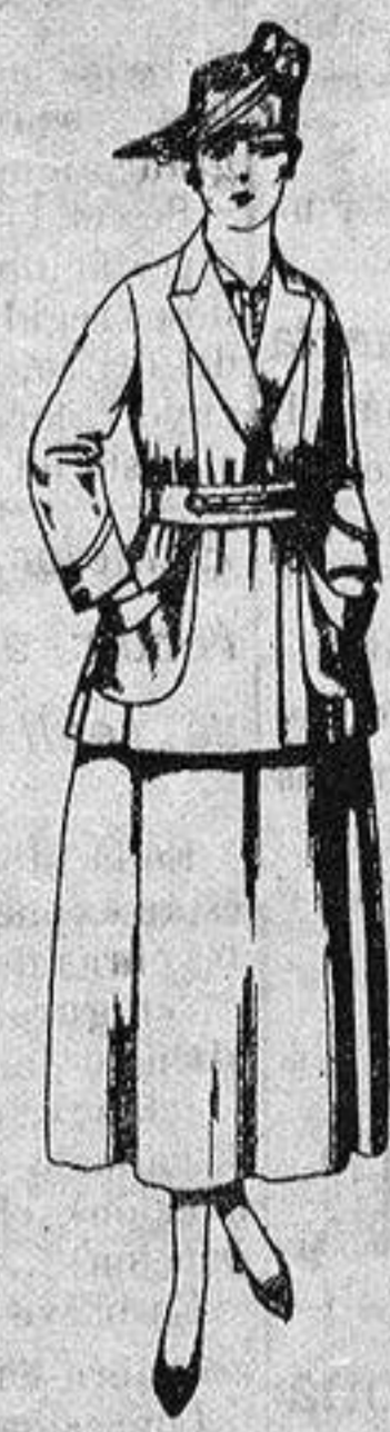
Traje de estambre negro, azul y color. de ptas. 70 a 75