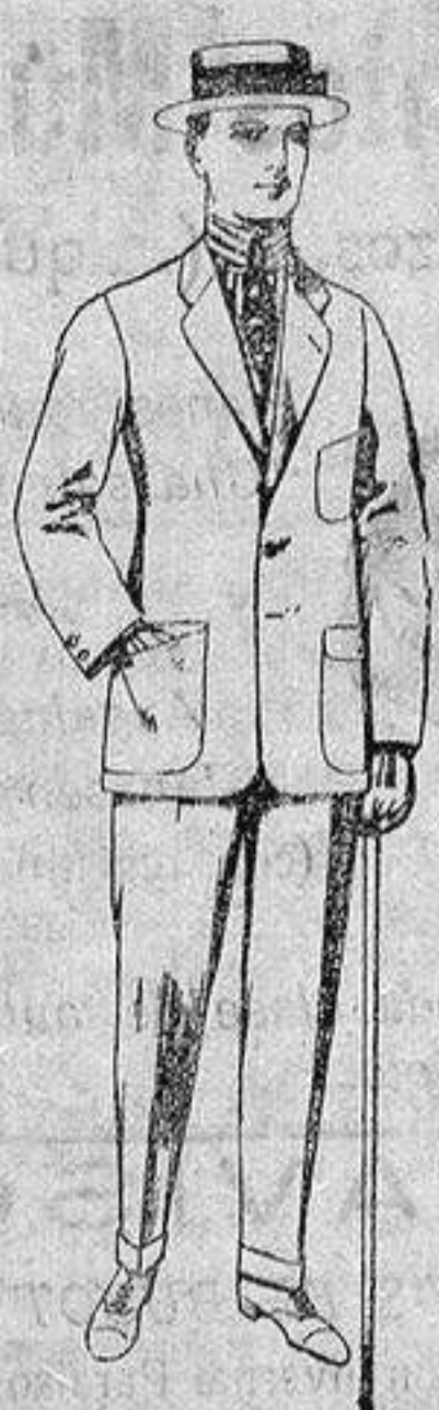
Traje de dril crudo, kaki o listado. De ptas. 10 a 38

Madrid, Barcelona, Alicante, Almería, Bilbao, Cádiz, Cartagena, Gijón, Granada, Málaga, Palma de Mallorca, Santander, Sevilla, Valencia, Valladolid y Zaragoza.