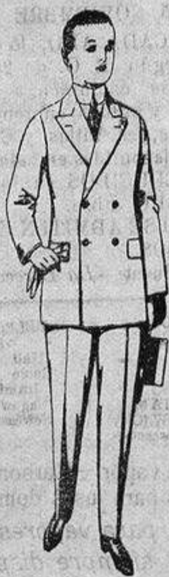
Traje de estambre, vicuña o jerga para jovencitos de 10 a 16 años. de ptas. 19 a 50