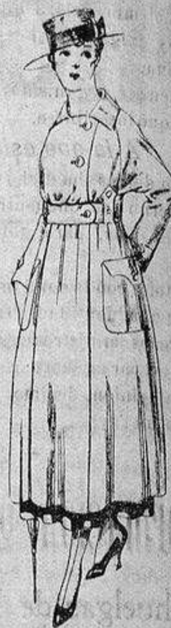
Guardapolvo de dril beige manga Ragland. a ptas. 23