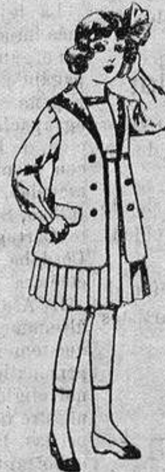
Traje de gabardina blanco, cuello de organdín bordado, para niñas de 4 a 9 años. De ptas. 22 a 24