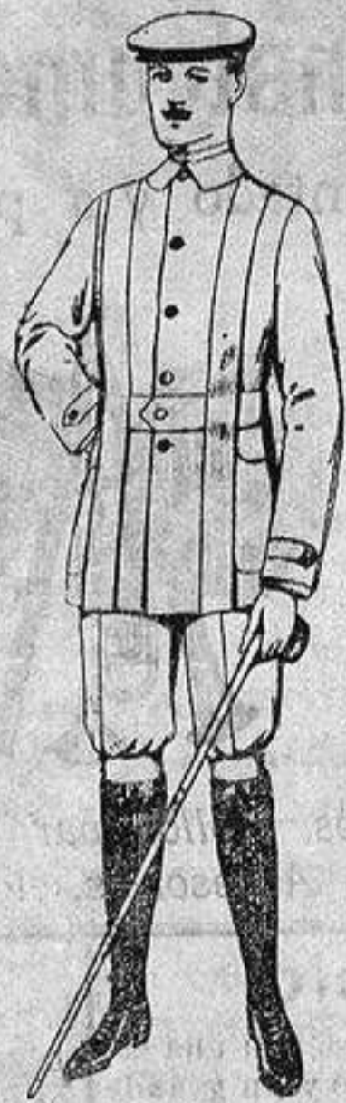
Cazadoras de dril crudo o kaki. De ptas. 12 a 20. Pantalones cortos para sportman, de dril beige. De ptas. 8 a 12