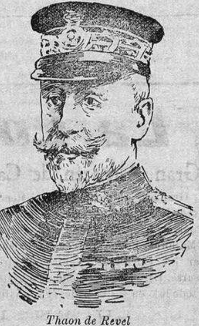
Thon de Revel