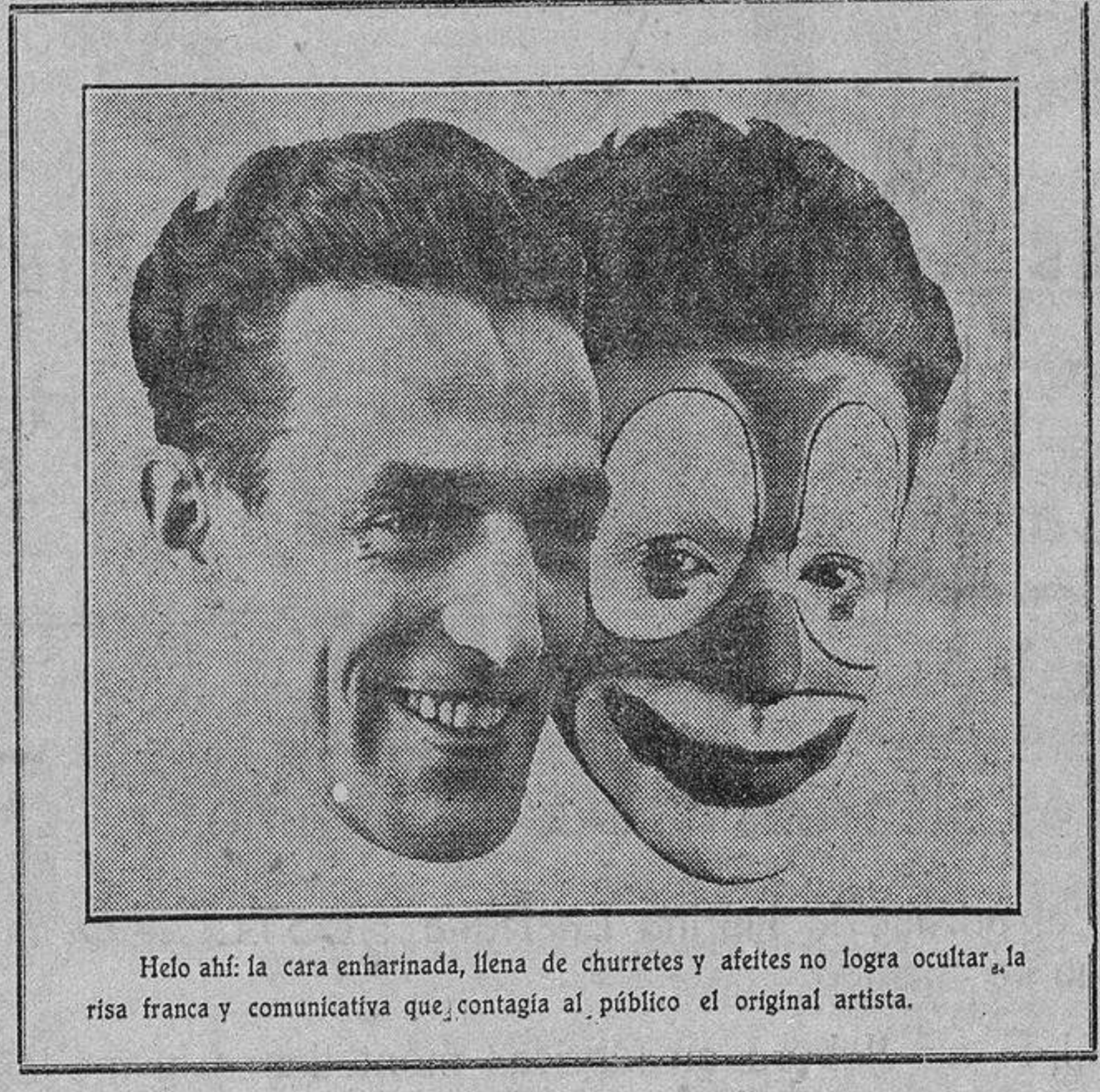
Helo ahí: la cara enharinada, llena de churretes y afeites no logra ocultar, a la risa franca y comunicativa que contagia al público el original artista.