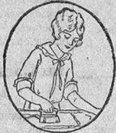
Después de teñir el vestido, déjese secar y planchese.

Deja como nuevos los vestidos usados y en los colores de moda