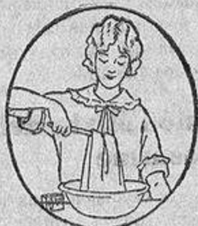
El método RIT es el más sencillo. Siga con cuidado las instrucciones.

Dirección: (Telegráfica: Administrador.—Busot.