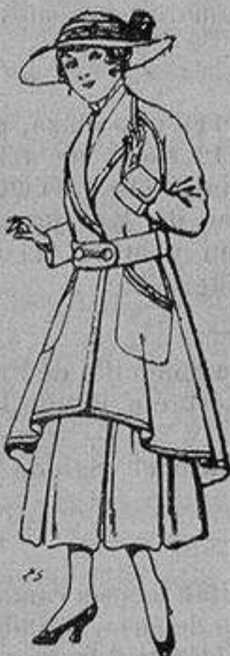
Abrigos de patén para jovencitas de 13 a 16 años De ptas. 25 a 35