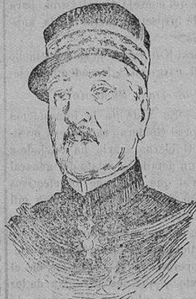
El general CASTELNAU que ha sido nombrado segundo del general Joffre o jefe del Estado Mayor de éste