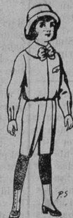
Trajes de patén para niños de 4 a 9 años De ptas. 5 a 7'50