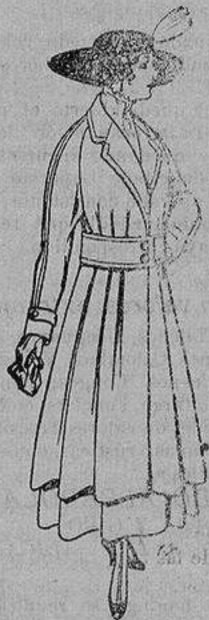
Abrigos de patén gran novedad para señora A ptas. 53