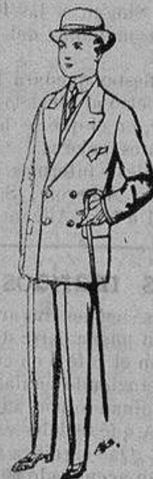
Trajes de patén, vicuña, etc., para niños de 10 a 16 años De ptas. 25 a 48