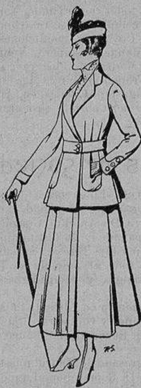
Trajes de lana negra azul y color, para señora De ptas. 50 a 55