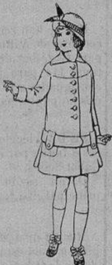
Abrigos de patén para niños de 4 a 12 años De ptas. 15 a 25