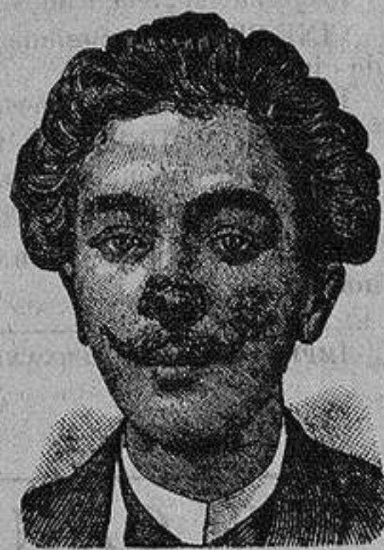
Antes de la curacion