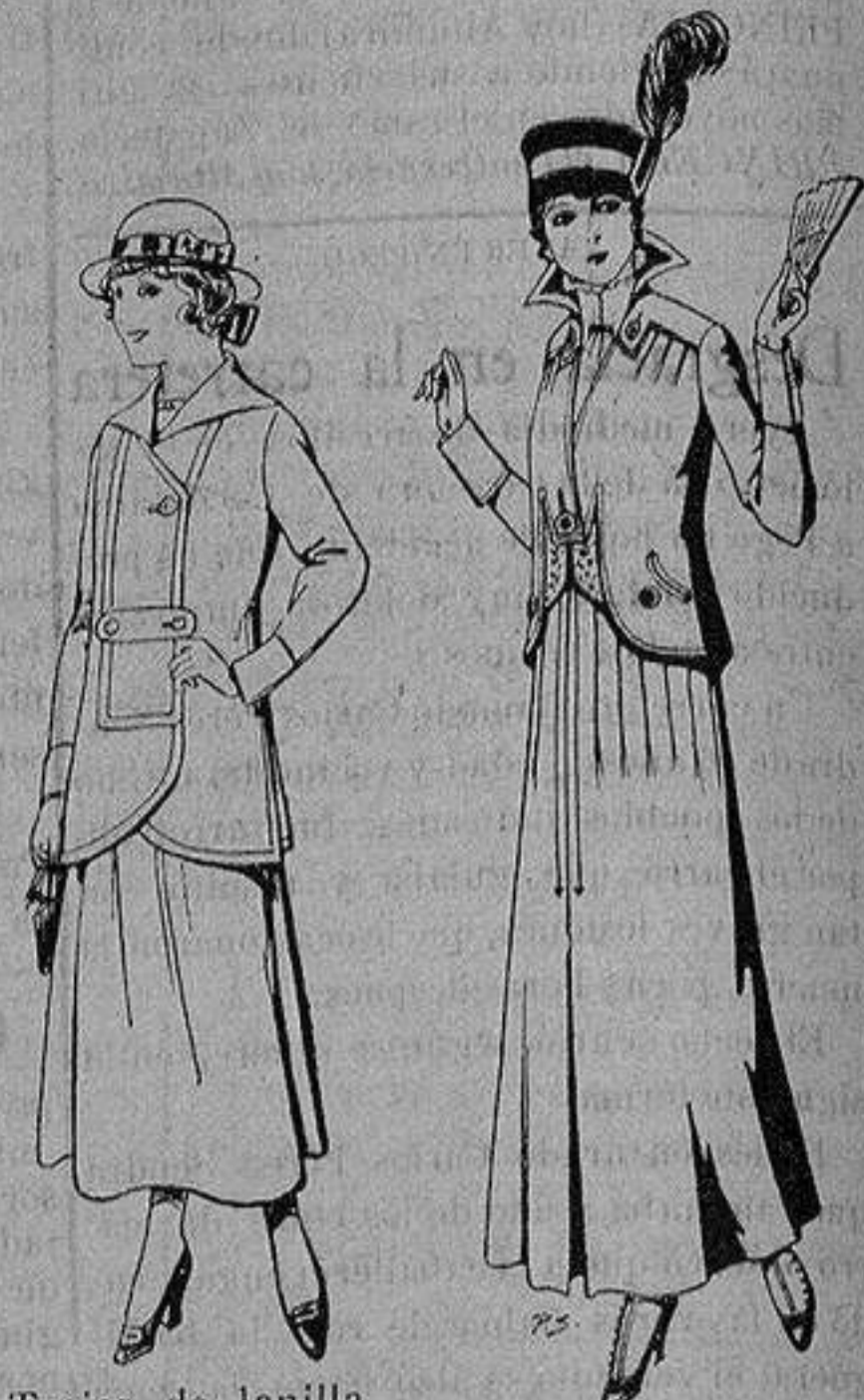
Trajes de lanilla, para jovencitas de de 13 a 15 años De ptas. 27 a 30 Trajes de lana negra, azul, para señora A 55 ptas.

Ropas confeccionadas para Caballero, Señora, Niño y Niña