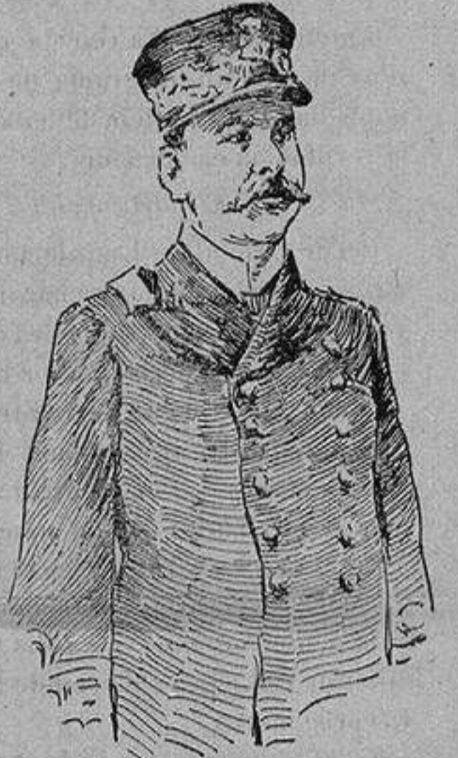
Almirante LEONARDI CATTOLICA exministro de Marina de Italia