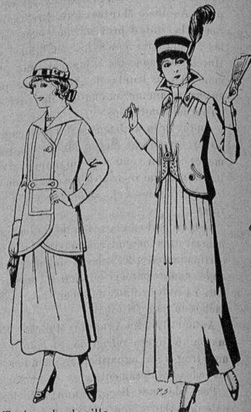
Trajes de lanilla, para jovencitas de De 13 a 15 años De ptas. 27 a 30 Trajes de lana negra, azul, para señora A 55 ptas.