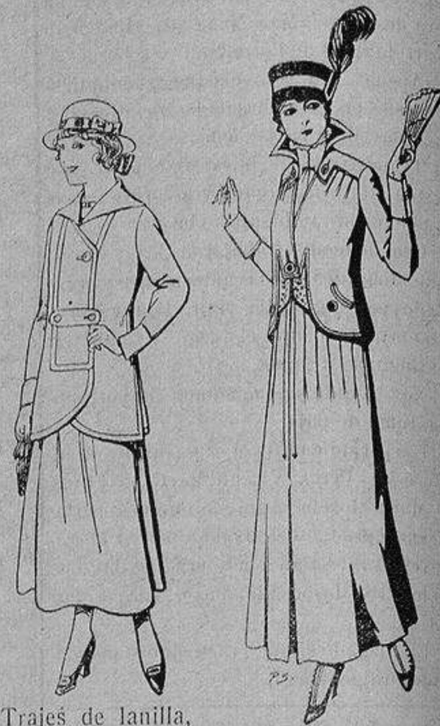
Trajes de lanilla, para jovencitas de de 13 a 15 años De ptas. 27 a 30 Trajes de lana negra, azul, para señora A 55 ptas.

Ropas confeccionadas para Caballero, Señora, Niño y Niña