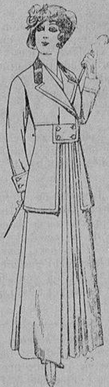
Trajes de lana ne- gra azul y color pa- ra señora A ptas. 70

Madrid * Barcelona * Almería * Bilbao * Cádiz Cartagena * Gijón * Granada * Málaga * Pal- ma de Mallorca * Santander * Sevilla * Valencia Valladolid y Zaragoza