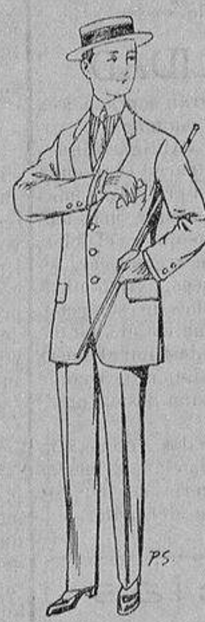
Trajes de lanilla, vi- cuña, etc., para niños de 10 a 16 años De ptas. 14 á 48