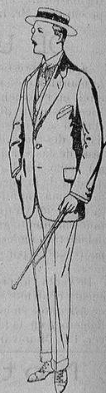
Trajes de alpaca negra De ptas. 32 a 56