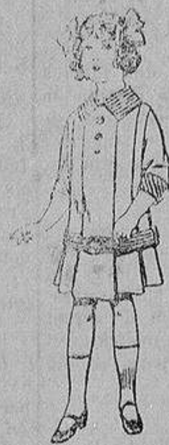
Vestidos de dril para niñas de 4 a 12 años De ptas. 5 a 12