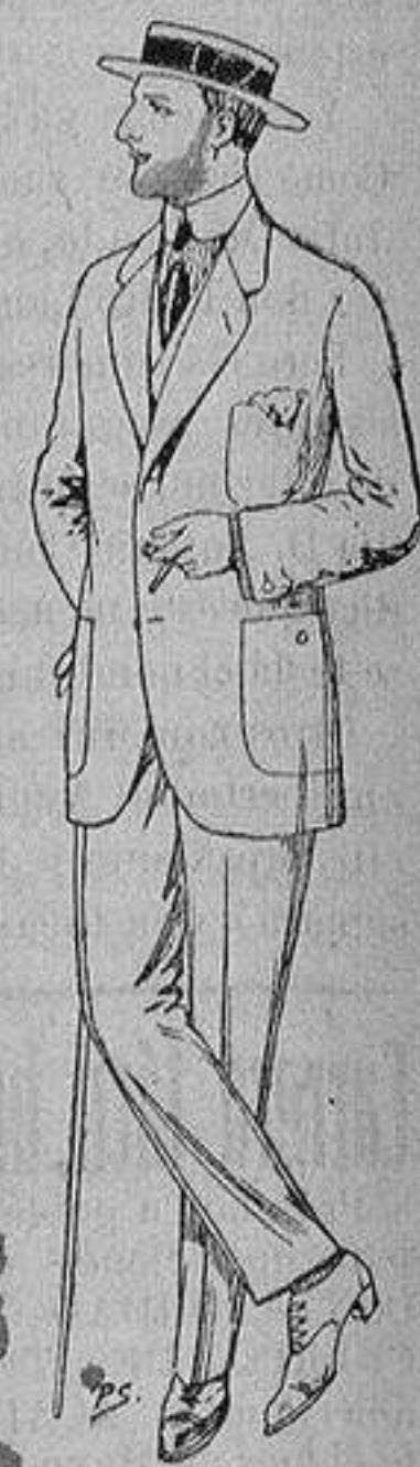
Trajes de dril cru- do, kaki o listado De ptas. 10 a 32