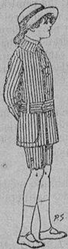
Trajes de dril listado para niños de 4 a 9 años De ptas. 4 a 13