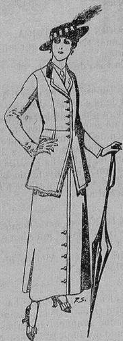
Trajes lana negra, azul y color A ptas. 55

Madrid * Barcelona * Almería * Bilbao * Cádiz Cartagena * Gijón * Granada * Málaga * Pal- ma de Mallorca * Santander * Sevilla * Valencia Valladolid y Zaragoza