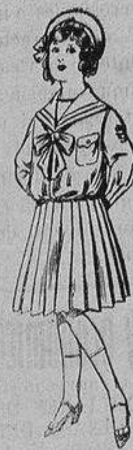
Trajes de lani- nilla, para ni- ños de 4 a 12 años De ptas 28 á 38