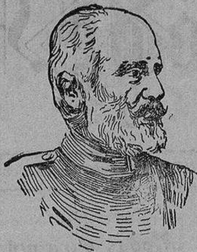
General alemán VON HEERINGEN que manda uno de los cuerpos de ejército de Alsacia