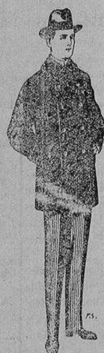
Pellizas con cuello y bocamangas de astrakan De 11 a 40 ptas