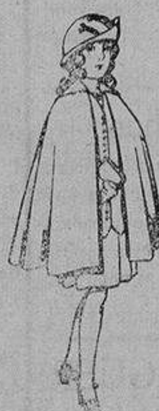
Capas de lana para niñas de 4 a 12 años De 20 a 22 ptas.