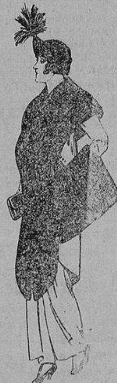
Juego de pieles de loutre de Nord para Señora 145 ptas.

SECCIONES: Peletería, Camisería, Géneros de Punto, Corbatería, Guantería, Sombrerería, Zapatería, Paraguas, Bastones y Artículos de Viaje.