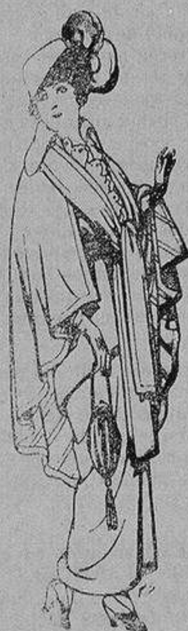
Capas de lana para señora A 20 ptas.