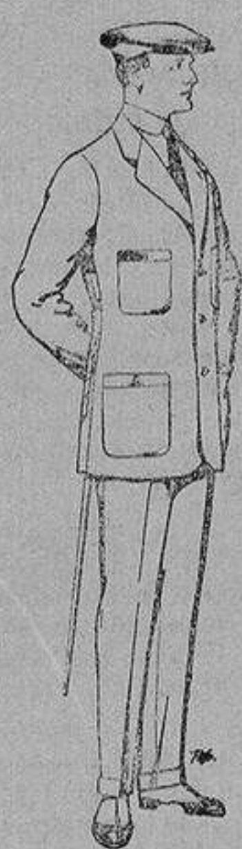
Trajes de cheviot, corte elegante para "Sportmen" De 45 a 55 ptas.

Madrid, Barcelona, Alicante, Almería, Bilbao, Cádiz, Cartagena, Gijón, Granada, Málaga, Palma de Mallorca, Santander, Sevilla, Valencia, Valladolid y Zaragoza