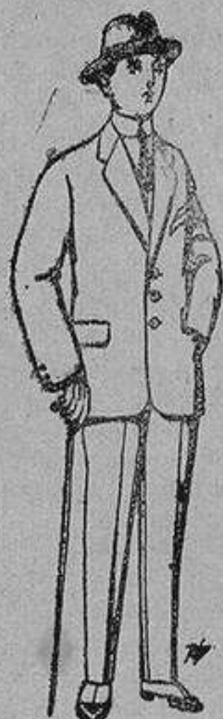
Trajes de pater, vicuña, etc., para niños de 10 a 16 años De 13 a 48 ptas.