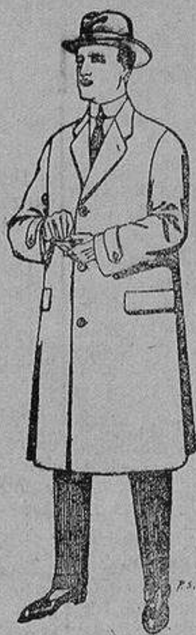
Gabanes de tejidos pluma satina, etc. De 17'50 a 70 ptas.