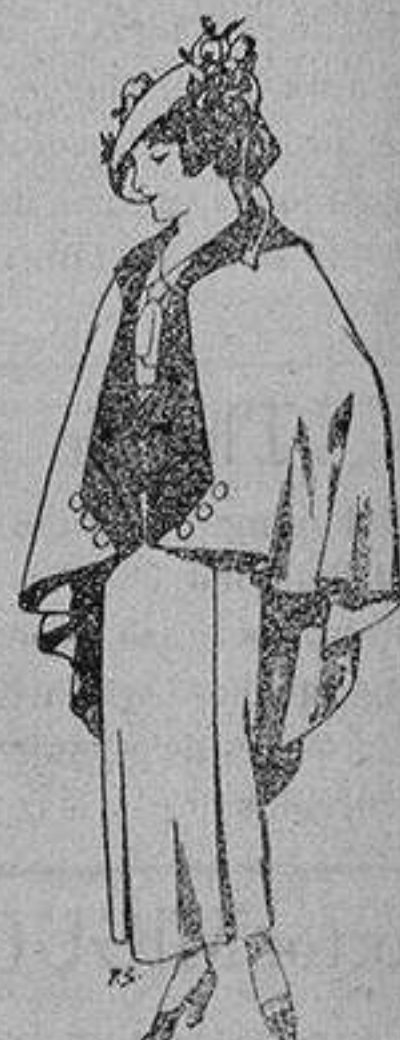
Capas de lana para jovencitas de 13 a 16 años A 25 pesetas