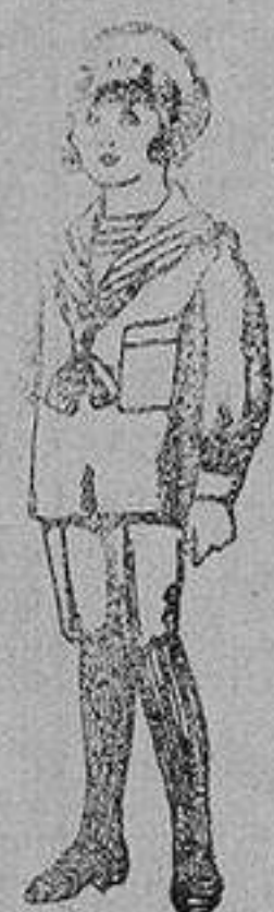
Trajes de jerga azul bordado oro en la manga para niños de 4 a 9 años De 20 a 22 ptas.

Ropas confeccionadas para Caballero, Señora, Niño y Niña