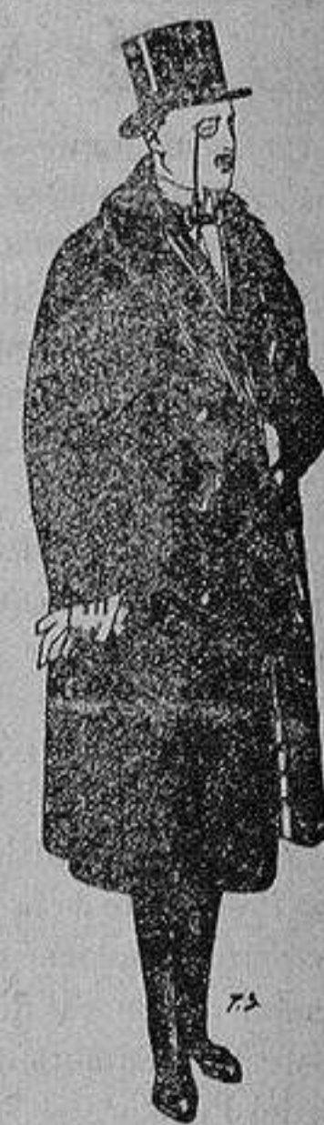
Gabanes de edredón negro, forro seda, cuello y vistas de piel a 125 ptas.