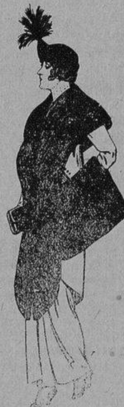
Juego de pieles de loutre de Nord para Señora 145 ptas.

Ropas confeccionadas para Caballero, Señora, Niño y Niña