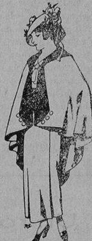
Capas de lana para jovencitas de 13 a 16 años A 25 pesetas