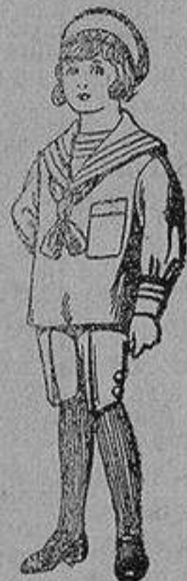
Trajes de jerga azul bordado oro en la man- ga para niños de 4 a 9 años De 20 a 22 ptas.

SECCIONES: Peletería, Camisería, Gé- neros de Punto, Corbatería, Guante- ría, Sombrerería, Zapatería, Paraguas, Bastones y Artículos de Viaje.