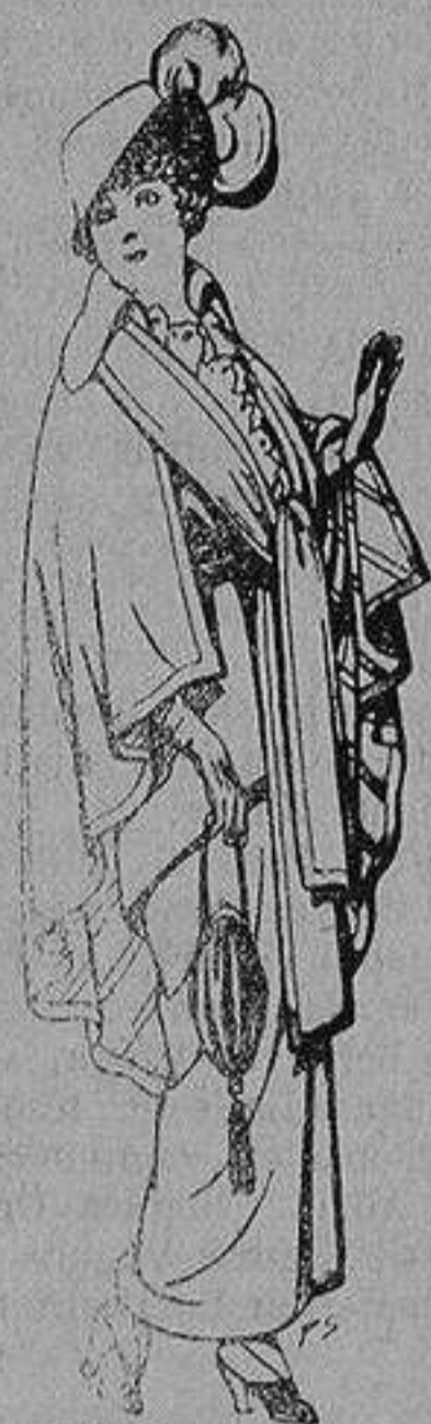
Capas de lana para señora A 20 ptas.

Ropas confeccionadas para Caballero, Señora, Niño y Niña