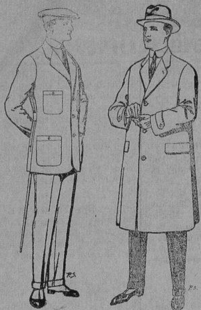
Trajes de cheviot, corte elegante para "Sportmen" De 45 a 55 ptas.

Madrid, Barcelona, Alicante, Almería, Bilbao, Gá- diz, Cartagena, Gijón, Granada, Málaga, Palma de Mallorca, Santander, Sevilla, Valencia, Valladolid y Zaragoza