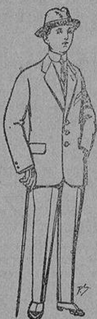
Trajes de paten, vicuña, etc., para niños de 10 a 16 años De 13 a 48 ptas.