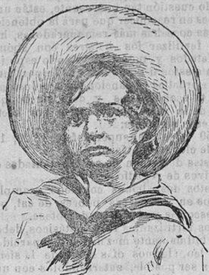
El príncipe Alejo heredero del trono de Rusia que se halla gravemente herido a consecuencia de un atentado nihilista perpetrado contra él en el yate imperial