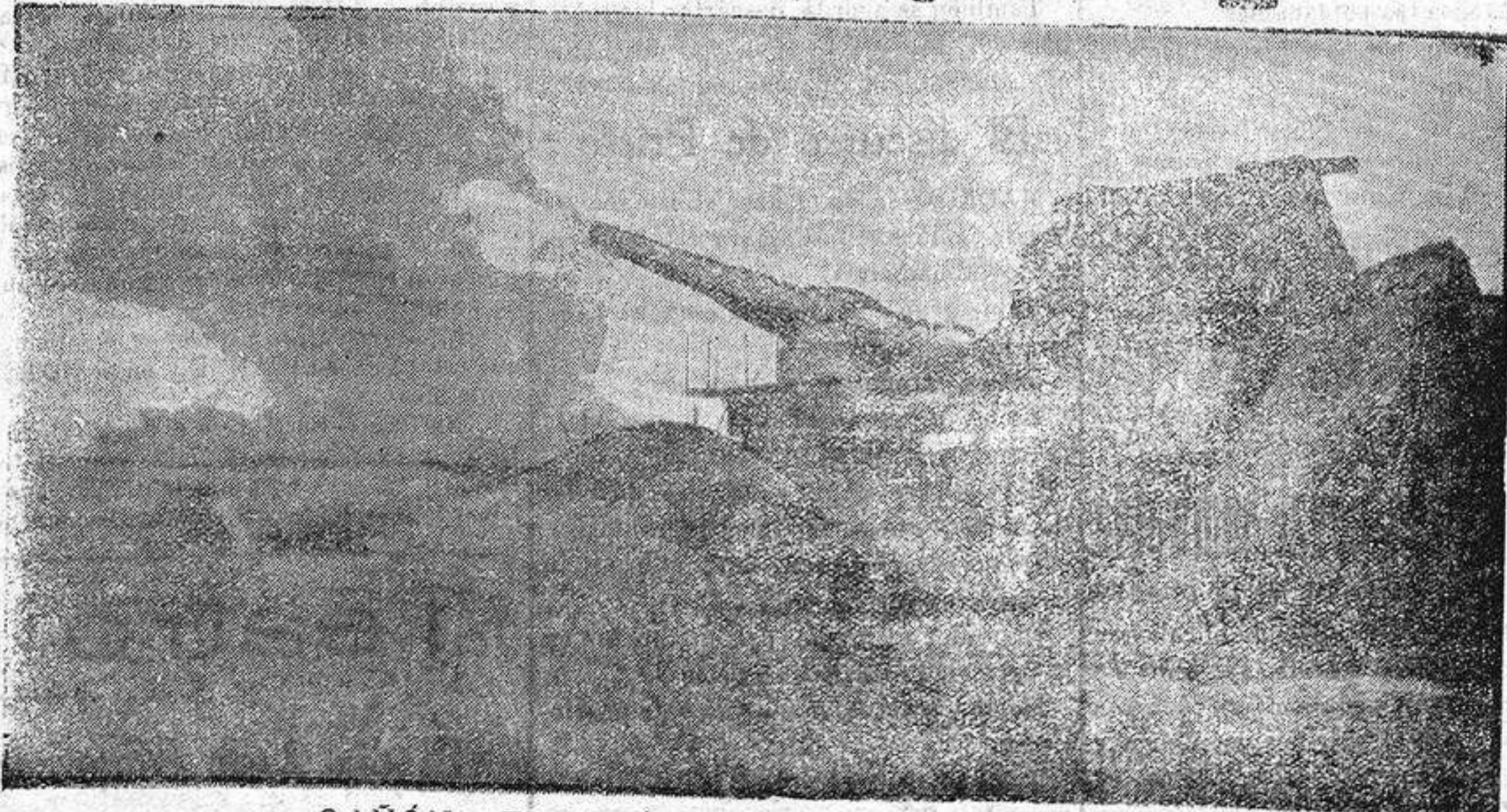
CAÑÓN FRANCÉS DE GRAN GALIBRE DISPARANDO