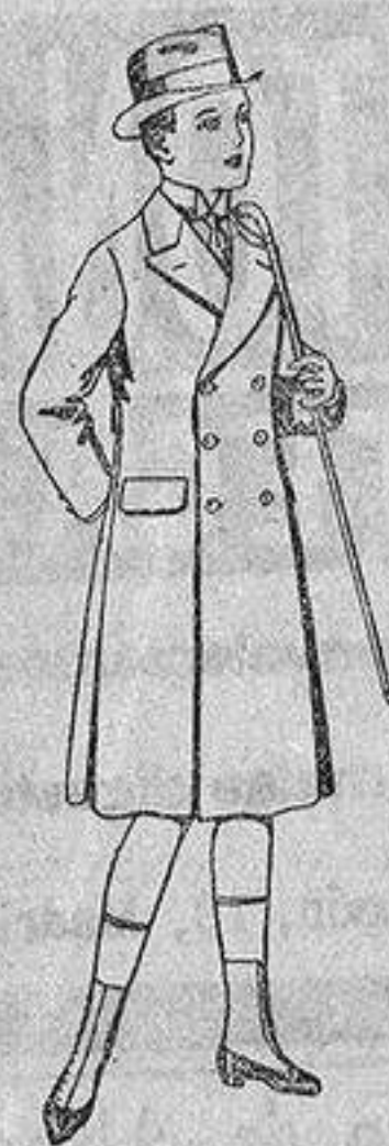
Gabanes de patén para niños de 4 a 9 años, de ptas. 16 a 50.