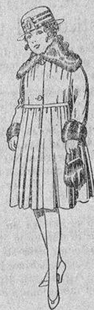
Abrigos de terciopelo de lana, pañete, gamuza, etc., cuello y bocamangas piel, para niñas de 4 a 9 años, de ptas. 28 a 48