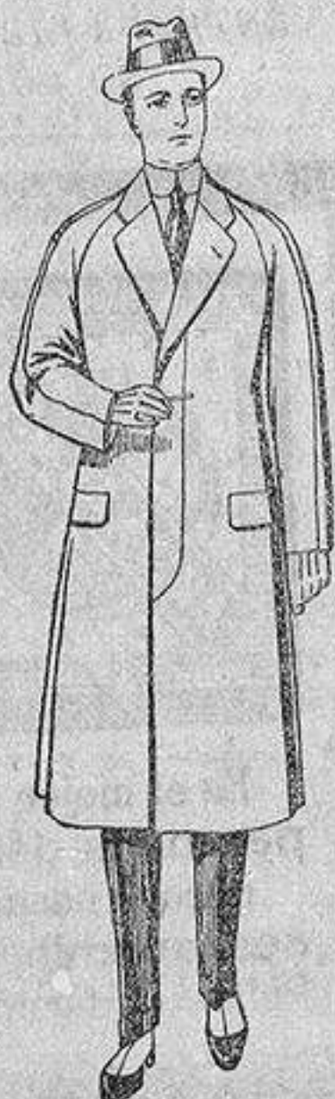
Gabanes de patén, melton o cheviot, con forro de seda, satén o escocés, de ptas. 50 a 100