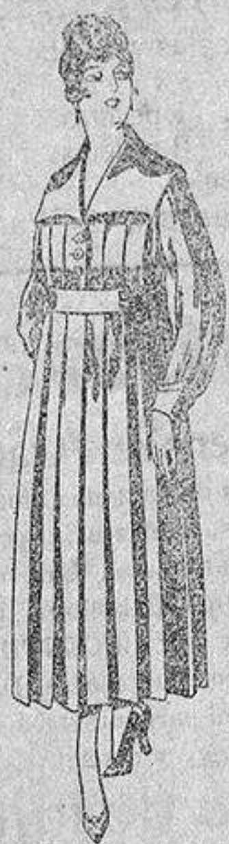
Batas de lanilla diferentes colores, a pesetas, 25.

Madrid, Barcelona, Alicante, Almería, Bilbao, Cádiz, Cartagena, Gijón, Granada, Málaga, Palma de Mallorca, Santander, Sevilla, Valencia, Valladolid y Zaragoza.