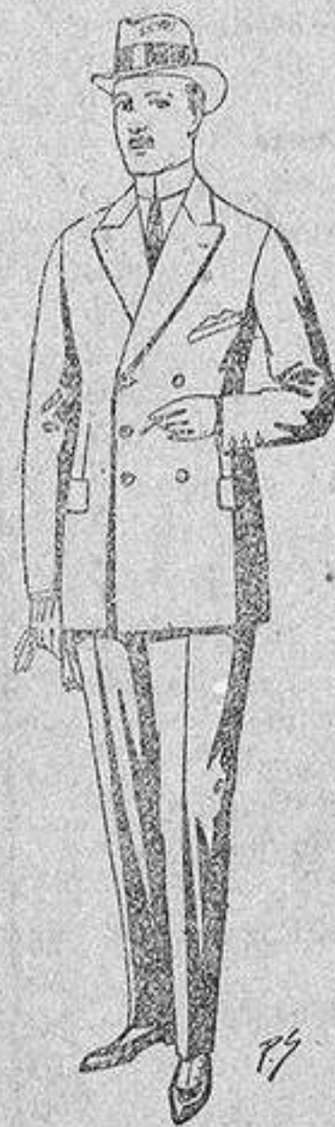
Trajes de cheviot, melton etc., de ptas. 26 a 85. Los mismos en vicuña o jerga, de ptas. 32 a 90.

Gamisería - Géneros de punto Corbatería - Guantería Sombrerería - Zapatería Paraguas - Bastones y artículos de viaje