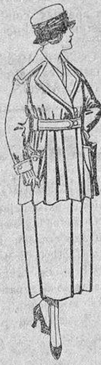
Paletots felpa de seda, diferentes colores, de ptas. 60 a 65.