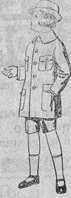
Trajes de patén modelo «Sports», para niños de 4 a 9 años.