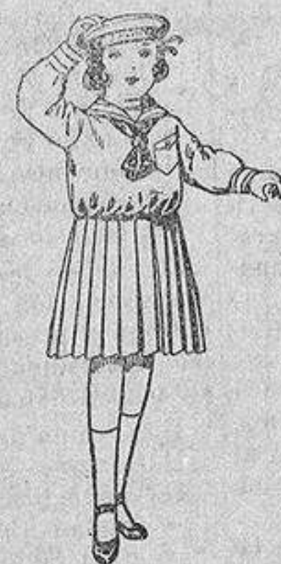
Trajes de marinera de sarga inglesa azul, para niñas de 4 a 9 años, de ptas. 30 a 38.