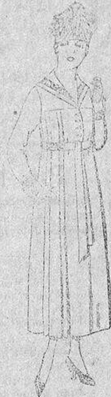
Vestidos de sarga inglesa, en negro, azul y color, bordados, de de ptas. 60 a 70