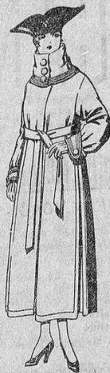
Abrigos de pañete, colores azul, beige y café, de ptas. 65 a 85