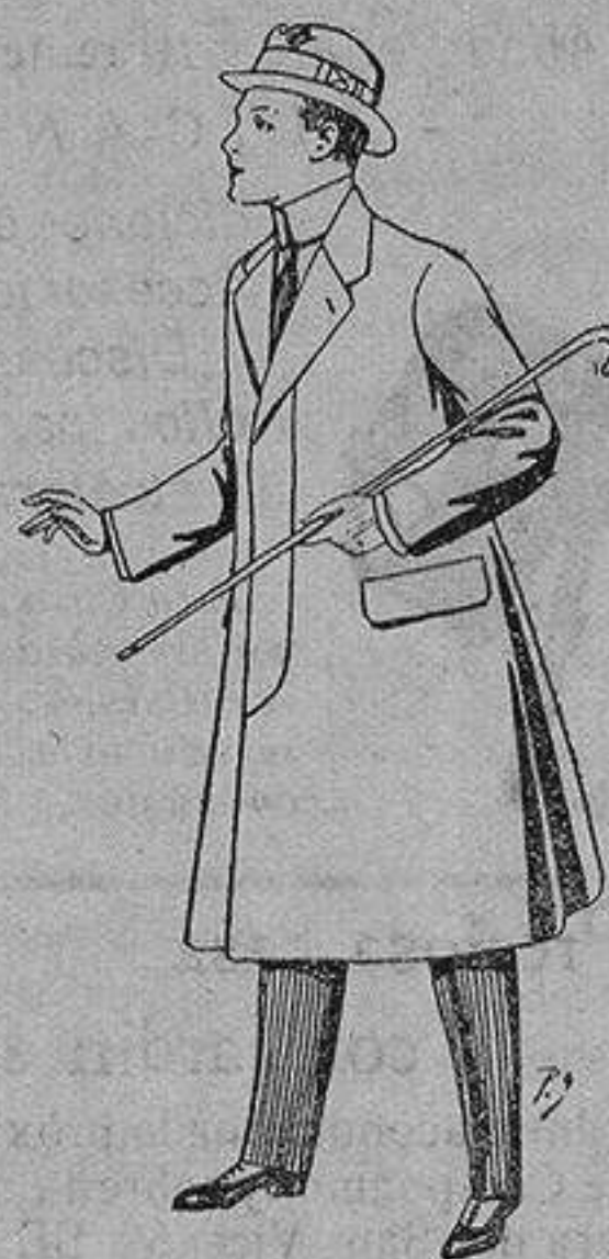
Gabanes de lana, vigonia o melton, con forros satén o seda, para niños de diez a doce años De ptas. 20 a 53

Ropas confeccionadas para Caballero, Señora, Niño y Niña