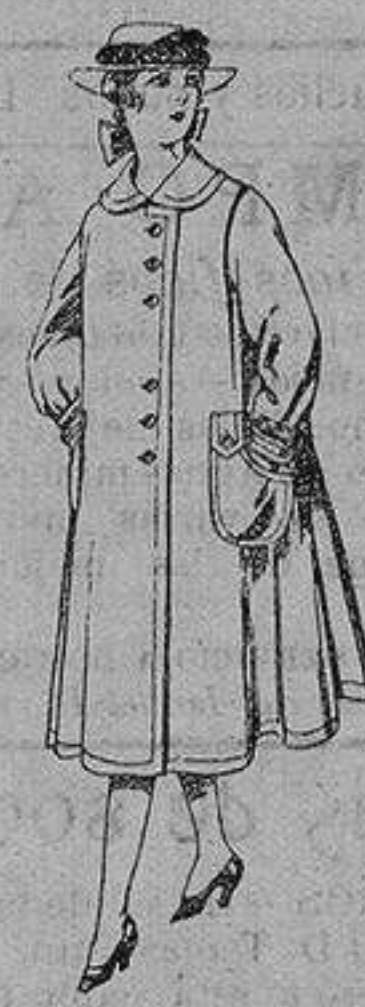
Abrigos de lana para jovencitas de 11 a 15 años De ptas. 35 a 40

SECCIONES: Peletería, Camisería, Géneros de Punto, Corbatería, Guantería, Sombrerería, Zapatería, Paraguas, Bastones y Artículos de Viaje.