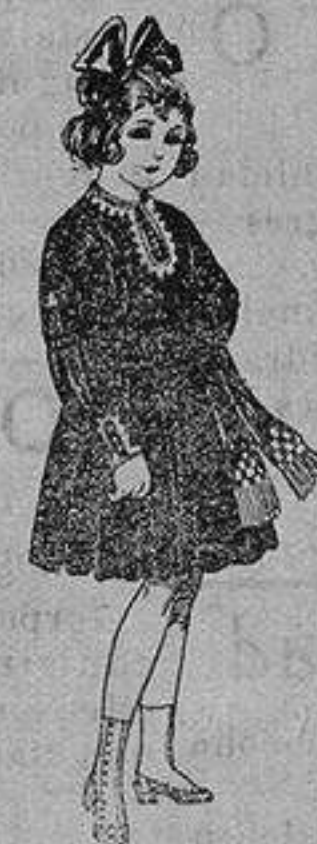
Vestidos de laniña, para niñas de 4 a 9 años De ptas. 15 a 34