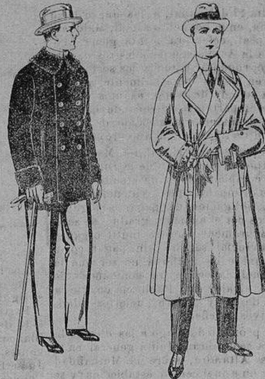
Pellizas de ratina con cuello del mismo género y con astrakan De ptas. 16 a 90 Gabanes impermeabilizados, con cinturón color beige De ptas. 43 a 110