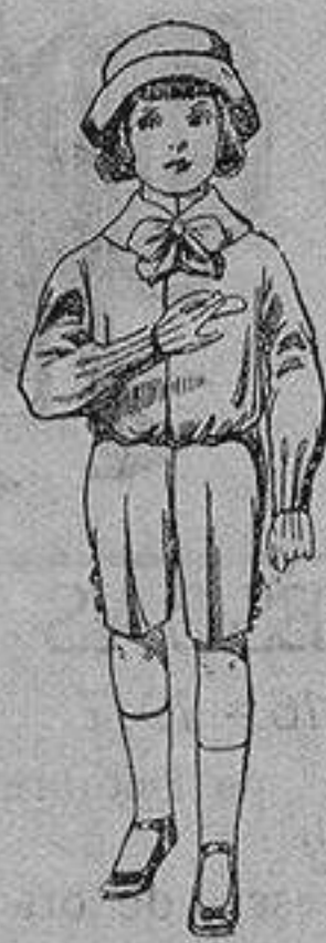
Trajes de patén para niños de 4 a 9 años. De ptas. 9 a 14