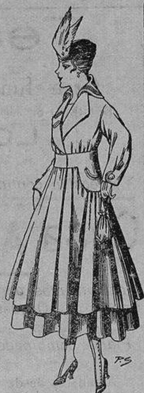
Abrigo de patén en color, para señora. De ptas. 80 a 100

Sucursales: Madrid, Barcelona, Alicante, Almería, Bilbao, Gádiz, Cartagena, Gijón, Granada, Málaga, Palma de Mallorca, Santander, Sevilla, Valencia, Valladolid y Zaragoza.