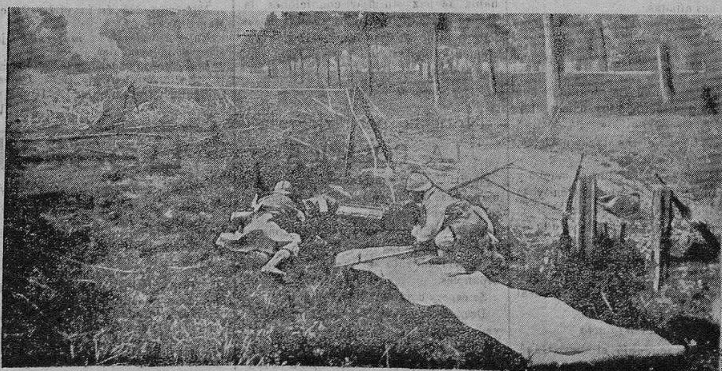
LOS SASTRES DEL PAISAJE