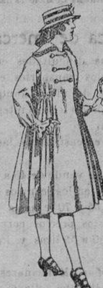
Abrigos de patén para jovencitas de 11 a 15 años. De ptas. 35 a 50