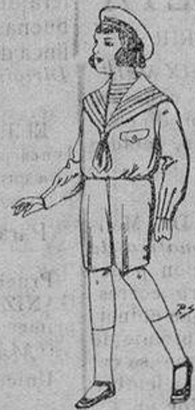
Trajes de patén para niños de 4 a 9 años. De ptas. 9 a 22

SECCIONES: Peletería, Camisería, Géneros de Punto, Corbatería, Guantería, Sombrerería, Zapatería, Paraguas, Bastones y Artículos de Viaje.