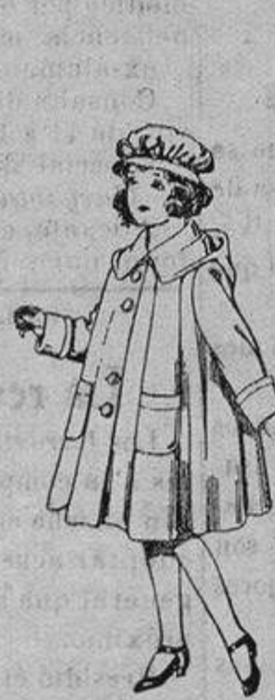
Abrigos de gabarrina impermeabilizada para niñas de 4 a 12 años. De ptas. 40 a

Precio Fijo - Ventas al contado Pídase el Catálogo General