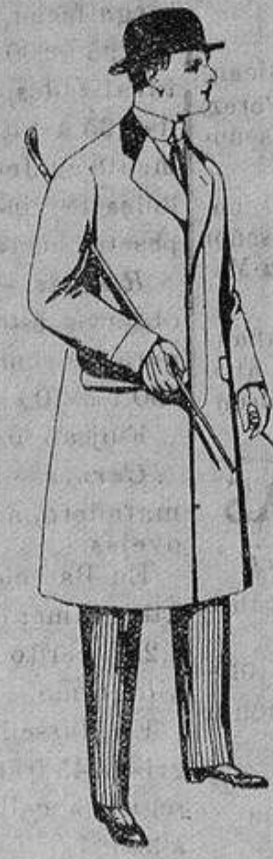
Gabanes de patén, miltón y cheviot, con forros seda, saén o escocés. De ptas. 33 a 110