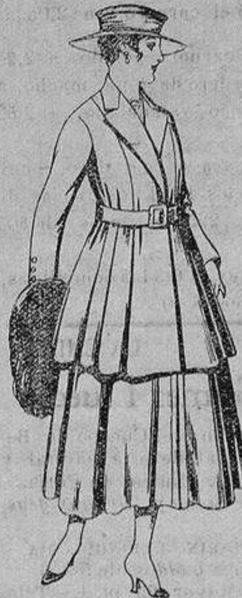
Traje de lana, para señora, en color negro y azul. De ptas. 85 a 100