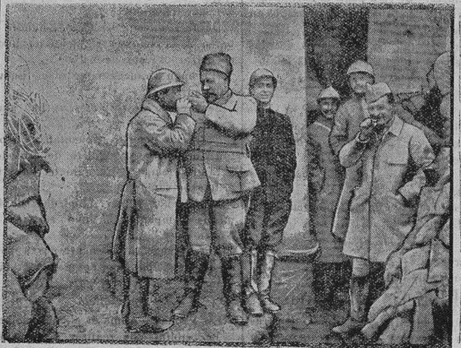
El general Farret dando lumbre a un soldado.