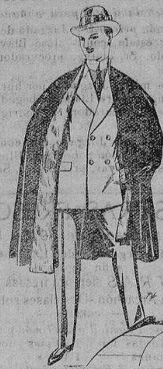
Capas (enteras) de paño de Béjar y Tarraza, embozos de peluche, terciopelo, astrakán o escocés. De ptas. 35 a 115