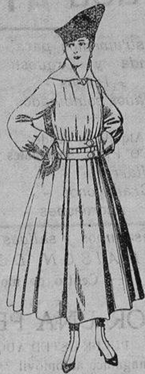
Abrigo de patén en color, para señora. De ptas. 50 a 60