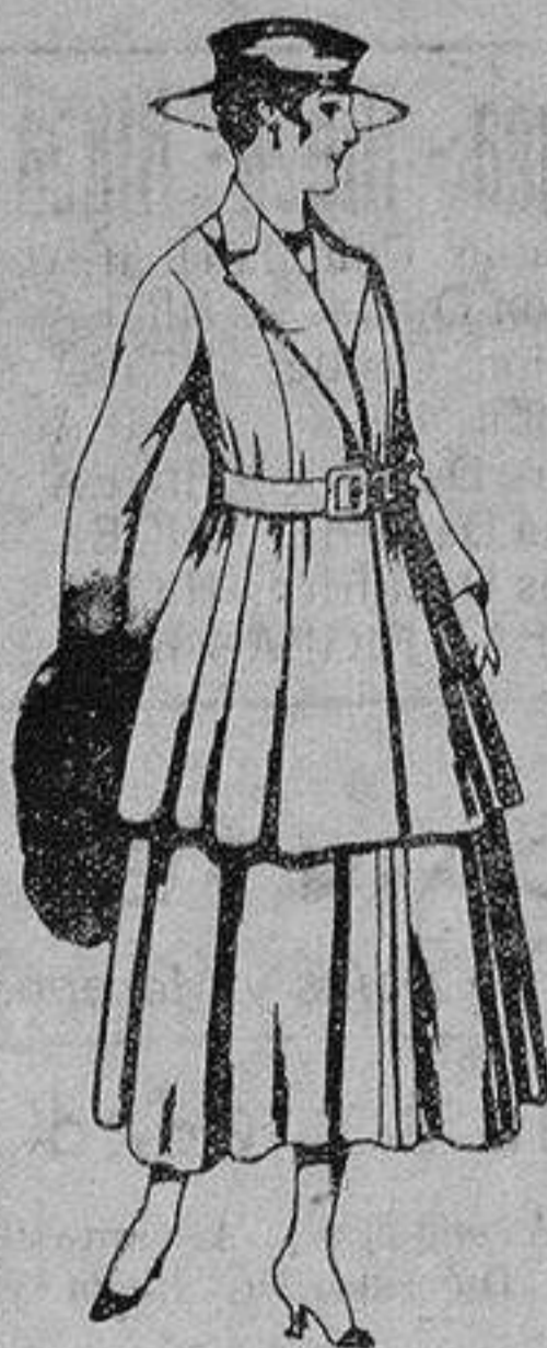
Traje de lana, para señora, en color negro y azul. De ptas. 85 a 100