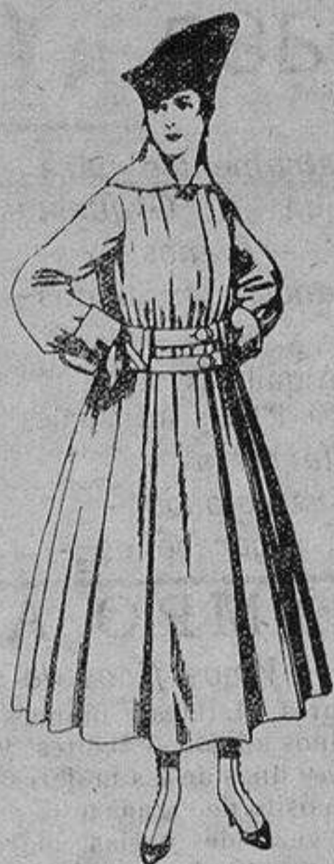
Abrigo de patén en color, para señora. De ptas. 50 a 60.