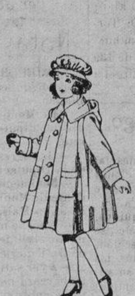
Abrigos de gabardina impermeabilizada para niñas de 4 a 12 años. De ptas. 40 a

Precio Fijo - Ventas al contado Pídase el Catálogo General