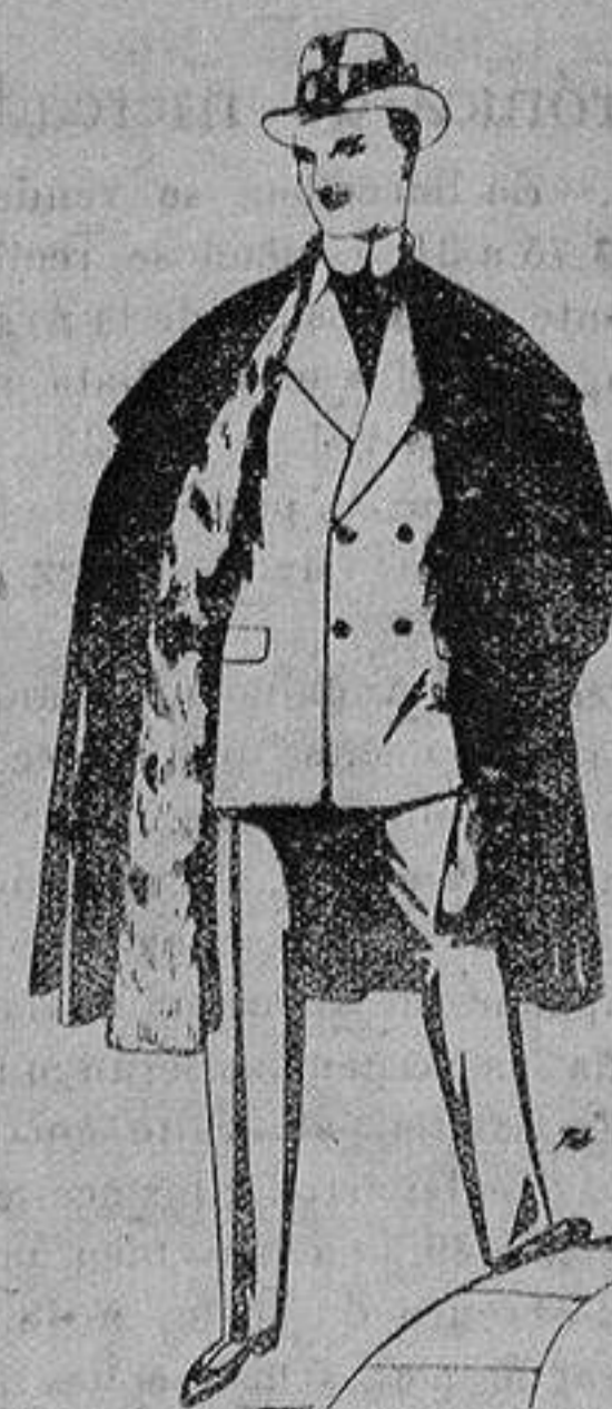
Capas (enteras) de paño de Béjar y Tarraza, embozos de peluche, terciopelo, astrakán o escocés. De ptas. 35 a 115