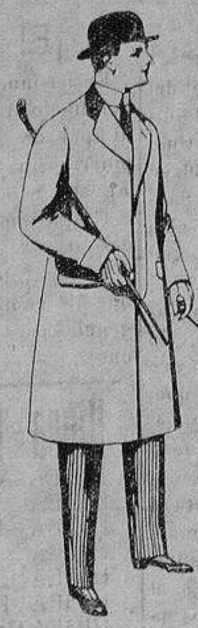
Gabanes de patén, meltón y cheviot, con forros seda, saén o escocés. De ptas. 33 a 110