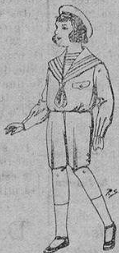
Trajes de patén para niños de 4 a 9 años. De ptas. 9 a 22

SECCIONES: Peletería, Camisería, Géneros de Punto, Corbatería, Guantería, Sombrerería, Zapatería, Paraguas, Bastones y Artículos de Viaje.