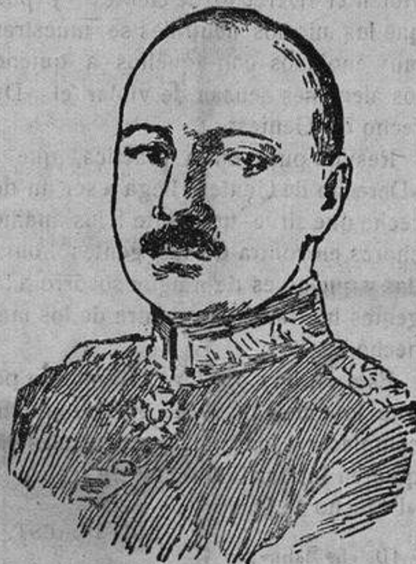
General KROFF VON DELLMENSINGEN, comandante de las tropas bávaras que pelean contra Rumania en los Alpes de Transilvania