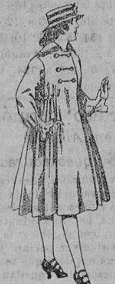
Abrigos de patén para jovencitas de 11 a 15 años. De ptas. 35 a 50