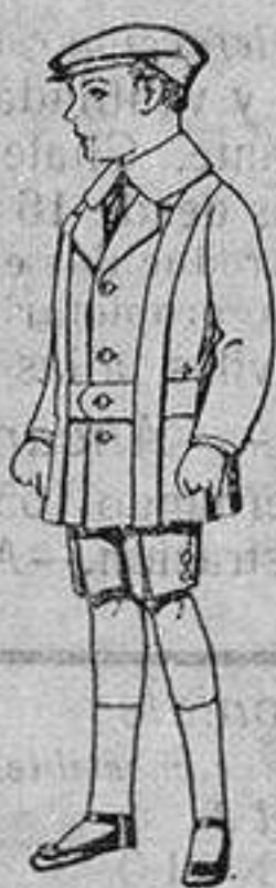
Trajes de patén para niños de 4 a 9 años. De ptas. 12 a 33

SECCIONES: Peletería, Camisería, Géneros de Punto, Corbatería, Guantería, Sombrerería, Zapatería, Paraguas, Bastones y Artículos de Viaje.