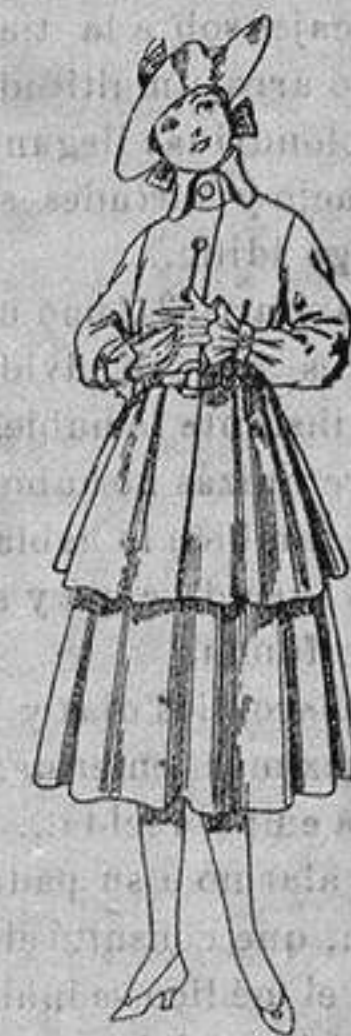
Trajes de lana, para jovencitas de 12 a 15 años. De ptas. 45 a 55