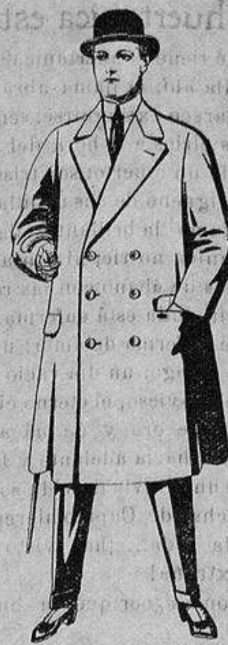
Gabanes de patén o cheviot, con cinturón. De ptas. 50 a 110