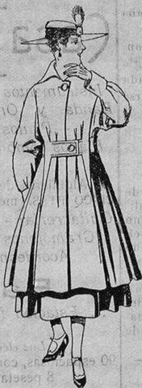
Abrigo de patén en color, para señora. De ptas. 65 a 75