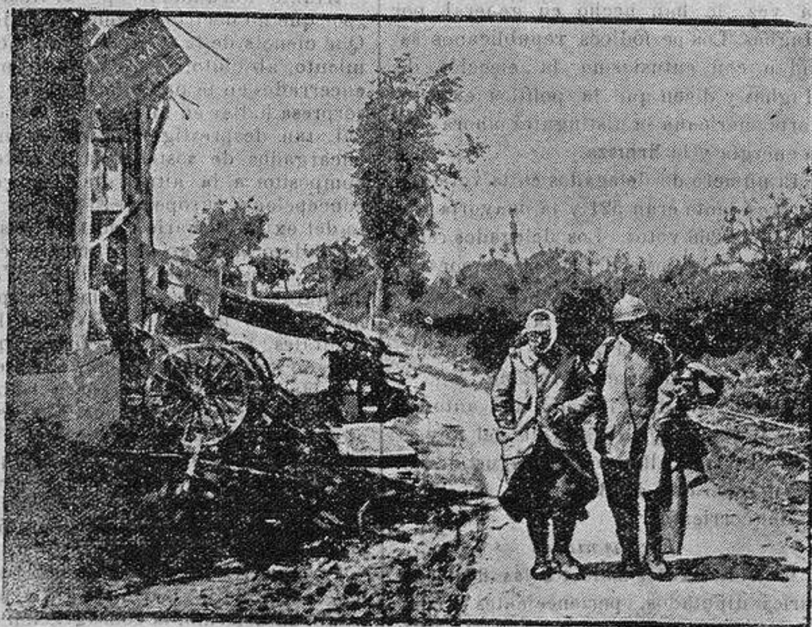
Puesto sanitario francés en unas ruinas

Estos no son sino meramente inútiles, en tanto que los que deben esta desgracia a la guerra, moralmente son más que los que los que escaparon con vida o no fueron a ella.