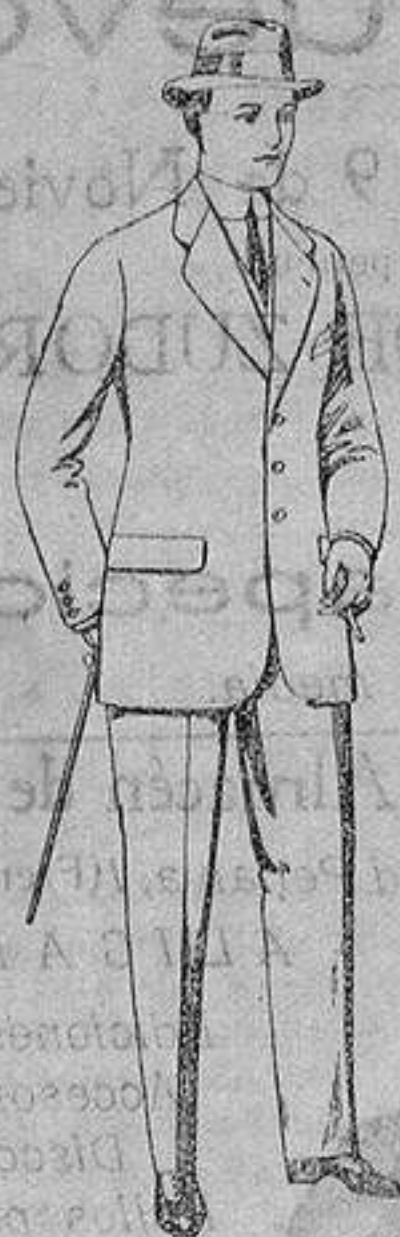
Trajes de cheviot, patén, etc. De ptas. 21 a 80

Madrid, Barcelona, Alicante, Almeria, Bilbao, Cádiz, Cartagena, Gijón, Granada Málaga, Palma de Mallorca, Santander, Sevilla, Valencia, Valladolid y Zaragoza.