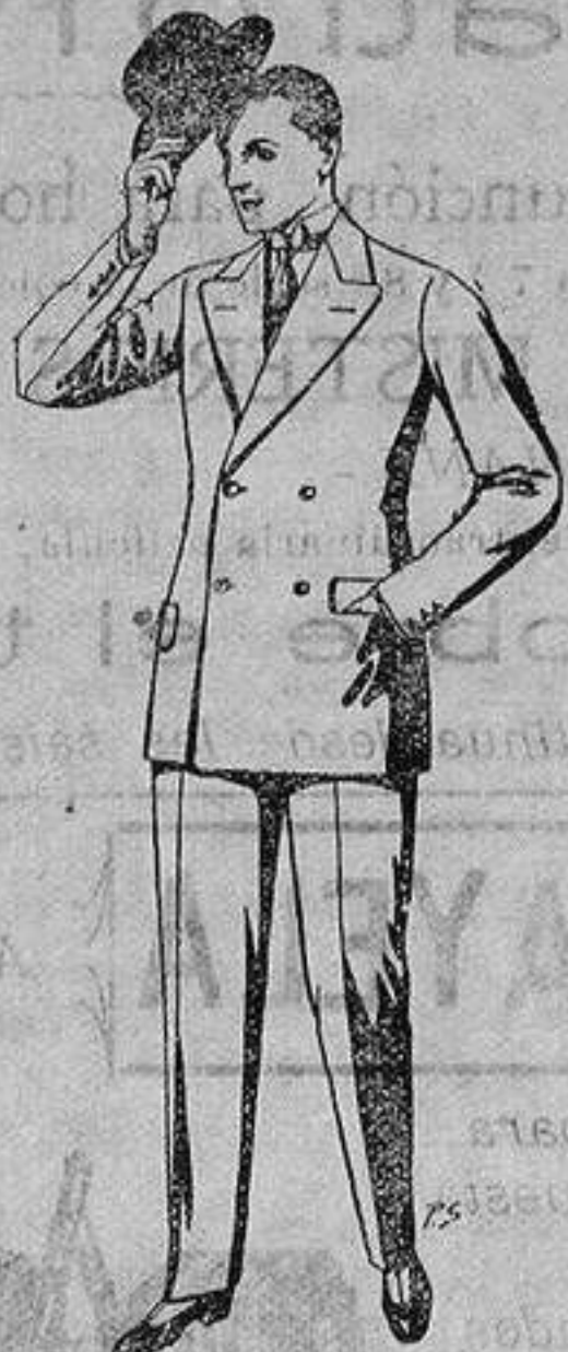
Trajes de cheviot, patén, etc. De ptas. 27 a 80