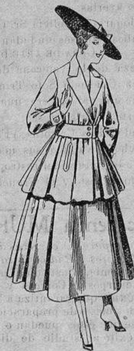
Traje de lana, para señora, en color negro y azul. De ptas. 85 a 100