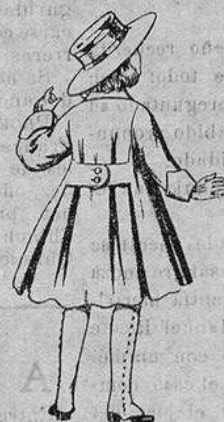
Abrigos de patén, para niñas de 4 a 9 años. De ptas. 15 a 17

Precio Fijo - Ventas al contado Pídase el Catálogo General