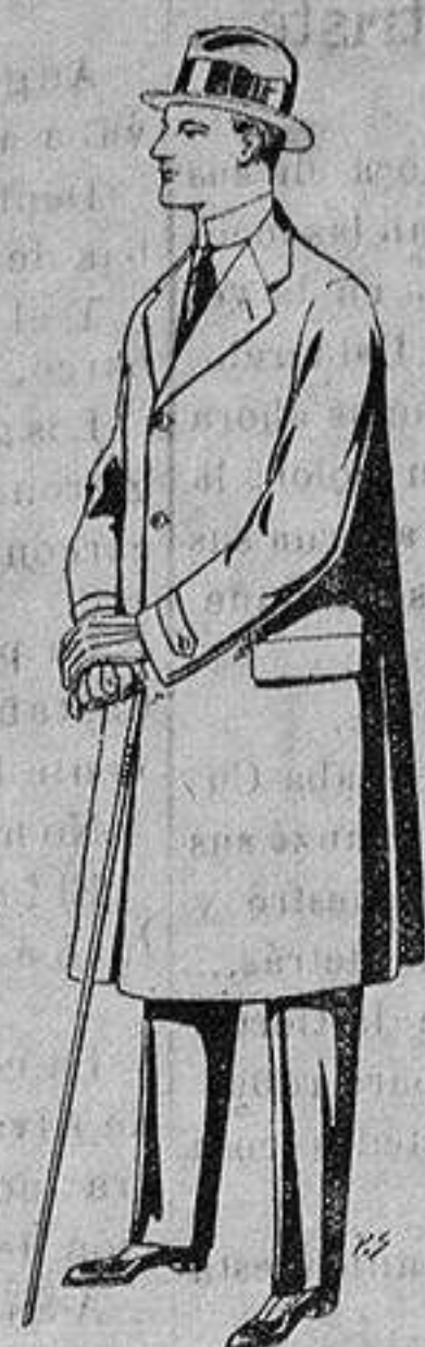
Gabanes de tejido pluma o ratina. De ptas. 33 a 110