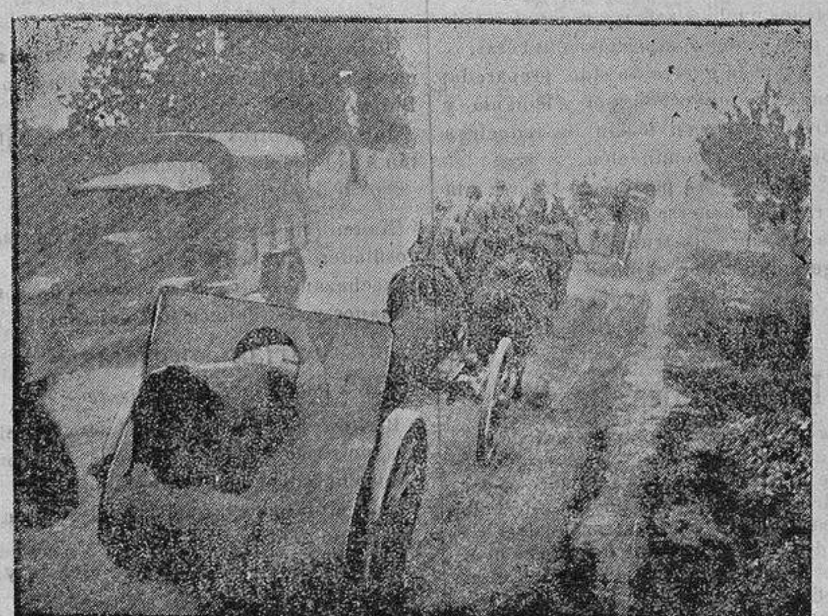
AVANSE DE ARTILLERÍA