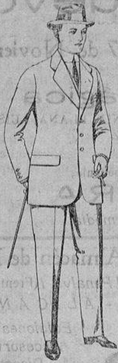
Trajes de cheviot, patén, etc. De ptas. 21 a 80

Madrid, Barcelona, Alicante, Almería, Bilbao, Cádiz, Cartagena, Gijón, Granada Málaga, Palma de Mallorca, Santander, Sevilla, Valencia, Valladolid y Zaragoza.