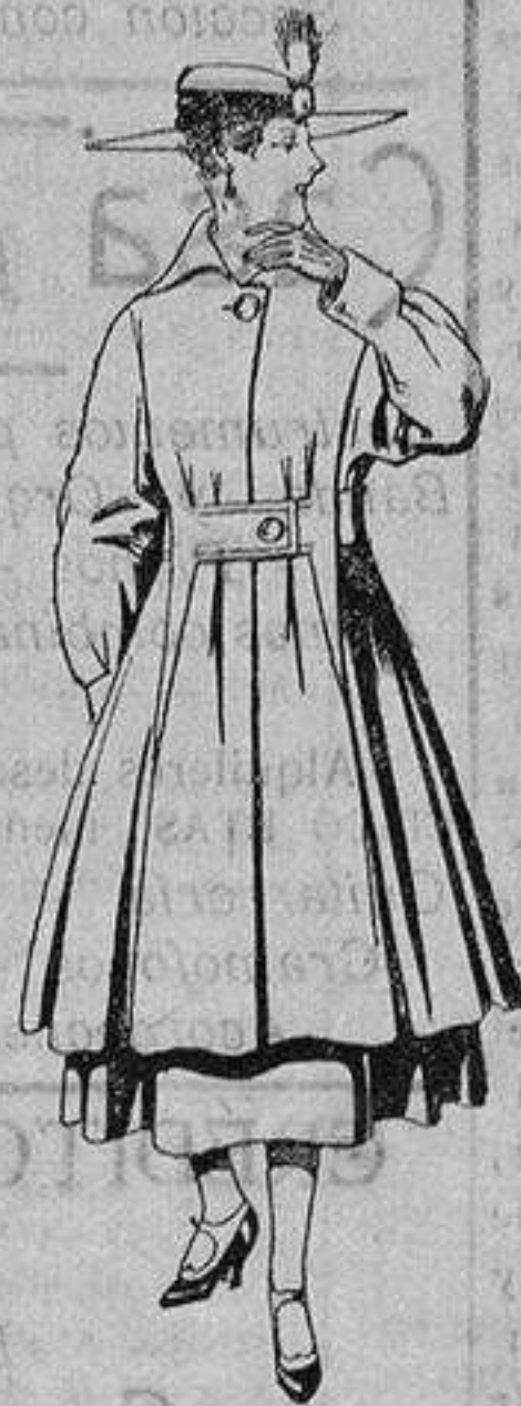
Abrigo de patén en color, para señora. De ptas. 65 a 75