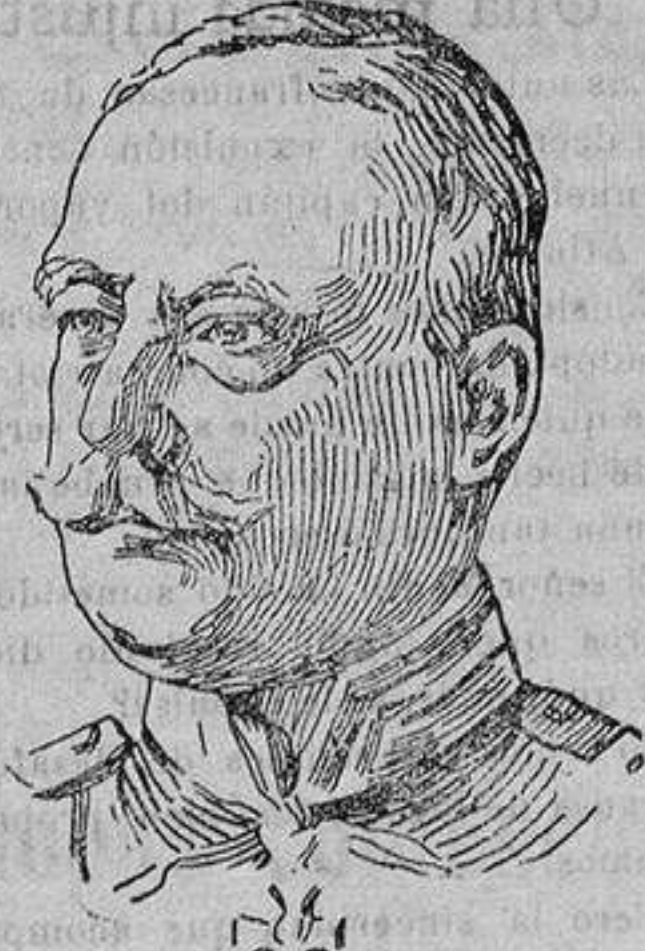
General barón de Czibulka que manda el ejército húngaro que lucha contra los rumanos en Transilvania