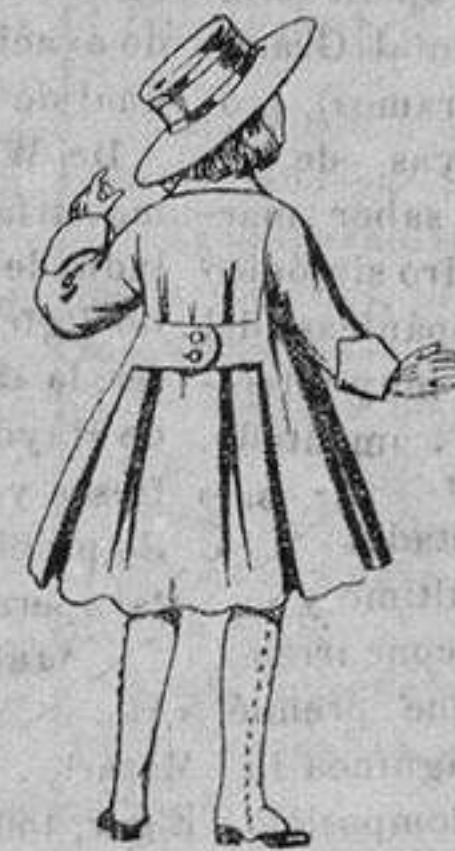
Abrigos de patén, para niñas de 4 a 9 años. De ptas. 15 a 17

Precio Fijo - Ventas al contado Pídase el Catálogo General