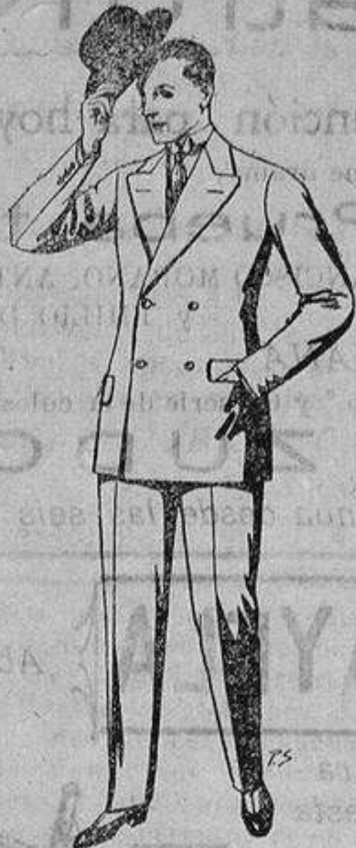
Trajes de cheviot, patén, etc. De ptas. 27 a 80