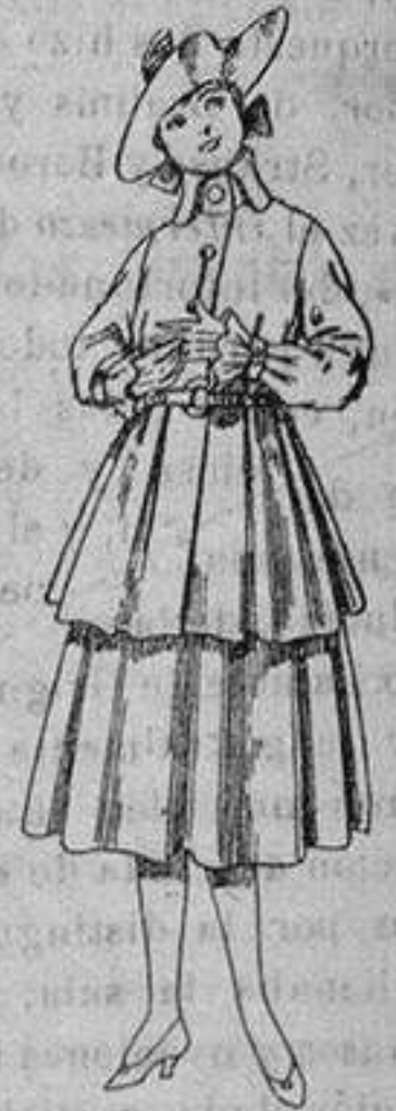
Trajes de lana, para jovencitas de 12 a 15 años. De ptas. 45 a 55