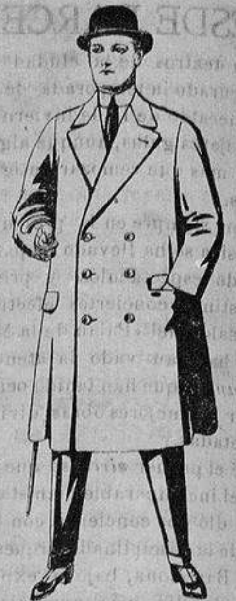
Gabanes de patén o cheviot, con cinturón. De ptas. 50 a 110