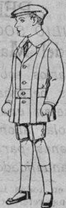
Trajes de patén para niños de 4 a 9 años. De ptas. 12 a 33

SECCIONES: Peletería, Camisería, Géneros de Punto, Corbatería, Guantería, Sombrerería, Zapatería, Paraguas, Bastones y Artículos de Viaje.