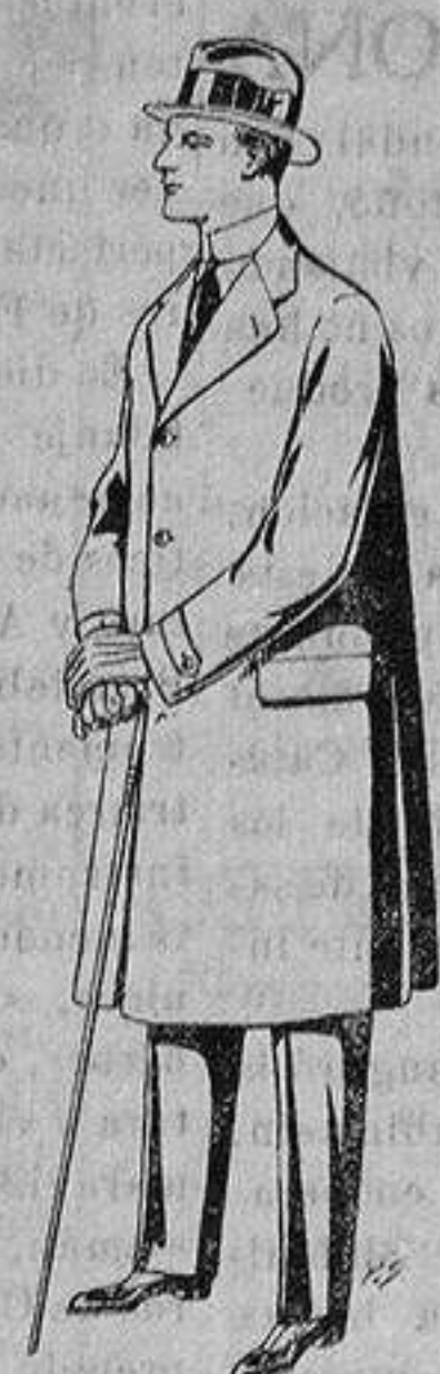
Gabanes de tejido de pluma o ratina. De ptas. 33 a 110