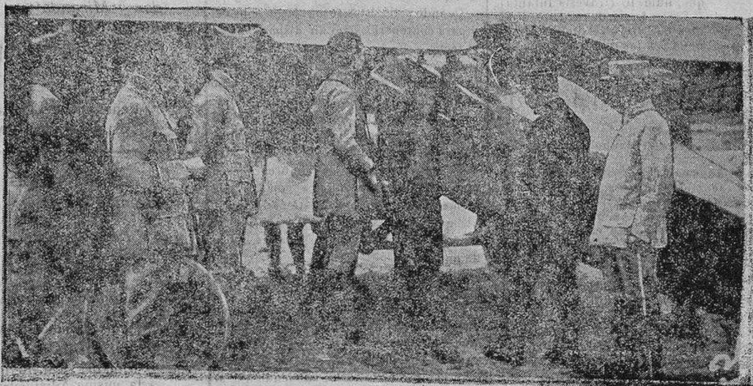
EL AVION «VIEUX CHARLES»