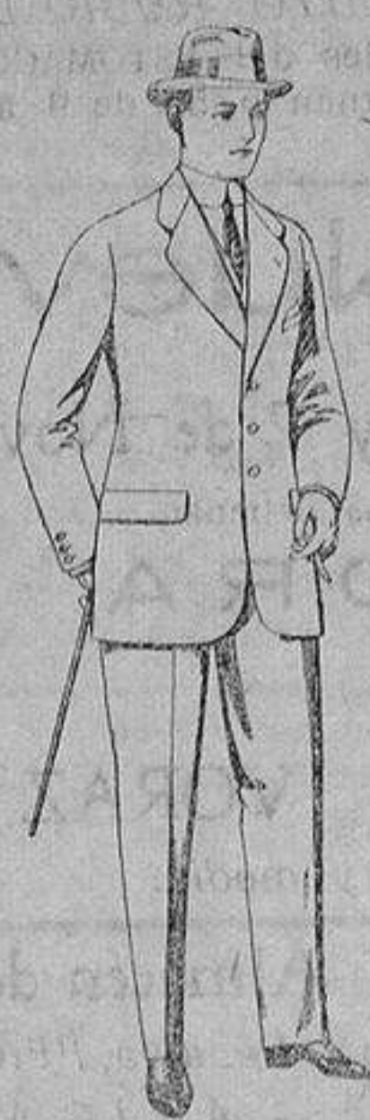
Trajes de cheviot, patén, etc. De ptas. 21 a 80

Madrid, Barcelona, Alicante, Almería, Bilbao, Cádiz, Cartagena, Gijón, Granada, Málaga, Palma de Mallorca, Santander, Sevilla, Valencia, Valladolid y Zaragoza.