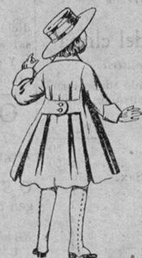
Abrigos de patén, para niñas de 4 a 9 años. De ptas. 15 a 17

Precio Fijo - Ventas al contado Pídase el Catálogo General