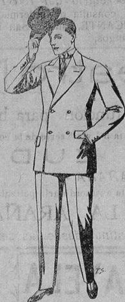
Trajes de cheviot, patén, etc. De ptas. 27 a 80