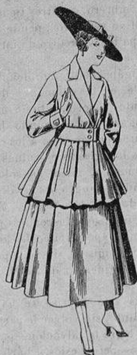
Traje de lana, para señora, en color negro y azul. De ptas. 85 a 100