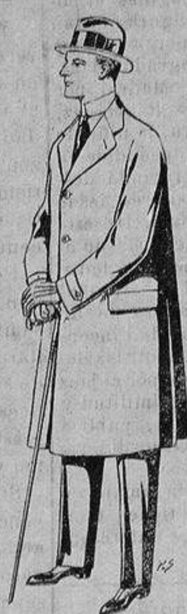
Gabanes de tejido pluma o ratina. De ptas. 33 a 110