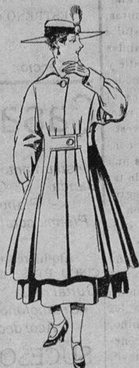
Abrigo de patén en color, para señora. De ptas. 65 a 75