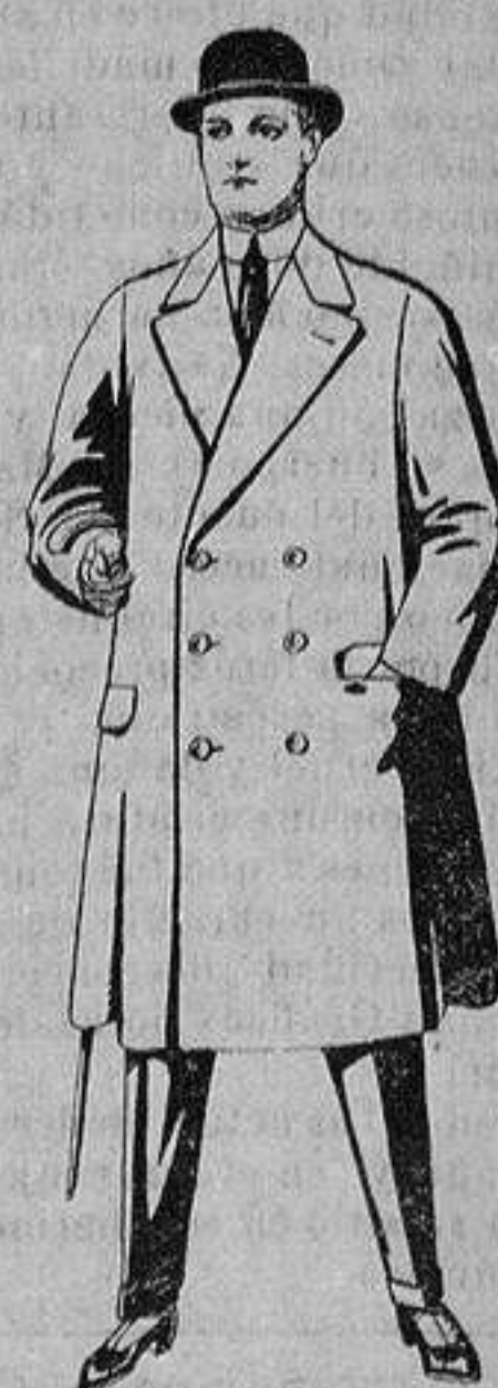
Gabanes de patén o cheviot, con cinturón. De ptas. 50 a 110