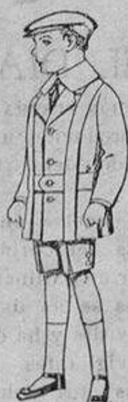
Trajes de patén para niños de 4 a 9 años. De ptas. 12 a 33