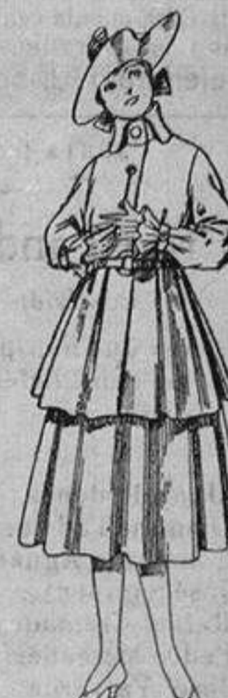
Trajes de lana, para jovencitas de 12 a 15 años. De ptas. 45 a 55