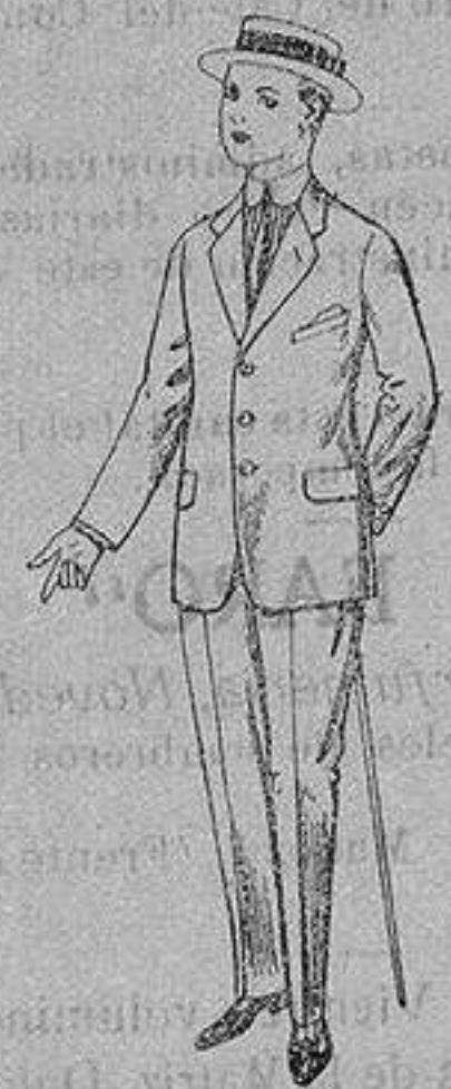
Trajes de lanilla, vicuña, etc. para juvenitos de 15 a 16 años. De ptas. 17 a 48