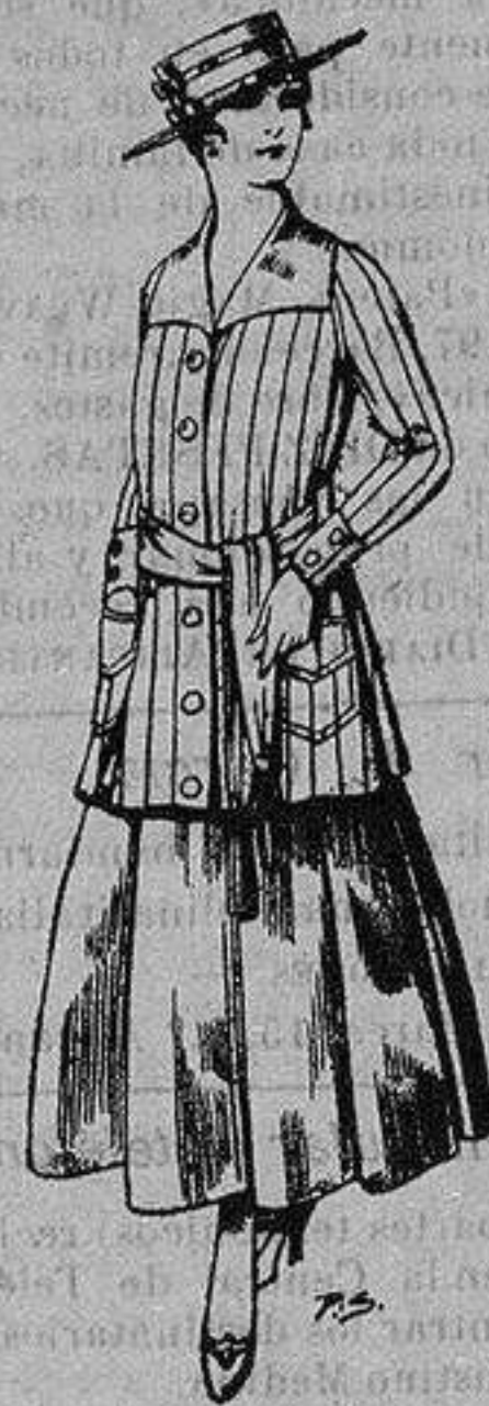
Paletot de tricof de seda colores lisos A ptas. 39