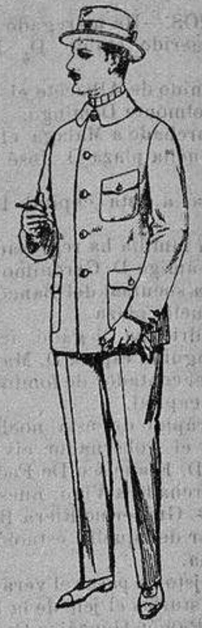
Guerreras de dril crudo, kaki o blanco De ptas 7'50 a 10