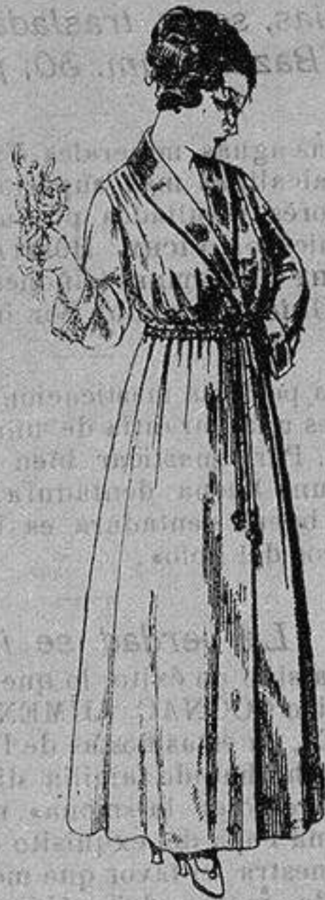
Bata crespón colores varios, cuello y boca-manga seda. De ptas. 15 a 20