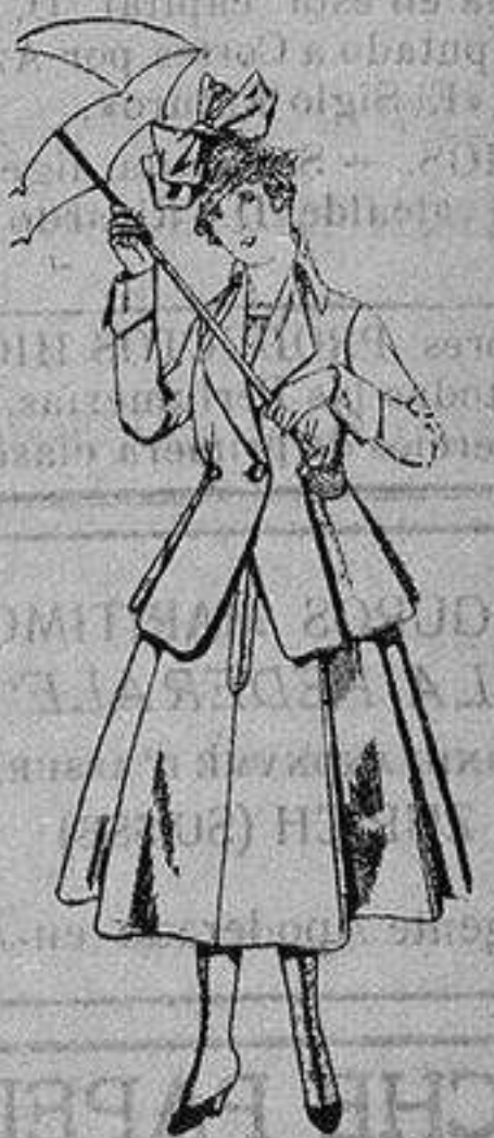
Trajes de lanilla negra azul y color, para juvenitas de 13 a 16 años. De ptas. 50 a 55