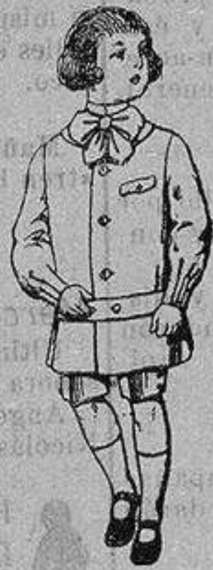
Trajes de lanilla en colores para niños de 4 a 9 años. De ptas. 9 a 18

Precio Fijo - Ventas al contado Pídase el Catálogo General