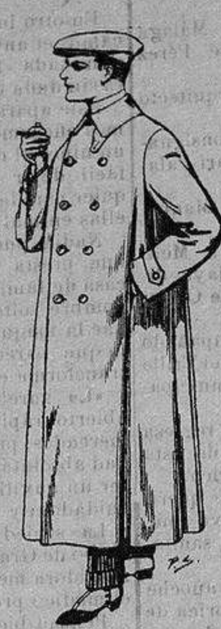
Guardapolvos de dril crudo o gris De ptas. 12'50 a 30

Precio Fijo - Ventas al contado Pídase el Catálogo General