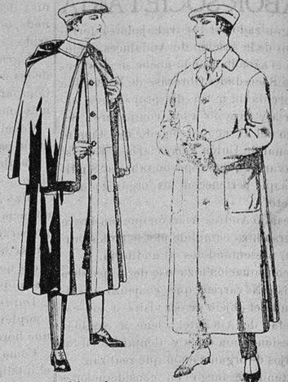
Impermeables forma mackferland, en negro y azul. De ptas. 55 a 100. Guardapolvos de dril igual al modelo. De ptas 6 a 11