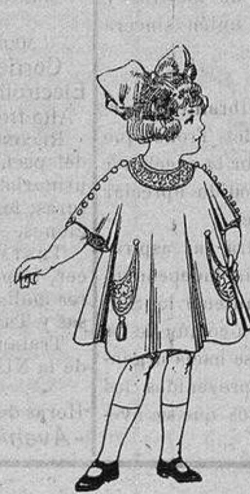
Vestidos de lanilla para niñas de 4 a 9 años. De ptas. 80 a 38

Precio Fijo - Ventas al contado Pídase el Catálogo General