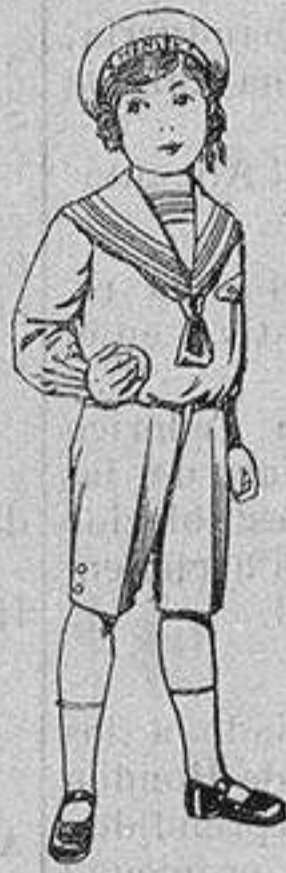
Trajes marinera de vicuña azul para niños de 4 a 9 años. De ptas. 6 a 20

Camisería, Géneros de Punto, Corbatería, Guantería, Sombrerería, Zapatería, Paraguas, Bastones y Artículos de Viaje.