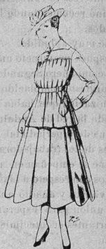
Trajes lanilla para jovencitas de 13 a 16 años. De ptas. 50 a 55