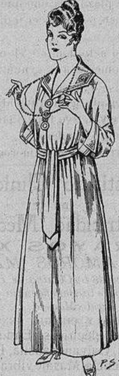
Batas de crepón, colorcuello bordado. De ptas. 10 a 15