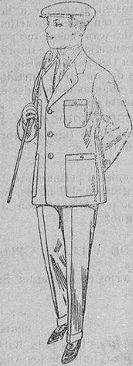
Trajes modelo sport, de dril listado, para jovencitos de 15 a 16 años. De ptas. 17 a 48.