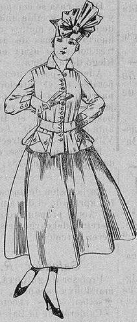
Trajes de lanilla, negra, azul y color. A ptas. 70