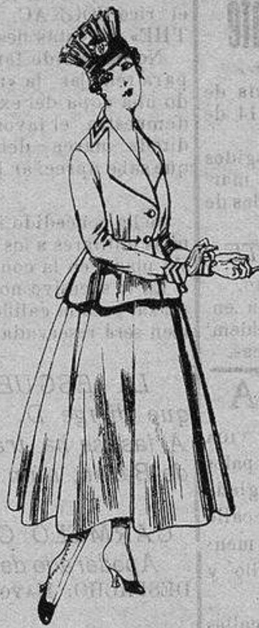
Trajes de lanilla para Señora A ptas. 80