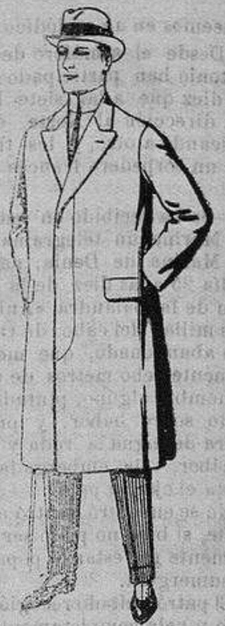
Pardesus de melton o vigonia De ptas. 25 a 100