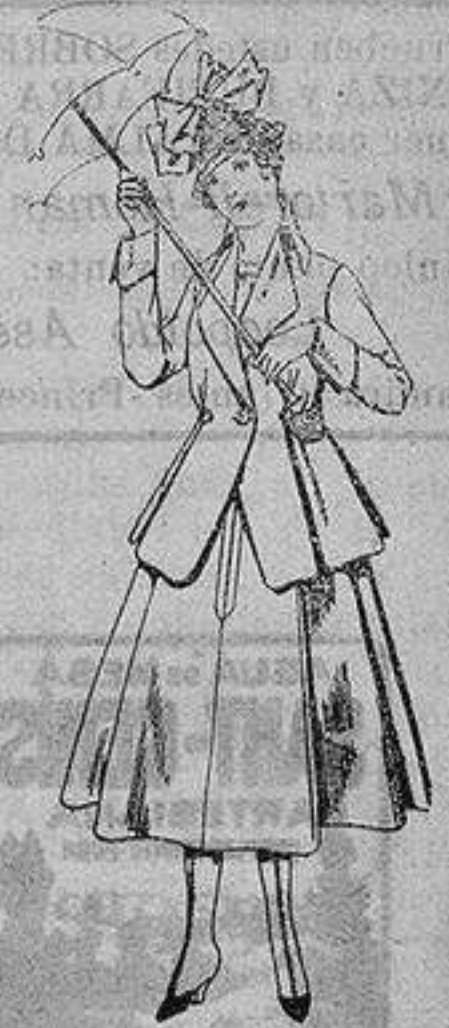
Trajes de lanilla para jovencitas de 13 a 16 años De ptas. 53 a 55