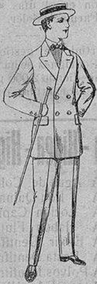
Trajes de lanilla, para jovencitos de 10 a 16 años. De ptas. 17 a 48