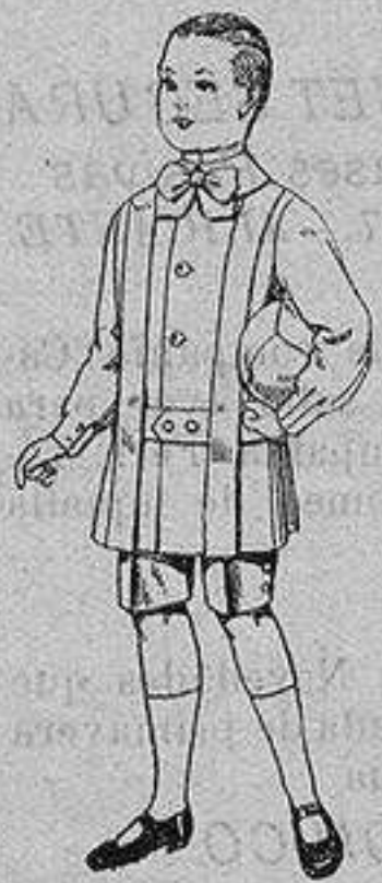
Trajes de lanilla para niños de 4 a 9 años De ptas. 12 a 31