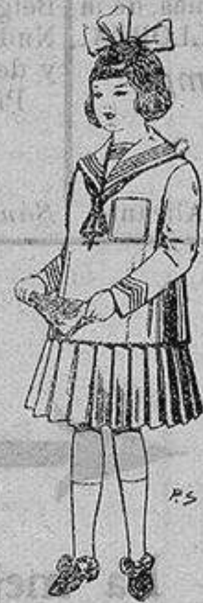
Trajes de lanilla para niñas de 4 a 12 años De ptas. 32 a 40