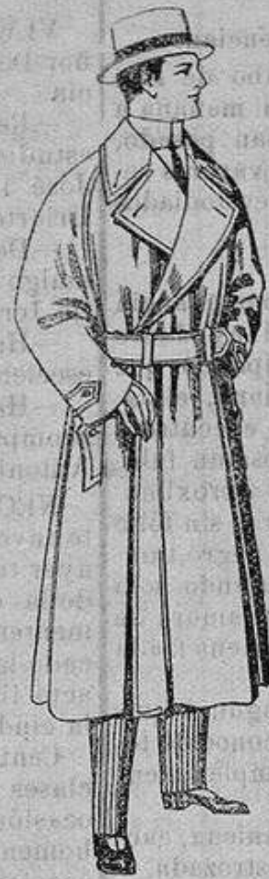
Gabanes impermea- bilizados en color beige. De ptas. 65 a 110