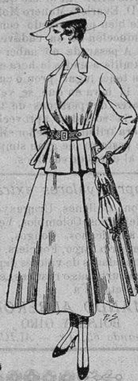
Trajes de lanilla para Señora A ptas. 70