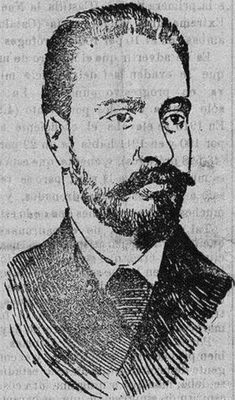
El presidente del Consejo de ministros de Rumanía Sr. Bratino

ramente algunos actos del actual Gobierno rumano. Ante el acaparamiento de los cereales rumanos para Inglaterra, el «Munchnar Heuste Nachrichten» ha declarado que el comercio rumano con Alemania es de escasa importancia. «El Berliner Tegeblatt» dice en tono un tanto agresivo, que será preciso exigir serias explicaciones a Rumanía acerca de cuales son sus intenciones para el porvenir.