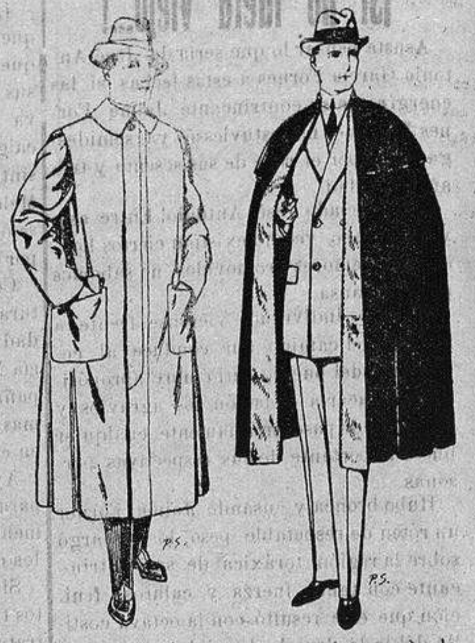
Impermeables forma gabán en color beige o gris De ptas. 35 a 100 Capas (enteras) de paño De ptas. 25 a 100