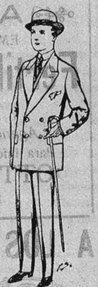
Trajes de patén, vicuña, etc., para niños de 10 a 16 años De ptas. 25 a 48