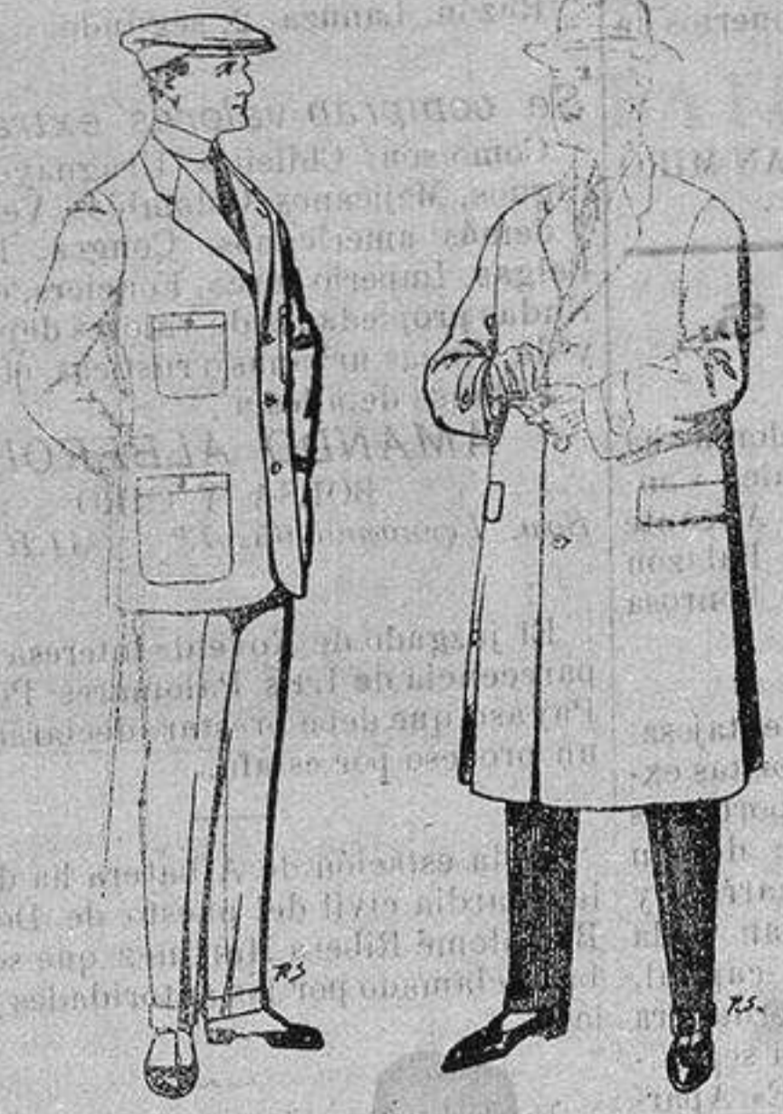
Trajes de cheviot corte elegante para "Sportman" De 35 a 50 ptas Gabanés de tejido pluma o satina De ptas. 30 a 100

Peletería, Camisería, Generos de Punto, Corbatería, Guantería, Sombrerería, Zapatería, Paraguas, Bastones y Artículos de Viaje.