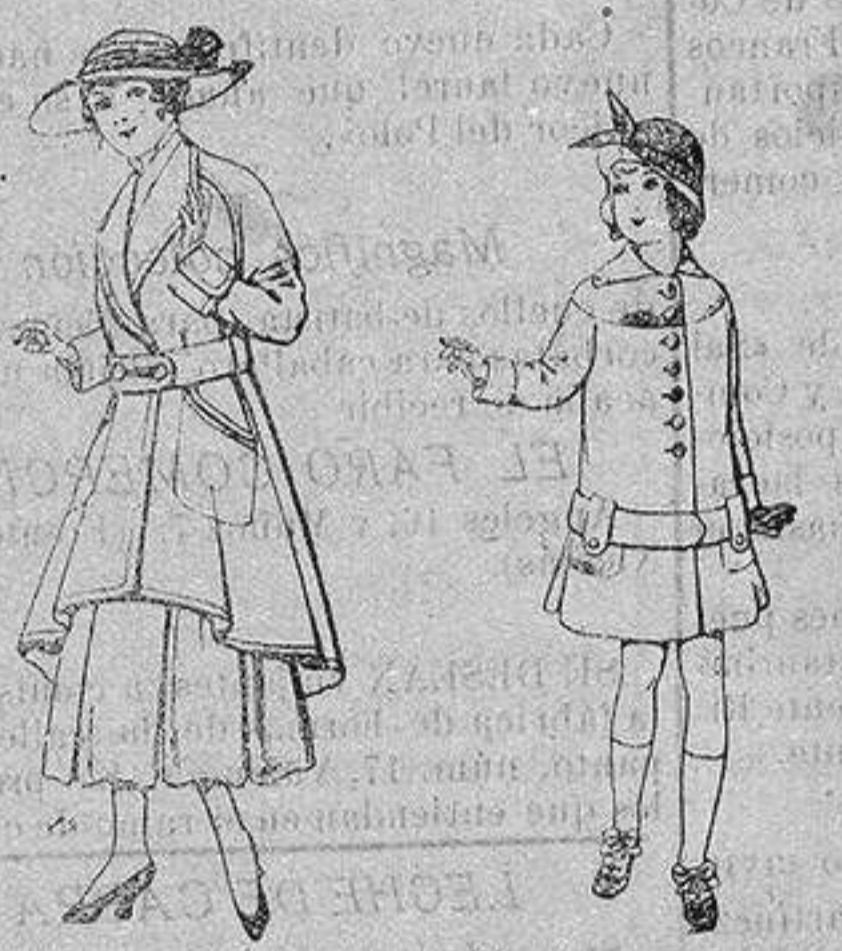
Abrigos de patén para jovencitas de 13 a 16 años De ptas. 25 a 35 Abrigos de patén para niños de 4 a 12 años De ptas. 15 a 25