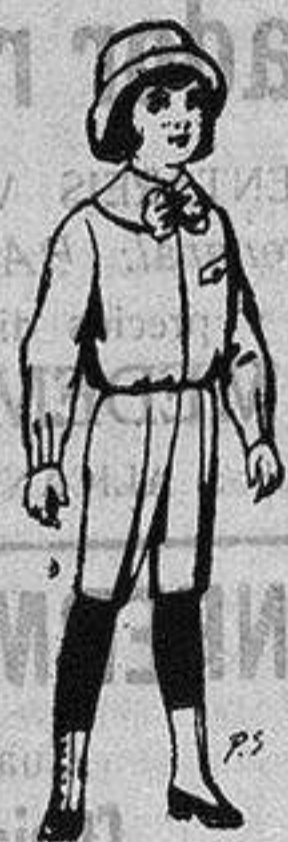
Trajes de paté para niños de 4 a 9 años De ptas. 5 a 7'50