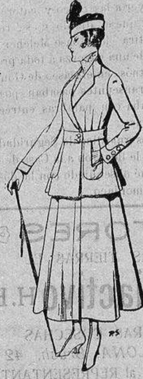
Trajes de lana negra azul y color, para señora De ptas. 50 a 55