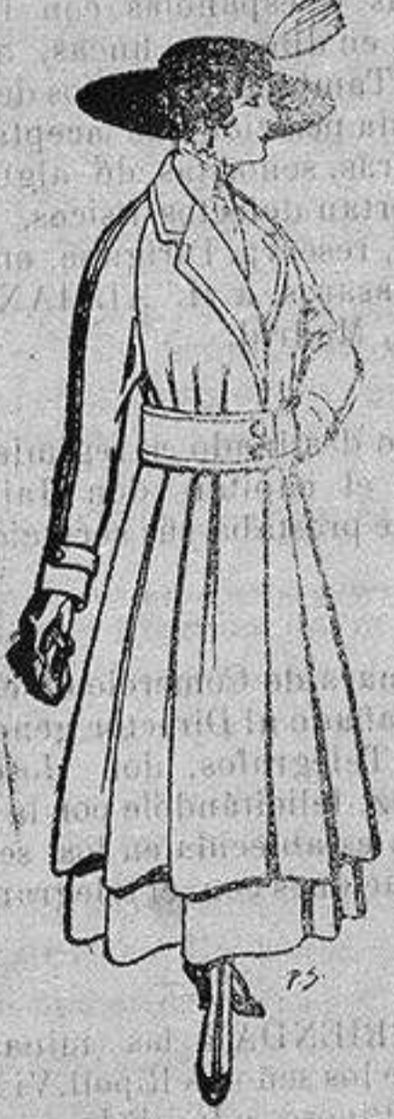
Abrigos de patén gran novedad para señora A ptas. 53.