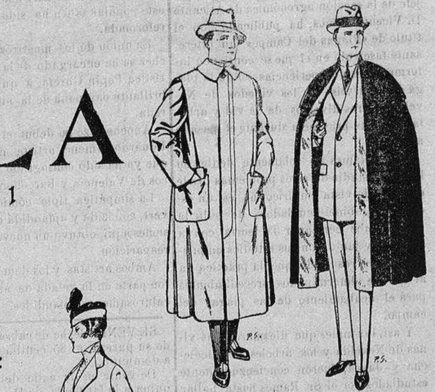
Impermeables forma gabán en color beige o gris De ptas. 35 a 100