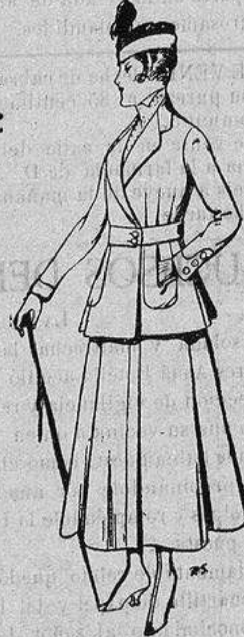
Trajes de lana negra azul y color, para señora De ptas. 50 a 55