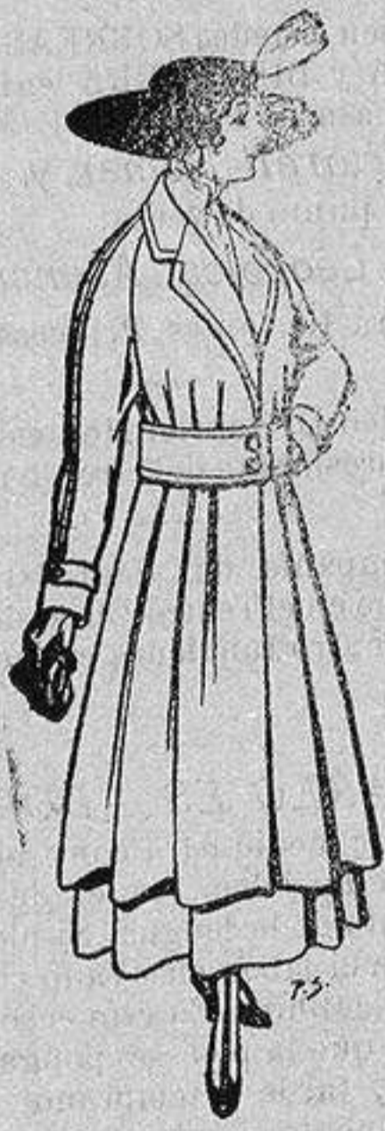
Abrigos de patén gran novedad para señora A ptas. 53