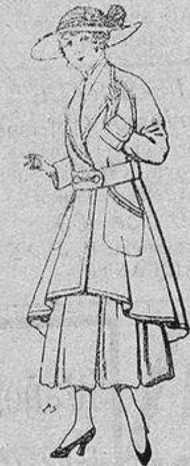
Abrigos de patén para jovencitas de 13 a 16 años De ptas. 25 a 35