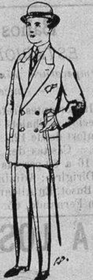
Trajes de patén, vicuña, etc., para niños de 10 a 16 años De ptas. 25 a 48