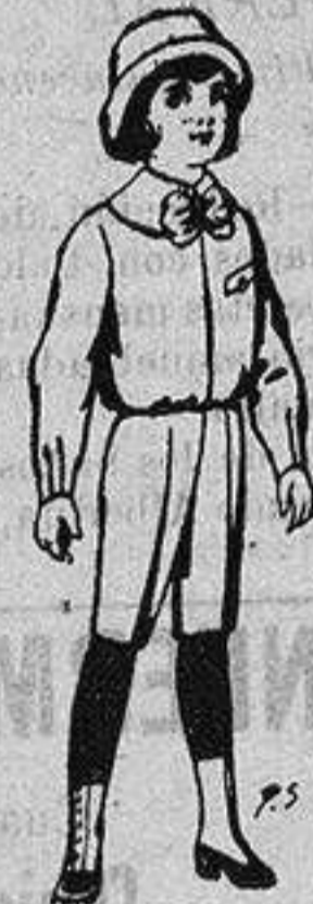
Trajes de patén para niños de 4 a 9 años De ptas. 5 a 7/50