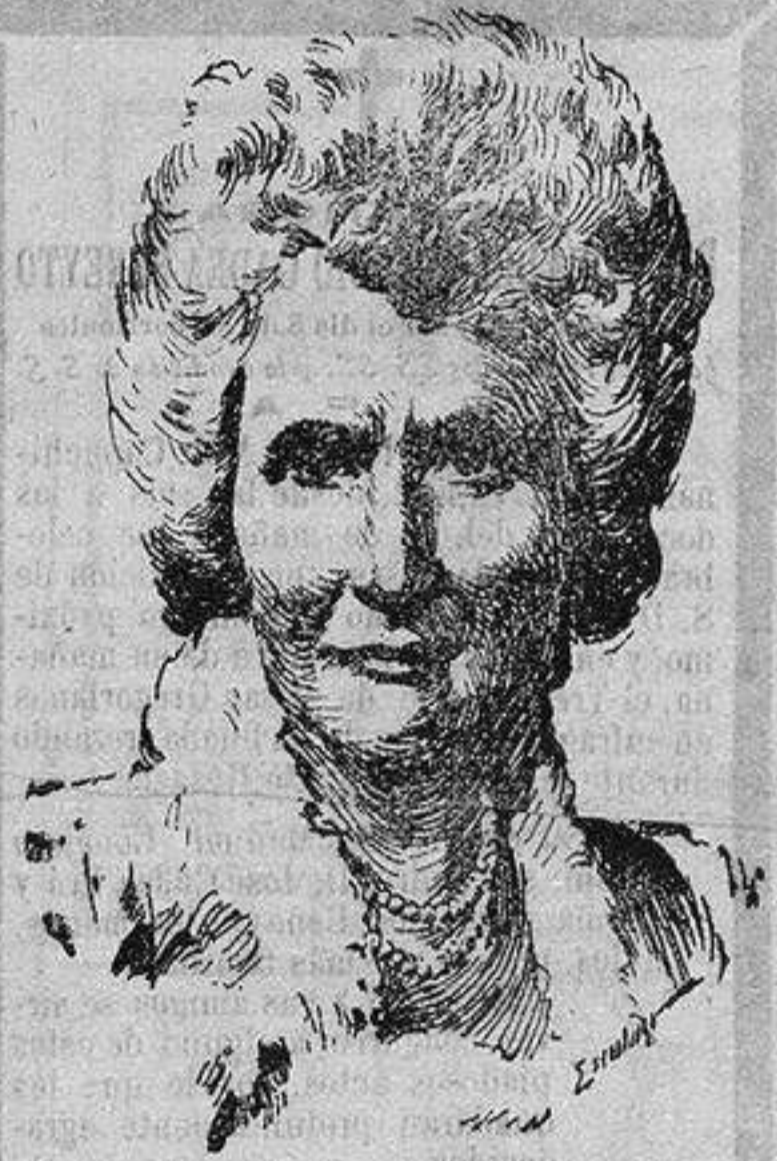
La reina Isabel de Hungría (Carmen Sylva) que ha renunciado a toda su lista civil para que, en vista de las circunstancias, sea empleada en obras de utilidad pública.