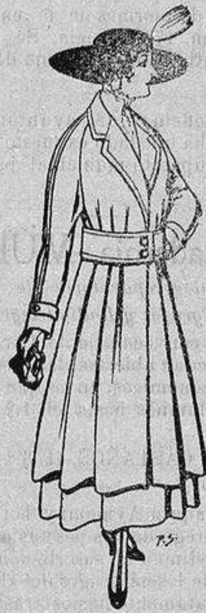
Abrigos de patén gran novedad para señora A ptas. 53