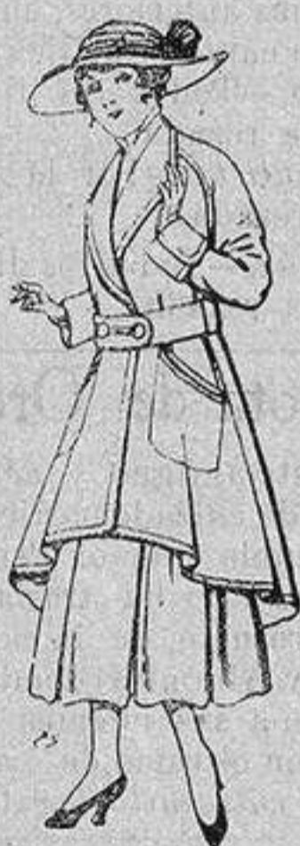
Abrigos de patén para jovencitas de 13 a 16 años De ptas. 25 a 35