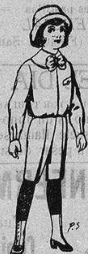
Trajes de patén para niños de 4 a 9 años De ptas. 5 a 7'50