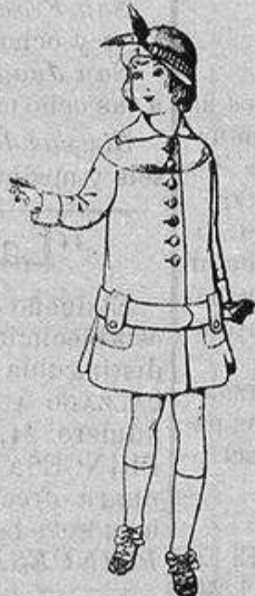
Abrigos de patén para niños de 4 a 12 años De ptas. 15 a 25