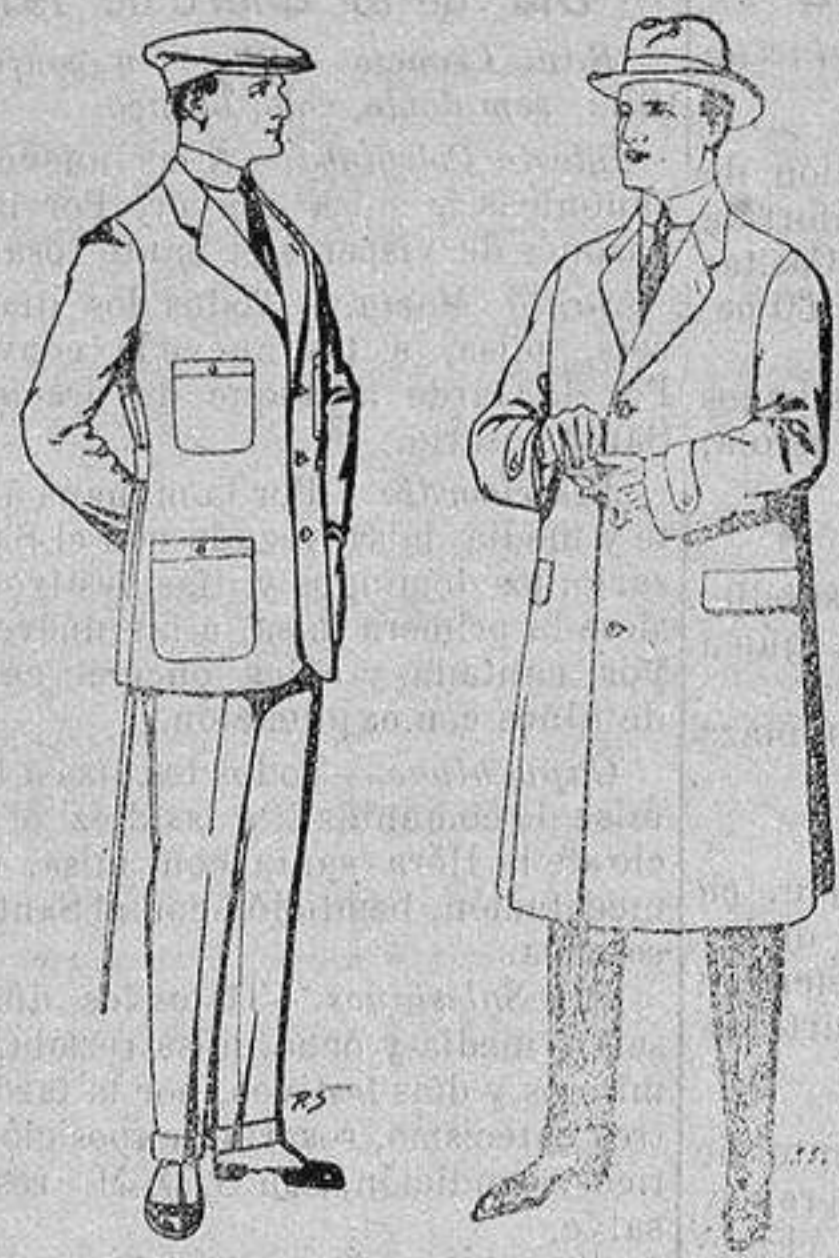
Trajes de cheviot corte elegante para «Sportman» De 35 a 50 ptas.