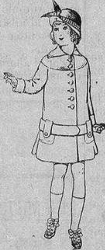
Abrigos de patén para niños de 4 a 12 años De ptas. 15 a 25

Ropas confeccionadas para Caballero, Señora, Niño y Niña