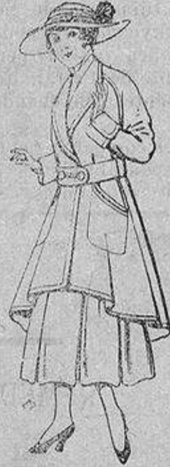
Abrigos de patén para jovencitas de 13 a 16 años De ptas. 25 a 35