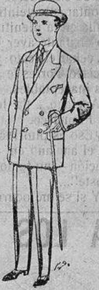
Trajes de patén, vicuña, etc., para niños de 10 a 16 años De ptas. 25 a 48