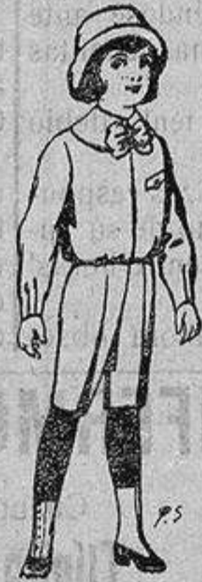
Trajes de patén para niños de 4 a 9 años De ptas. 5 a 7'50