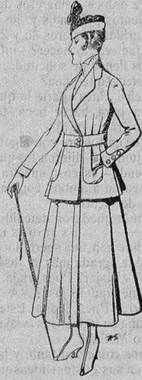
Trajes de lana negra azul y color, para señora De ptas. 50 a 55