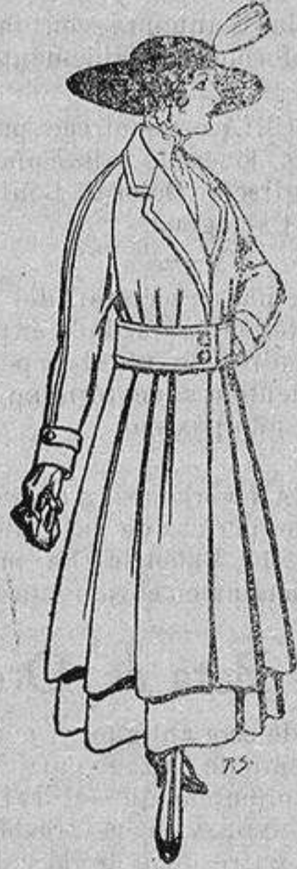
Abrigos de patén gran novedad para señora A ptas. 53