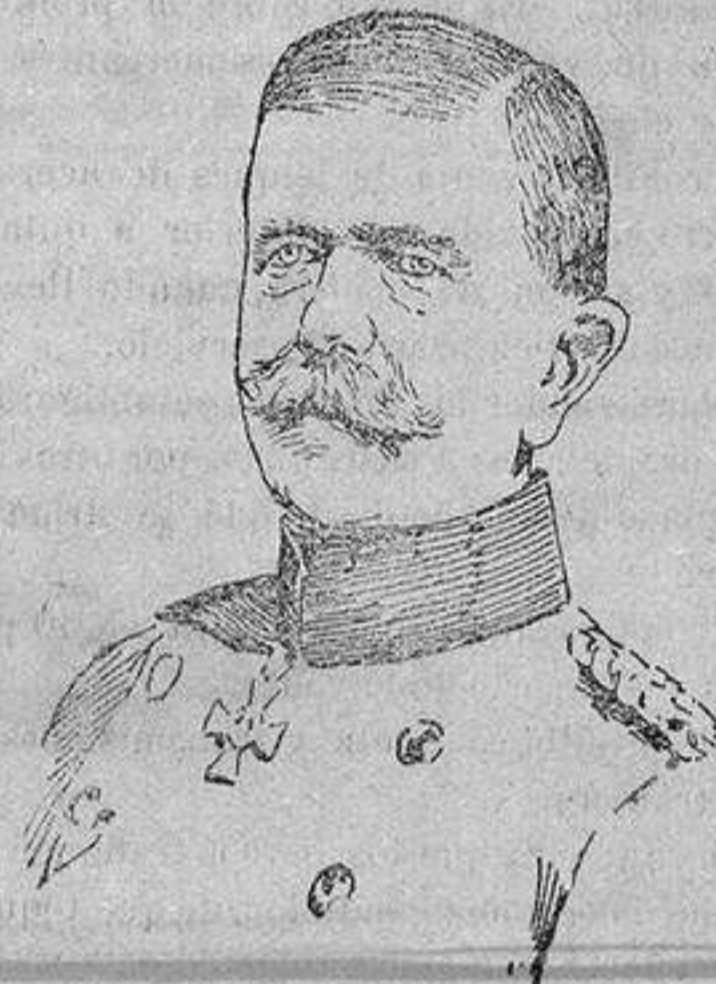
General VON SCHOLZ, jefe del E. M. del general Mackensen que según parece ha sucedido a éste en el mando del ejército alemán de los Balcanes