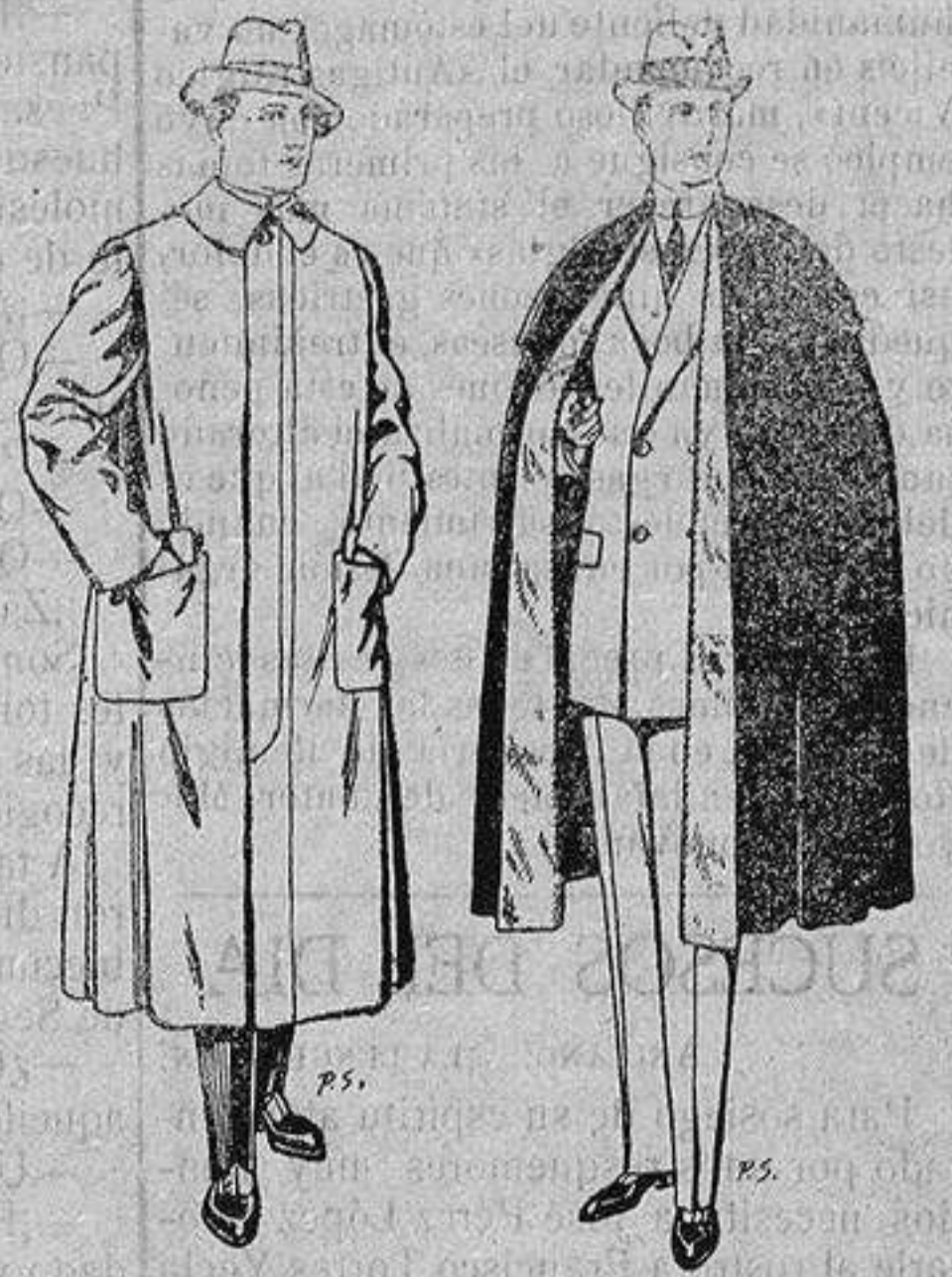
Impermeables forma gabán en color beige o gris De ptas. 35 a 100

Peletería, Camisería, Generos de Punto, Corbatería, Guantería, Sombrerería, Zapatería, Paraguas, Bastones y Artículos de Viaje.