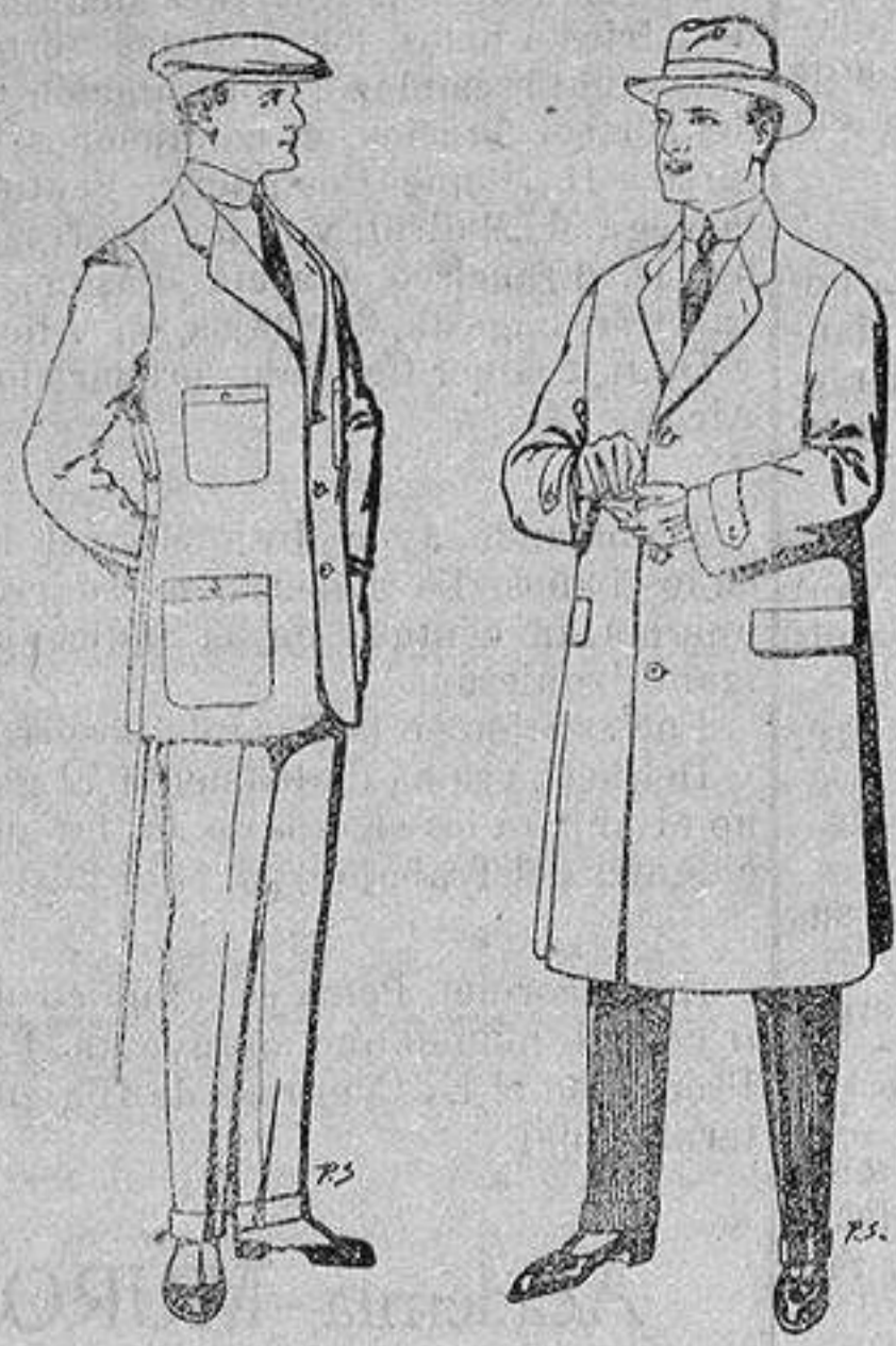
Trajes de cheviot corte elegante para «Sportman» De 35 a 50 ptas.

Madrid, Barcelona, Alicante, Almería, Bilbao, Cádiz, Cartagena, Gijón, Granada, Málaga, Palma de Mallorca, Santander, Sevilla, Valencia, Valladolid y Zaragoza