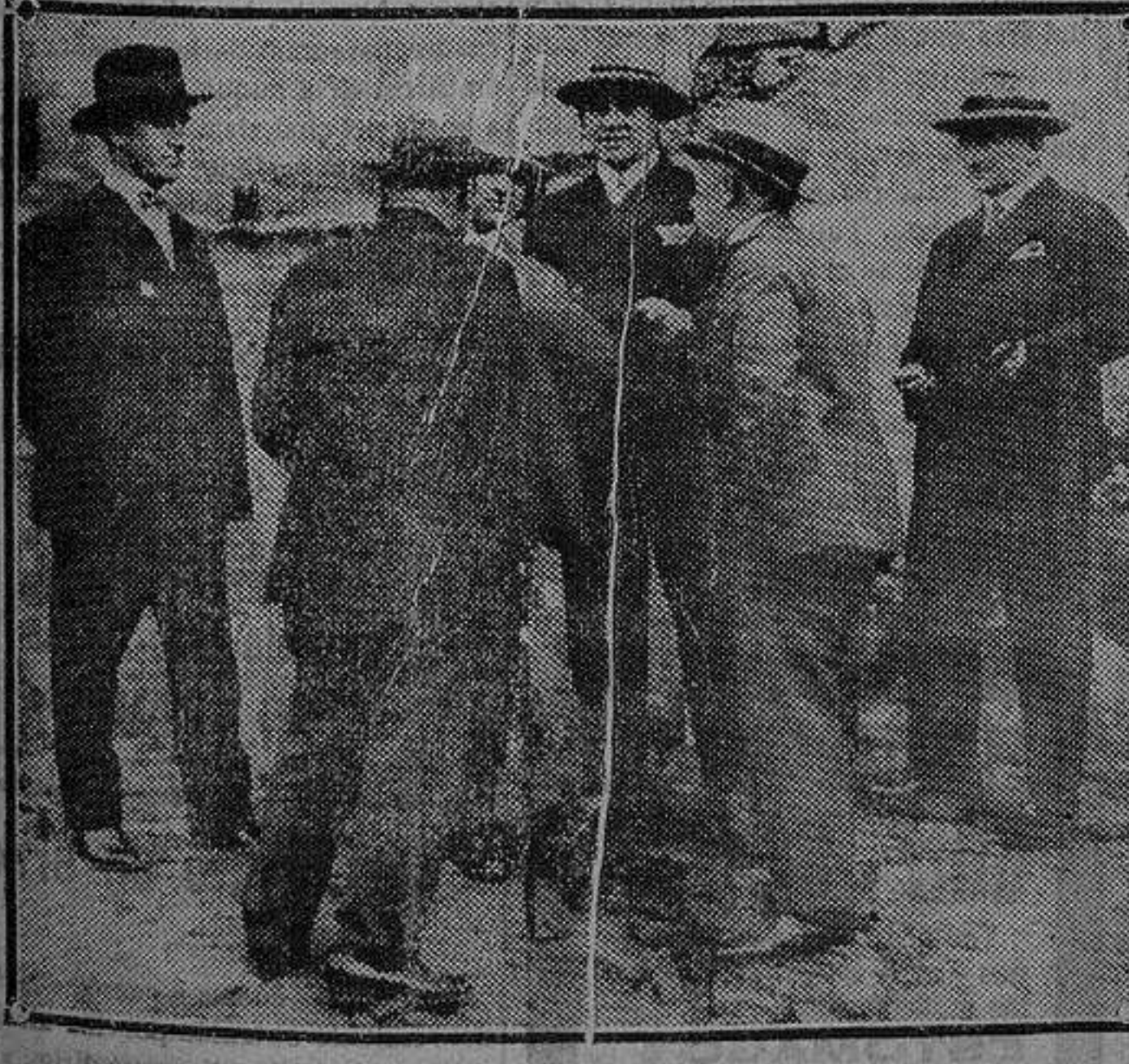
Los jefes de incendios de Berlín acompañados de los de Madrid durante la visita al teatro incendiado