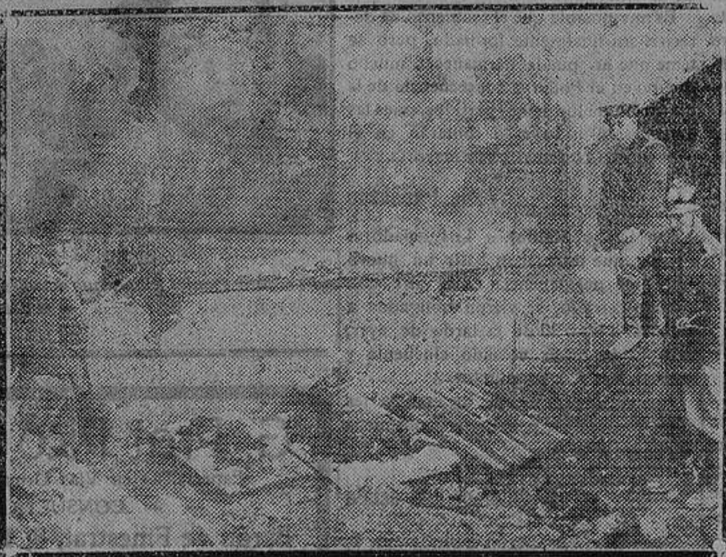
Los bomberos extrayendo ayer los nuevos cadáveres hallados entre los escombros de Novedades