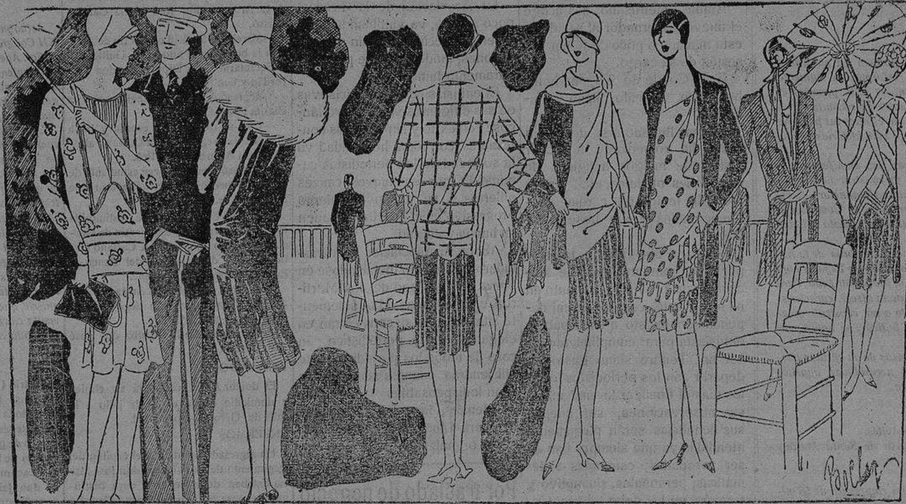
Telas de verano, confección elegante de complicada sencillez que imprime a la línea distinción suprema, son estos modelos admirables

de las telas que imperan; voile y crespón z muselina y foulard. Sedas pintadas.