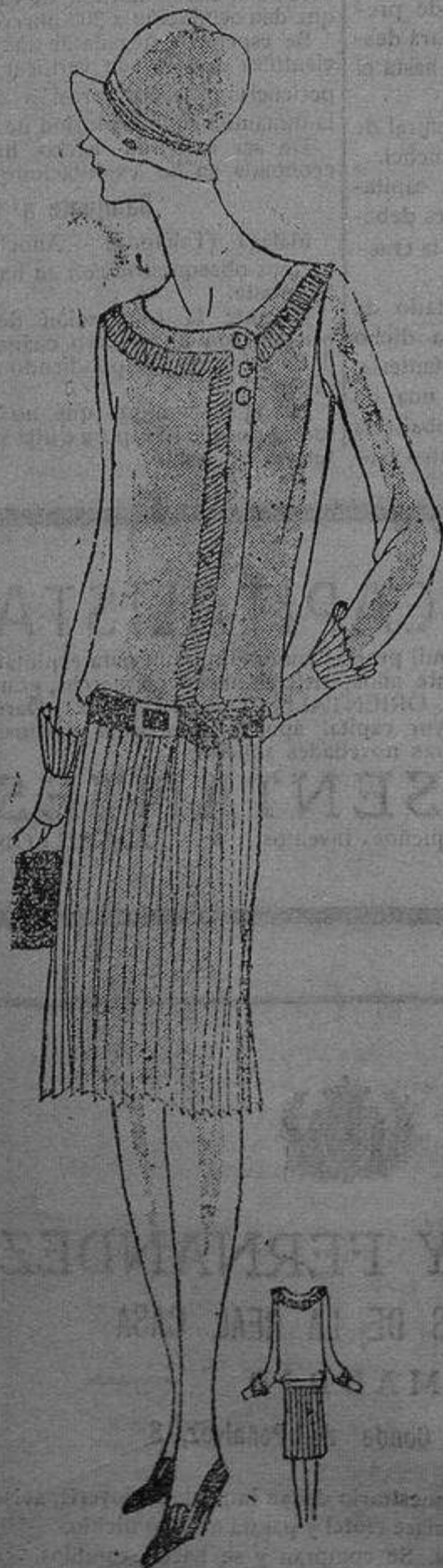
Elegante traje de calle

cara por las noches antes de acostarse; y se da una untura de cera y a la mañana siguiente se lavará la cara con agua caliente, pasando luego el algodón impregnado en alcohol alcanforado. Con este sencillo tratamiento las espinillas, barrillos o puntos negros, que dé las tres maneras se les llama, habrán desaparecido en pocas semanas. Dígame si no vale la pena imponerse ese pequeño sacrificio.