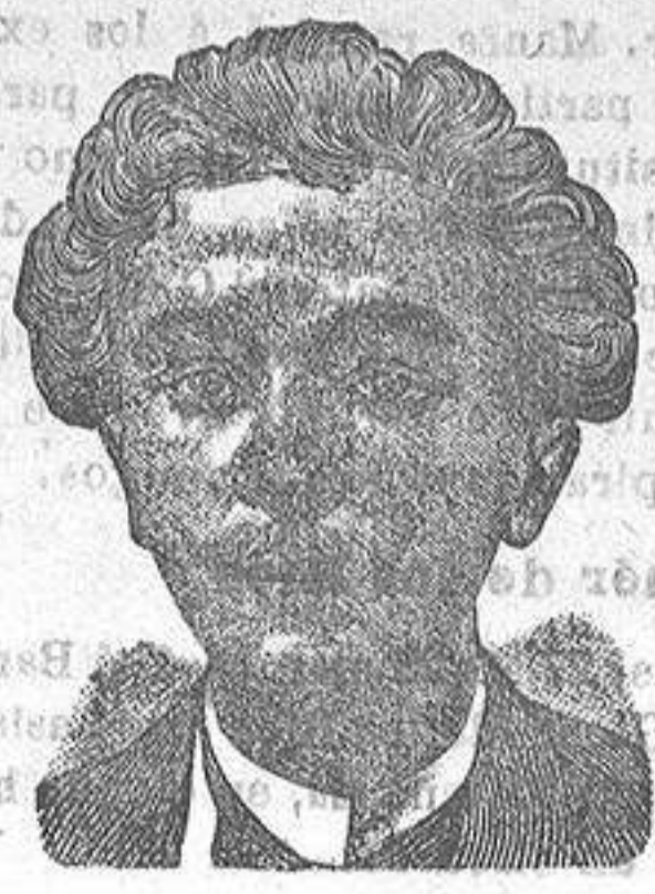
Después de la curación