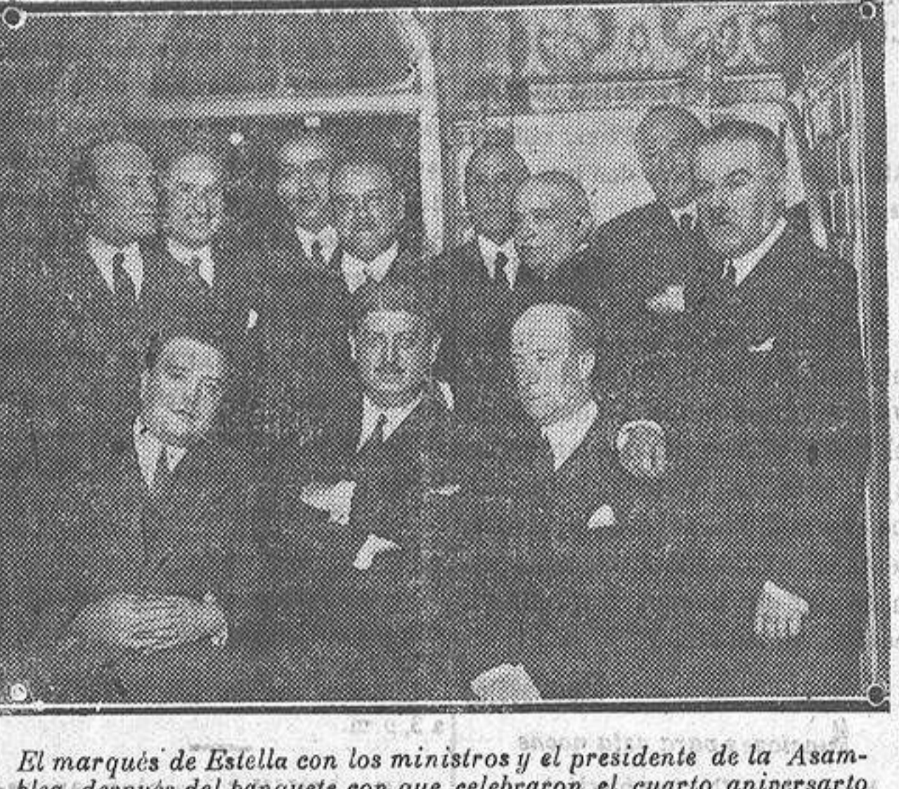
El marqués de Estella con los ministros y el presidente de la Asamblea, después del banquete con que celebraron el cuarto aniversario de la constitución del actual Gobierno.