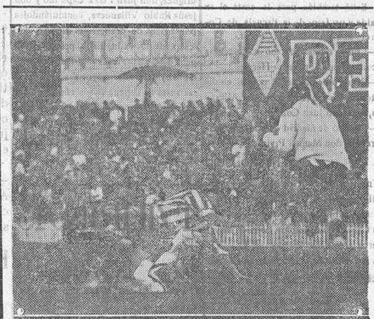
Una parada de Cabo en el partido de Liga jugado el domingo entre el Athletic de Madrid y el Europa de Barcelona.

Sereno, enérgico, imparcial, no consintió jugada sucia. Su mayor acierto fué expulsar a