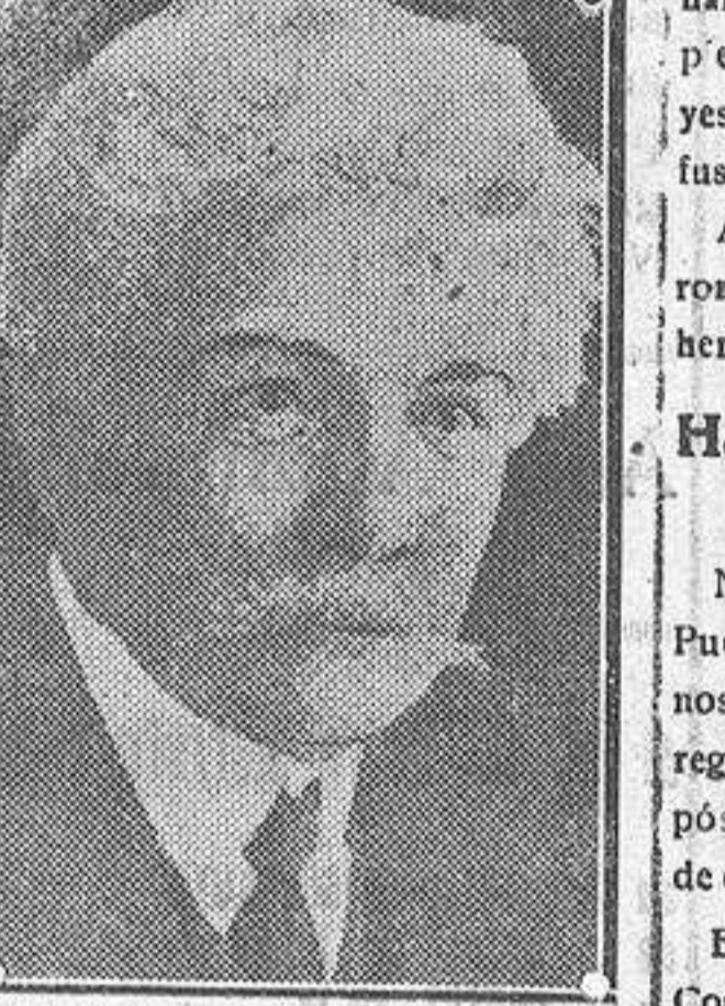
M. JASPAR que ha vuelto a encargarse de la presidencia del Gobierno belga